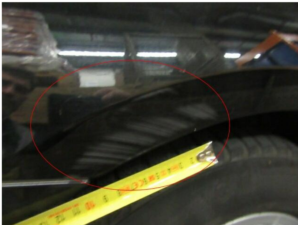
Bild 9 : Seitenteil hinten rechts, eingedellt, instandsetzen und lackieren mit Lackaufbau