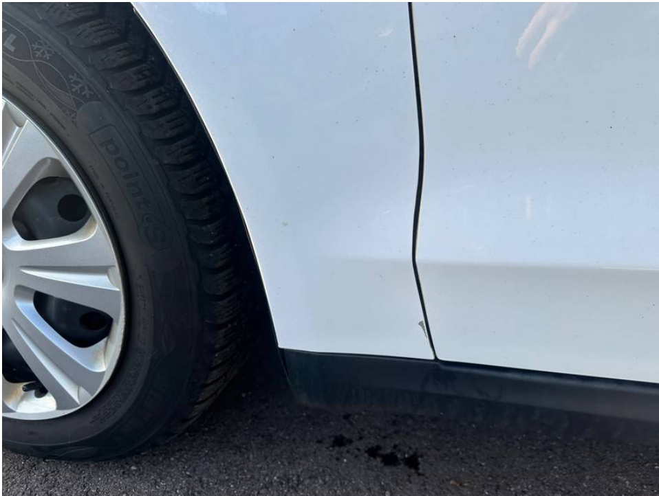
Lackschaden Kotflügel links