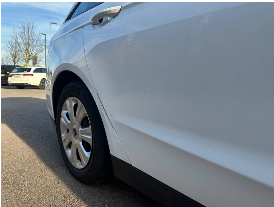
Streifschaden Tür und Seitenwand h.r.