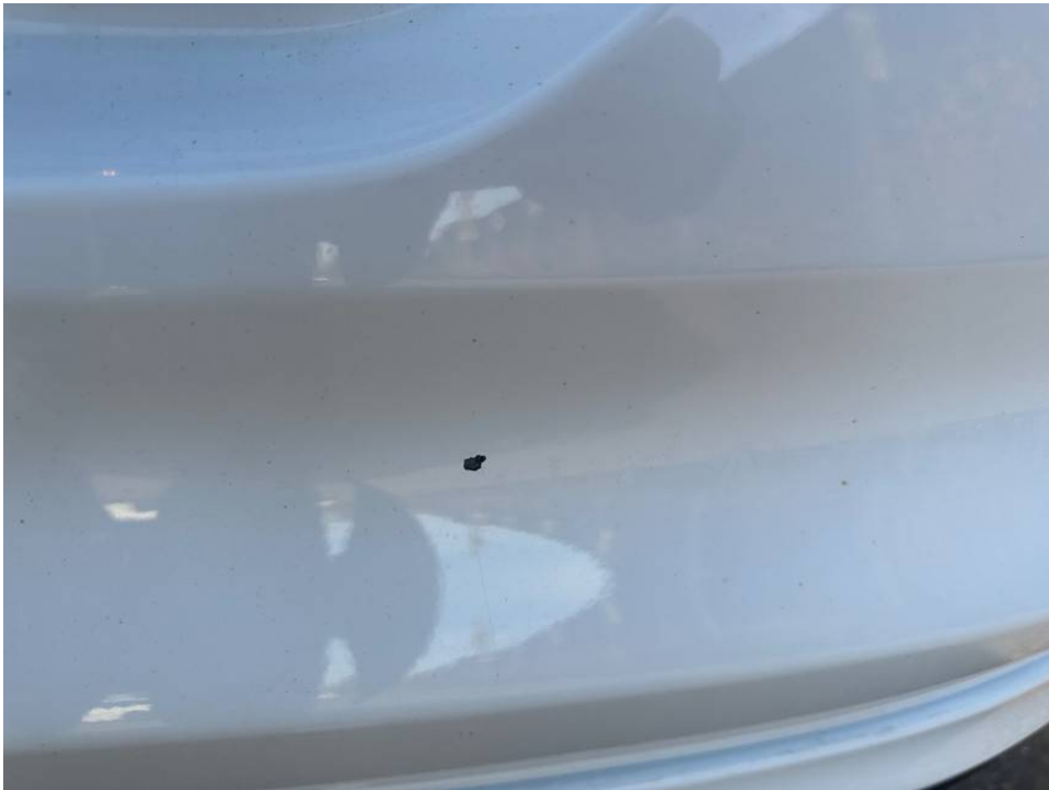
Lackschaden Heckklappe unterhalb