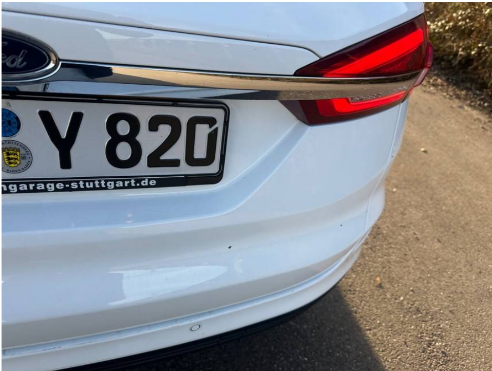
Lackschäden Stoßfänger hinten