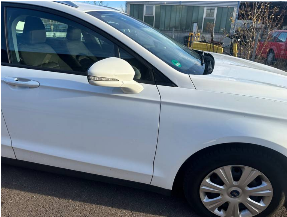
Lackkratzer Außenspiegel rechts