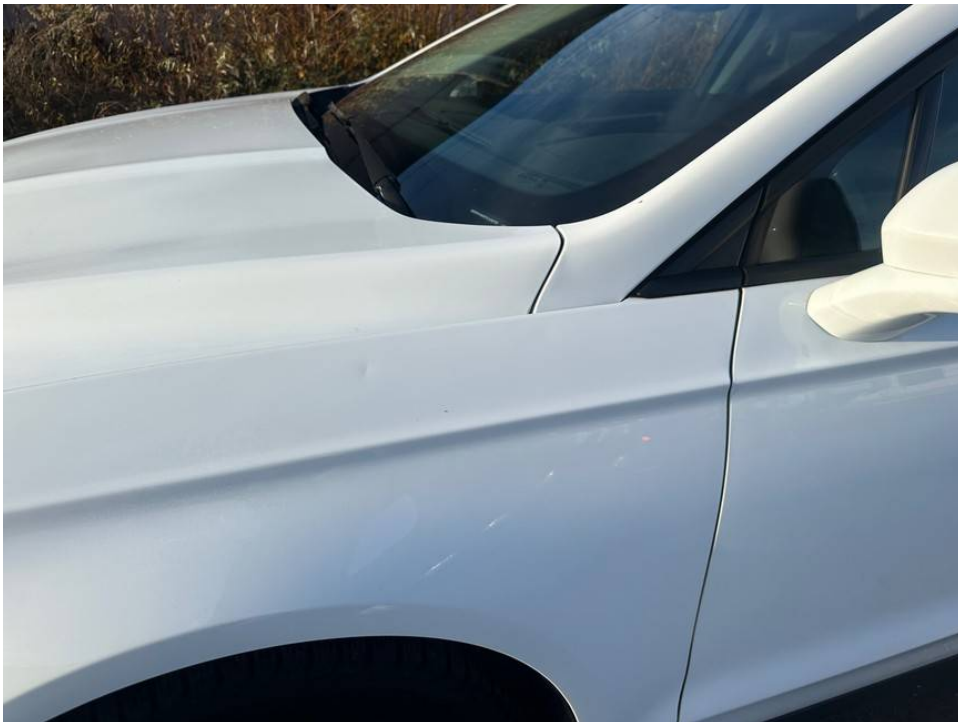
kleine delle Kotflügel links