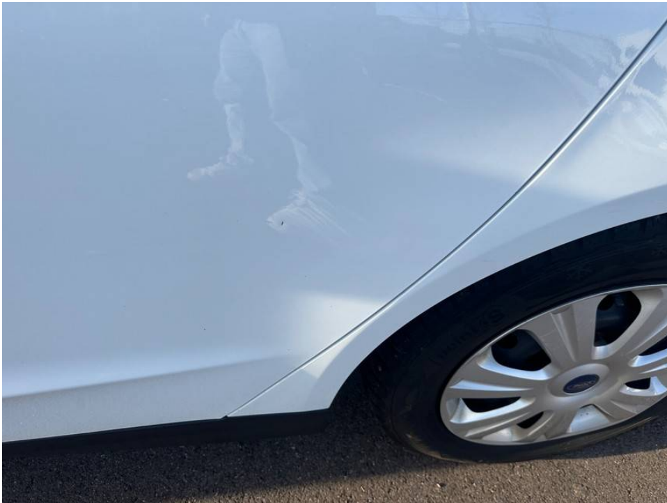
Lackschaden Tür h.l.