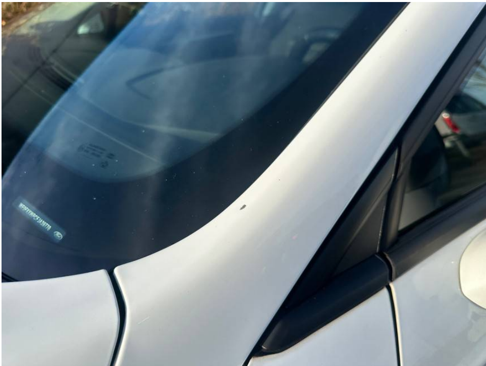
Steinschlagschäden A-Säule links