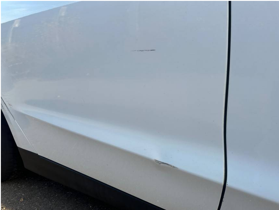
Lackkratzer Tür h.r.