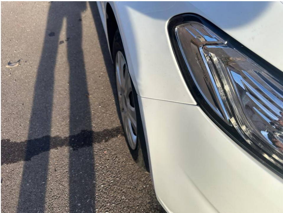
Kotflügel v.r. deformiert