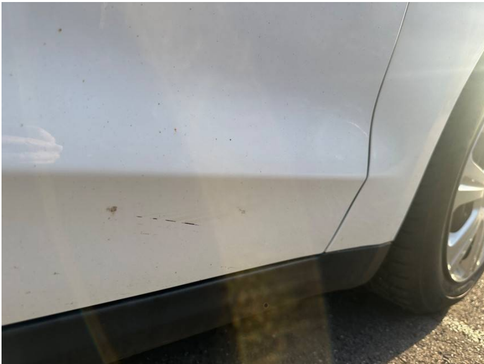
Lackkratzer Tür v.r.