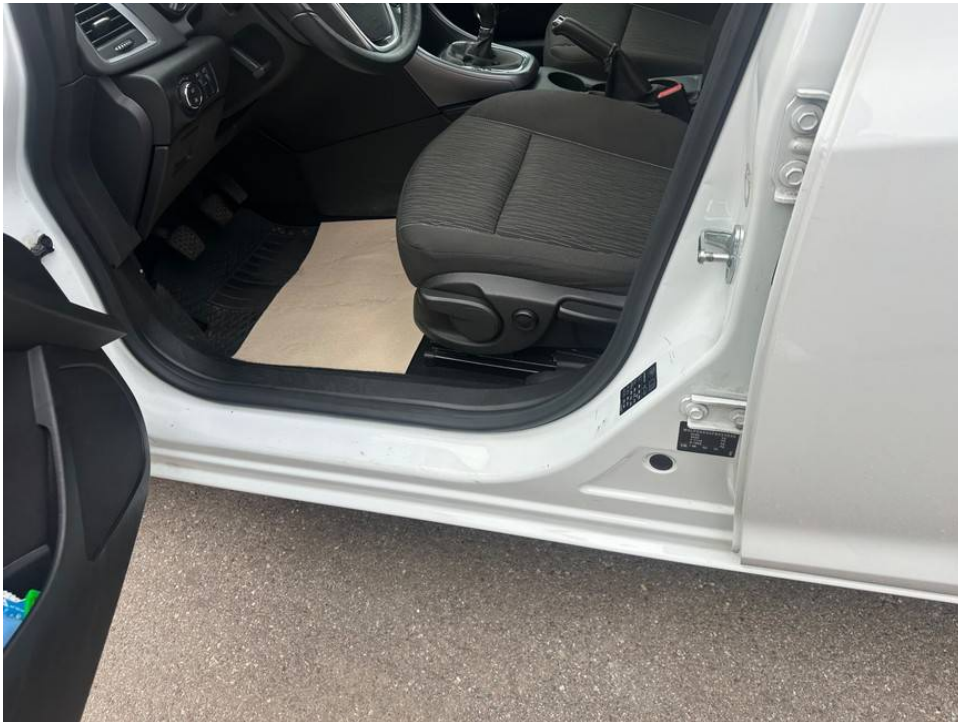
Lackschäden und Dellen B-Säule (Einstieg) vorne links