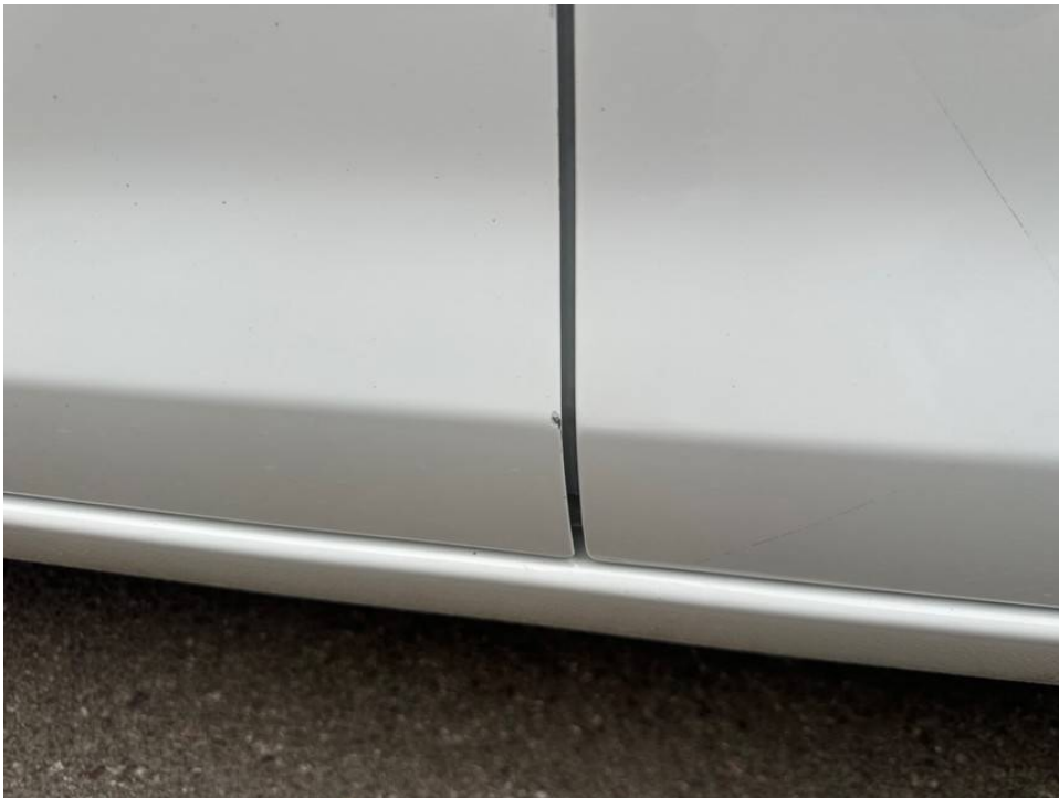
Lackschaden Türkante vorne links unterhalb