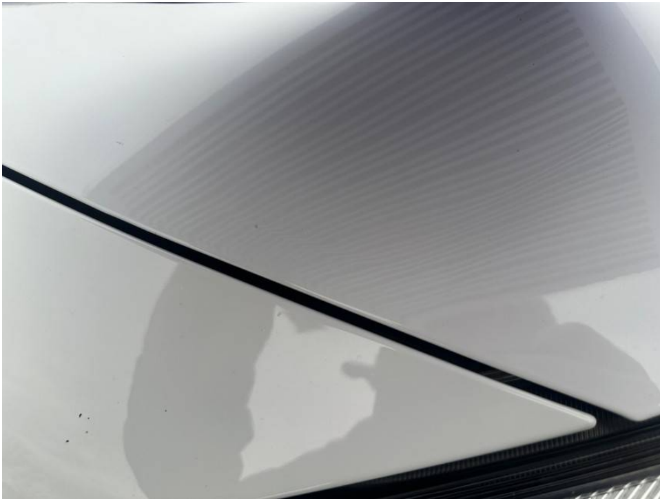
Motorhaube vorne links gestaucht