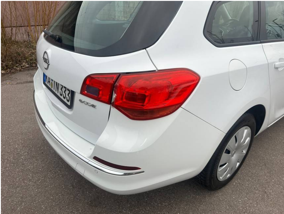
Rückleuchte hinten rechts beschädigt