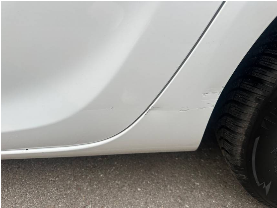
Lackkratzer und Delle Tür und Seitenwand hinten links unterhalb