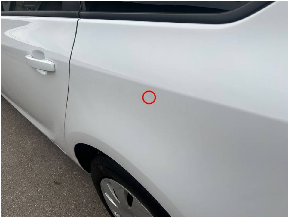
kleine Delle Seitenwand hinten links