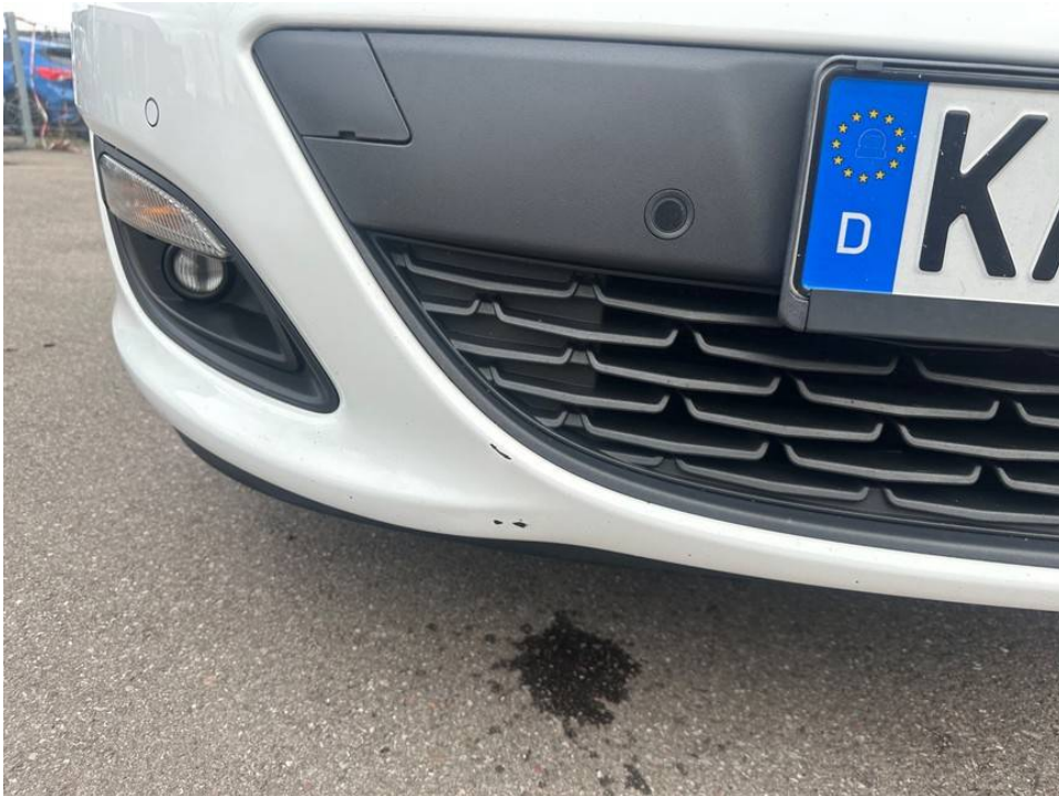
Lackschaden Stoßfänger vorne