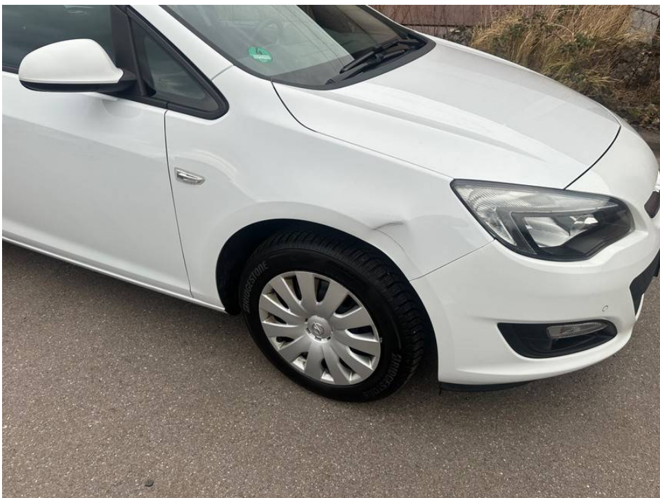
Delle Kotflügel vorne rechts