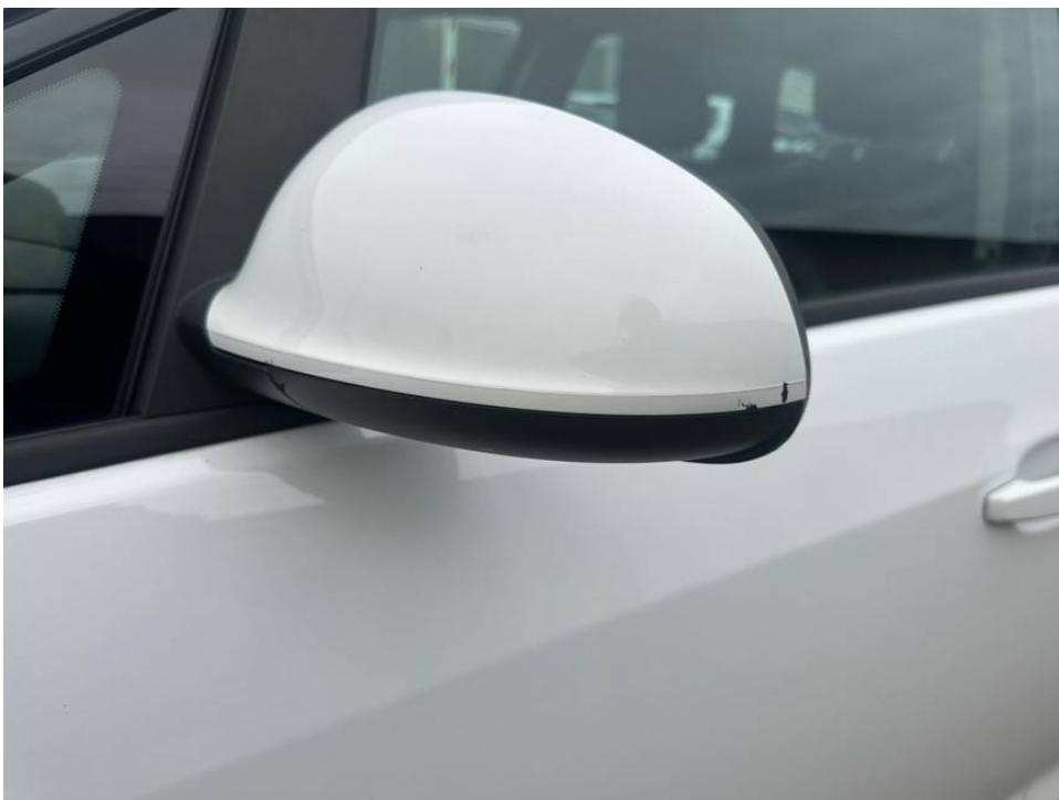
Kratzer Außenspiegel links