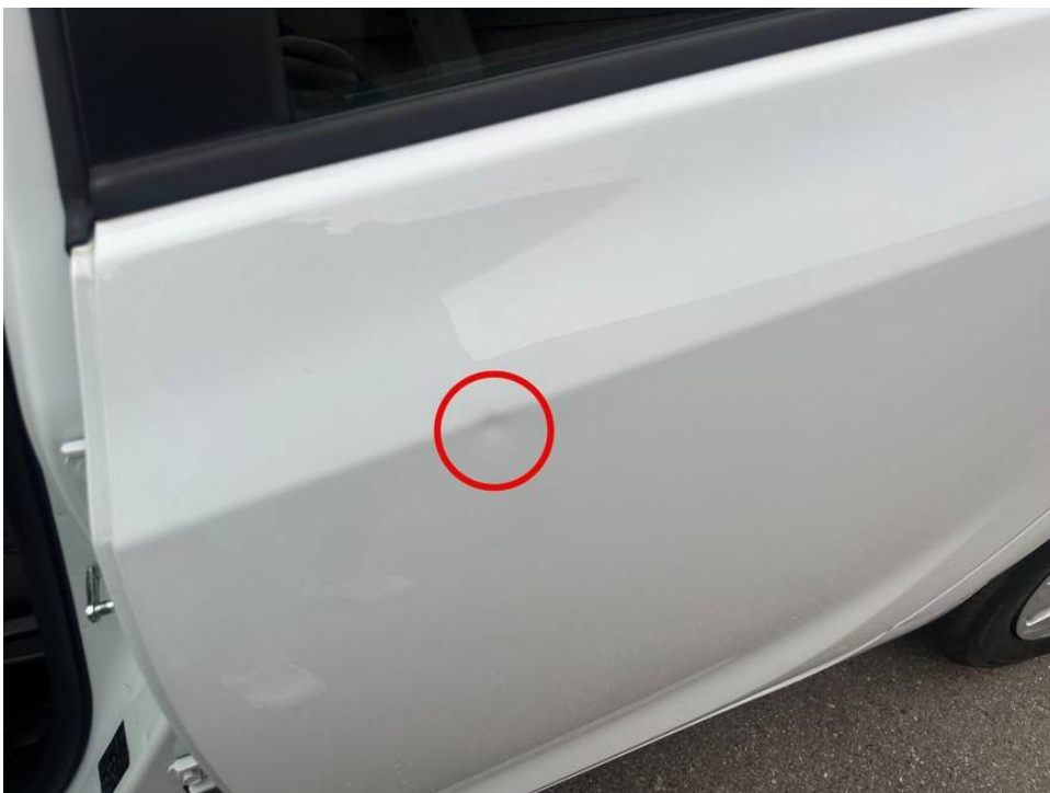
Delle Tür hinten links oberhalb