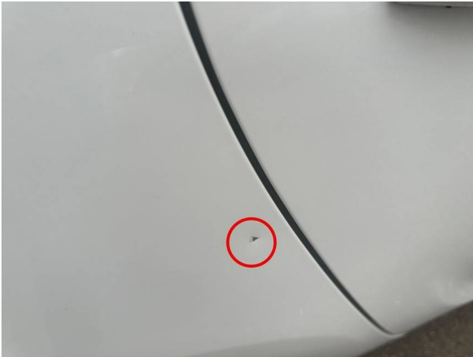
Lackschaden Seitenwand hinten rechts