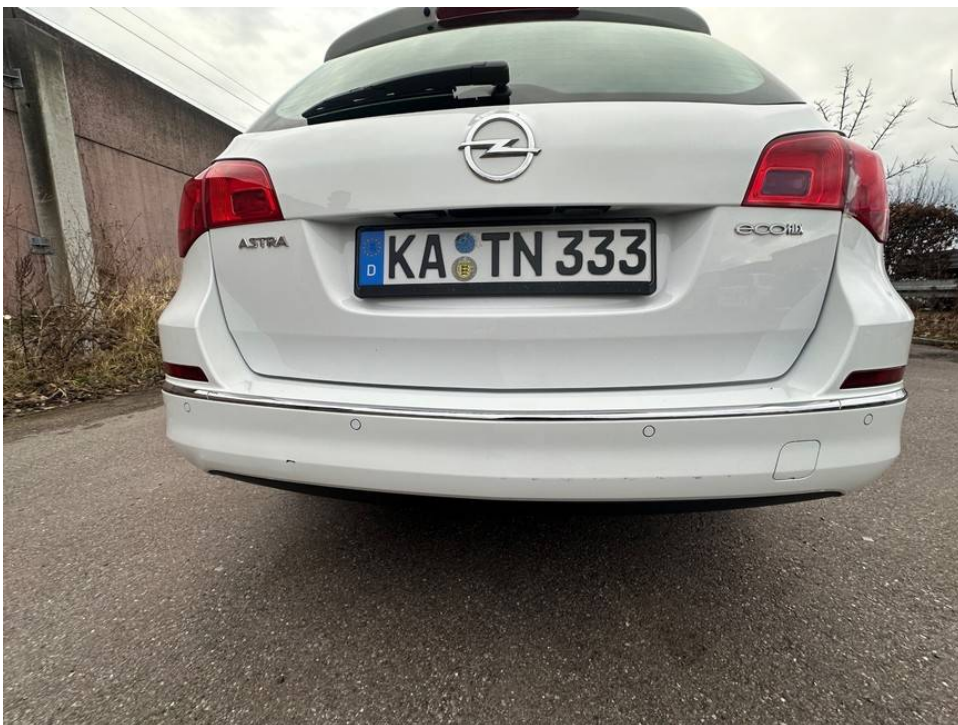
Lackschäden Stoßfänger hinten