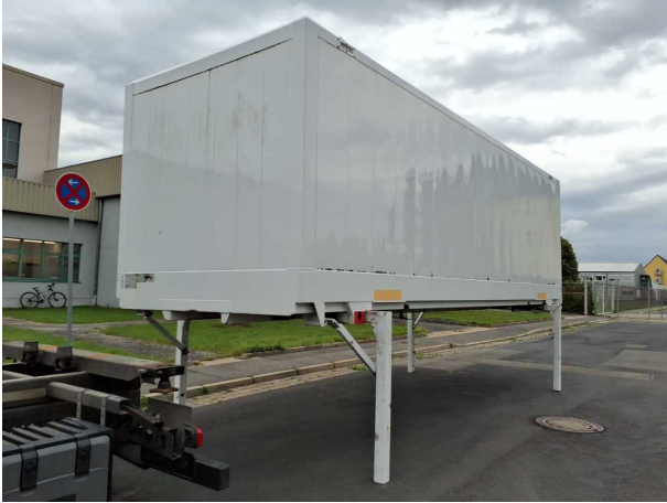
Abbildung 1: Schräg vorne