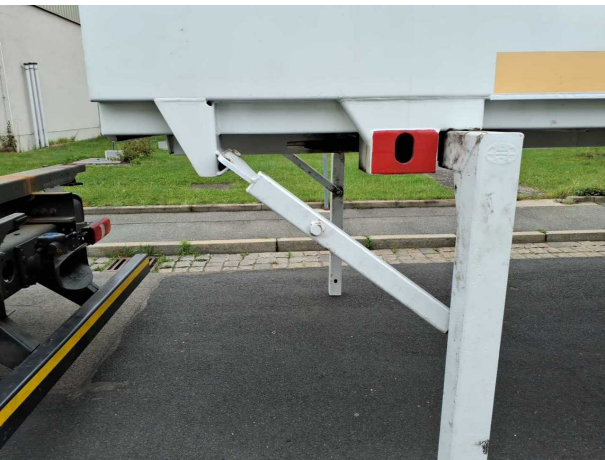
Abbildung 6: Dokumente