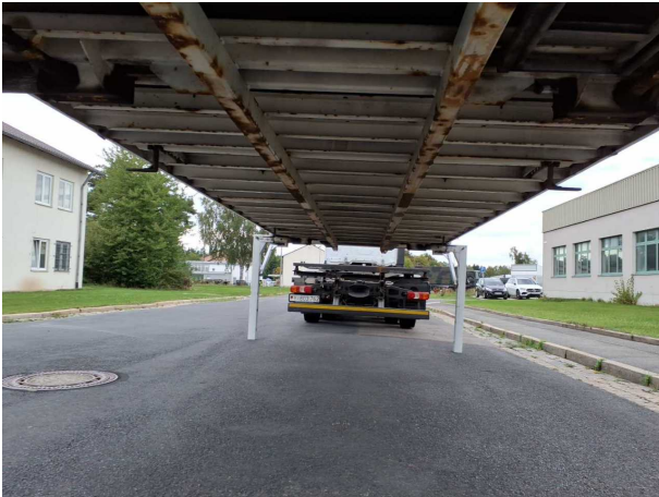
Abbildung 3: Innenraum