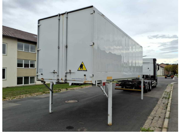
Abbildung 2: Schräg hinten