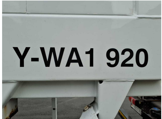
Abbildung 4: Kombiinstrument