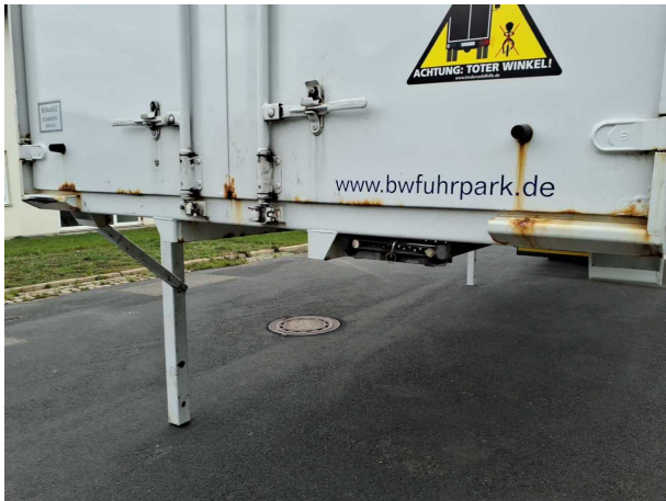
Gebrauchsspur 1: Karosserie: Karosserie - Korrosion - kein Abzug