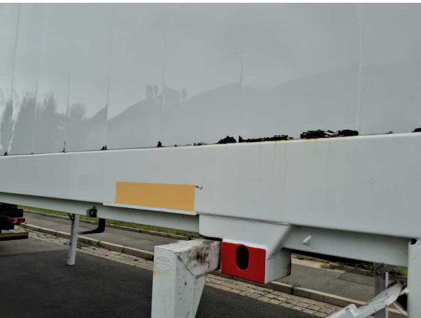
Gebrauchsspur 1: Karosserie: Karosserie - Korrosion - kein Abzug