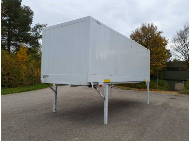
Abbildung 1: Schräg vorne