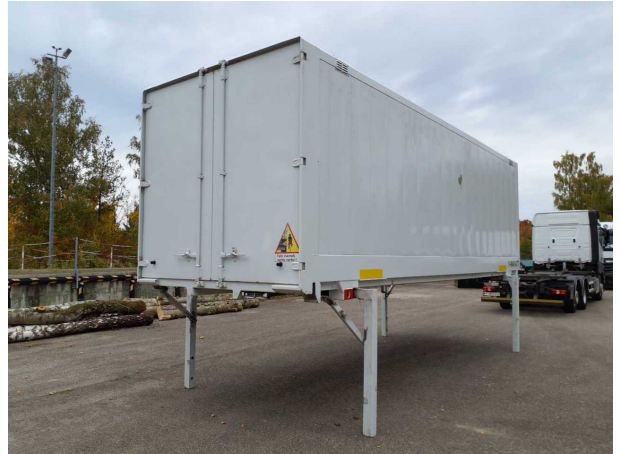
Abbildung 2: Schräg hinten