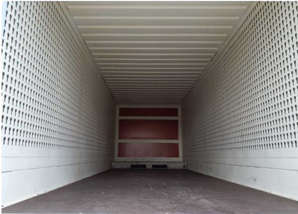
Abbildung 3: Innenraum