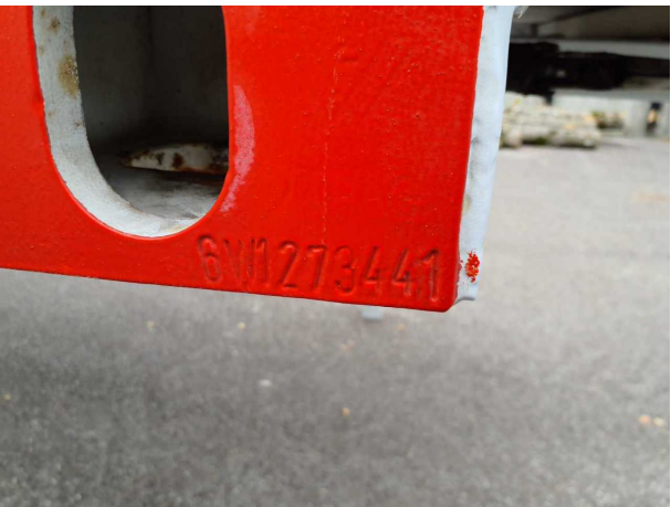
Abbildung 5: FIN