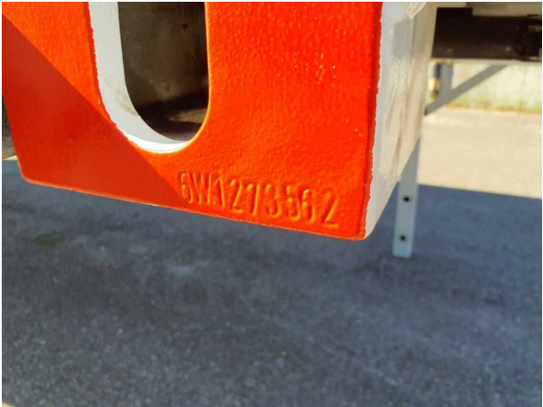
Abbildung 5: FIN