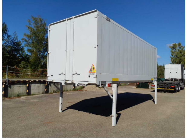
Abbildung 2: Schräg hinten