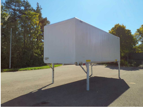
Abbildung 1: Schräg vorne