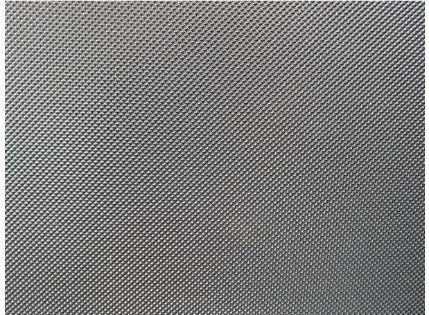
Abbildung 4: Kombiinstrument