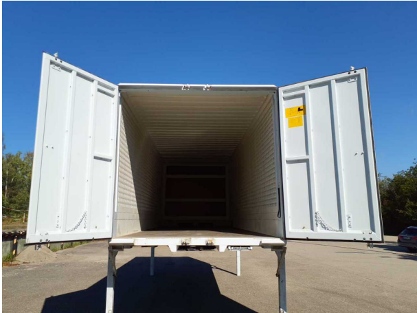
Abbildung 3: Innenraum