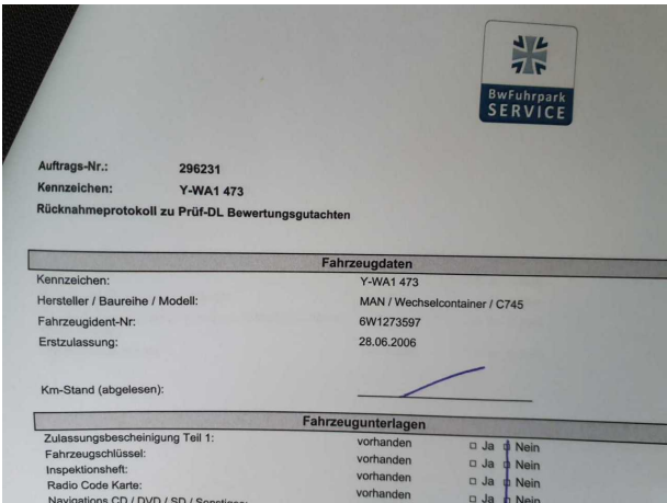
Abbildung 6: Dokumente