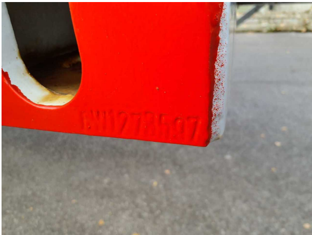
Abbildung 5: FIN