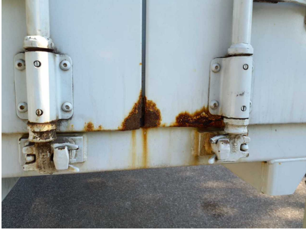
Gebrauchsspur 1: Karosserie: Karosserie - Korrosion - kein Abzug