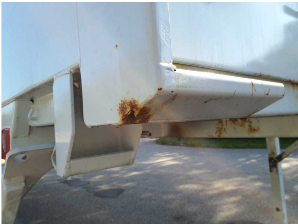
Gebrauchsspur 1: Karosserie: Karosserie - Korrosion - kein Abzug