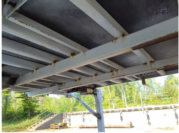
Gebrauchsspur 1: Karosserie: Karosserie - Korrosion - kein Abzug