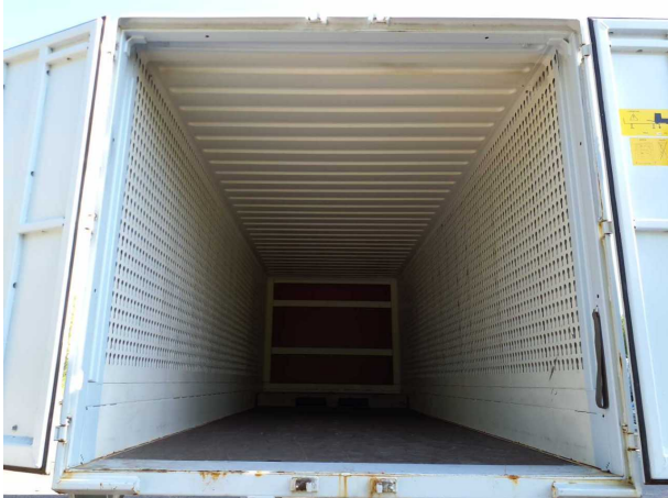
Abbildung 3: Innenraum