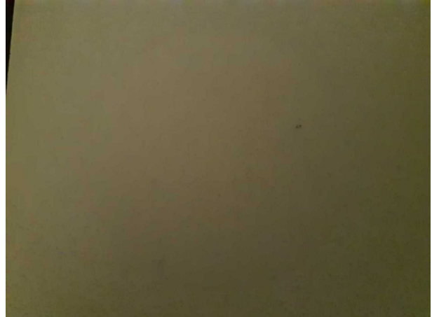
Abbildung 4: Kombiinstrument