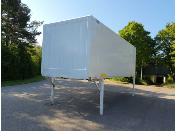
Abbildung 1: Schräg vorne