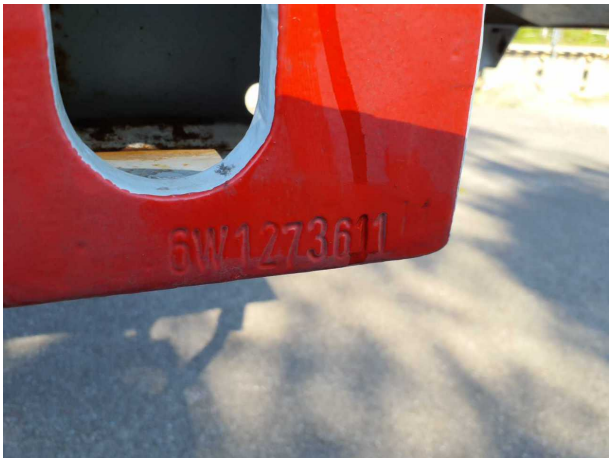
Abbildung 5: FIN