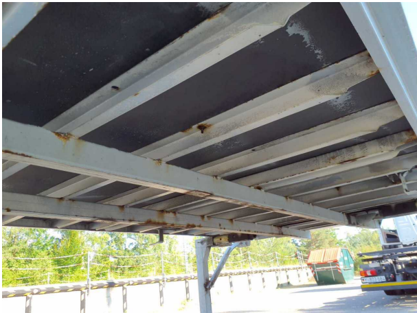
Gebrauchsspur 1: Karosserie: Karosserie - Korrosion - kein Abzug