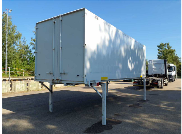
Abbildung 2: Schräg hinten