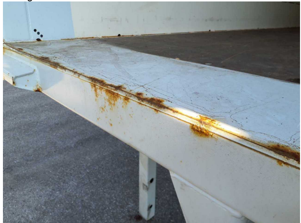
Gebrauchsspur 1: Karosserie: Karosserie - Korrosion - kein Abzug