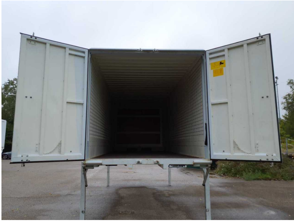
Abbildung 3: Innenraum