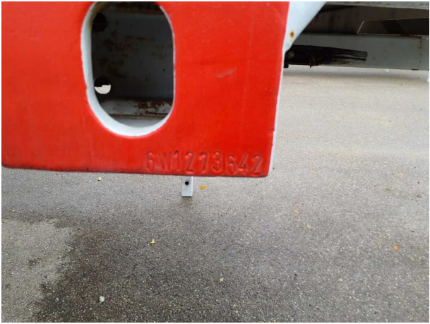
Abbildung 6: FIN