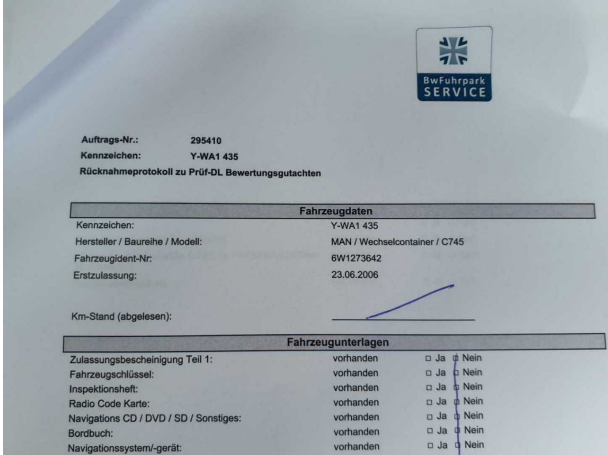
Abbildung 7: Dokumente