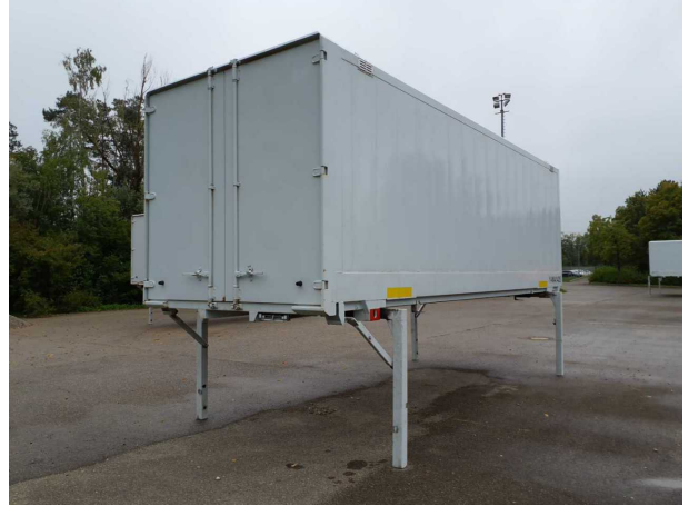
Abbildung 2: Schräg hinten