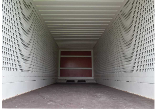
Abbildung 4: Innenraum