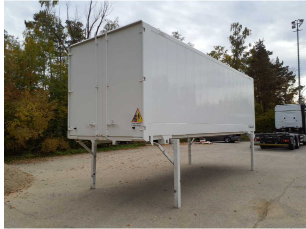
Abbildung 2: Schräg hinten