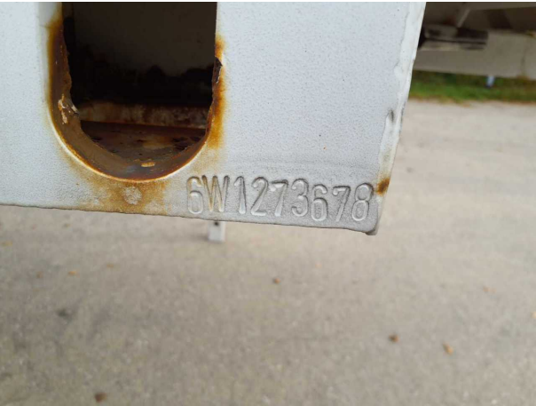
Abbildung 5: FIN