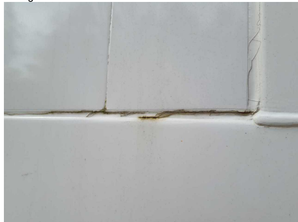
Gebrauchsspur 1: Karosserie: Karosserie - beschädigt - kein Abzug