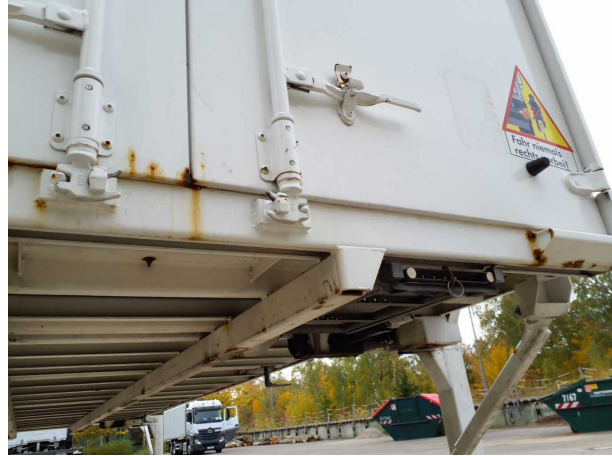
Gebrauchsspur 1: Karosserie: Karosserie - beschädigt - kein Abzug