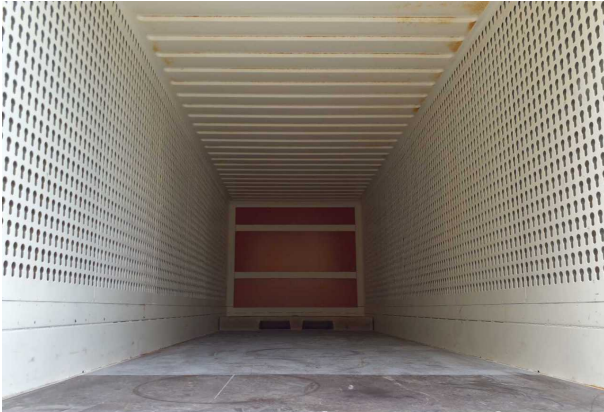
Abbildung 3: Innenraum