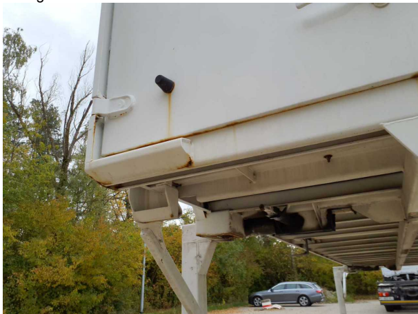
Gebrauchsspur 1: Karosserie: Karosserie - beschädigt - kein Abzug