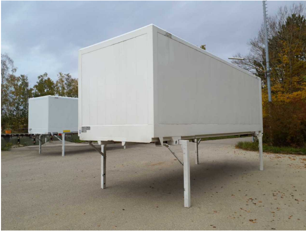
Abbildung 1: Schräg vorne