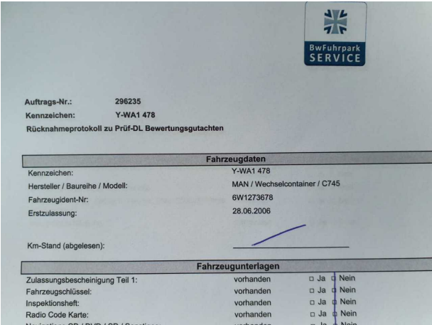
Abbildung 6: Dokumente