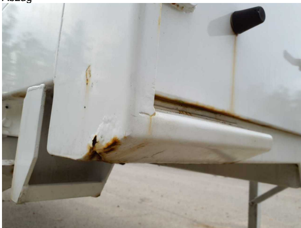
Gebrauchsspur 1: Karosserie: Karosserie - beschädigt - kein Abzug