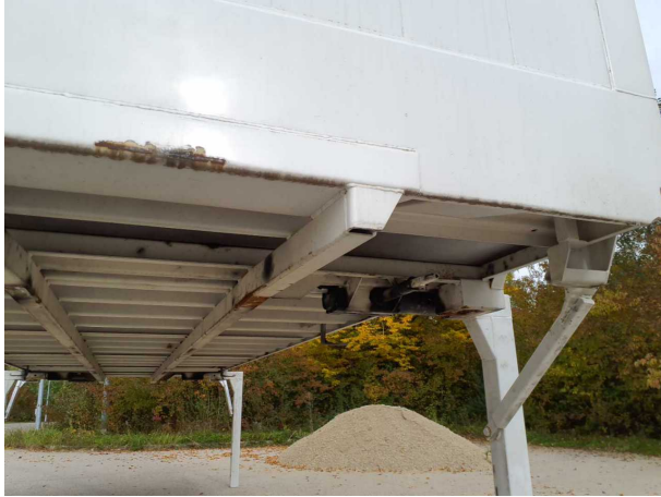
Gebrauchsspur 1: Karosserie: Karosserie - beschädigt - kein Abzug