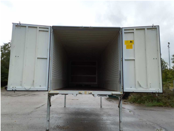
Abbildung 3: Innenraum