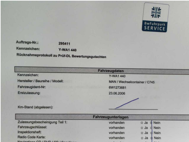
Abbildung 7: Dokumente