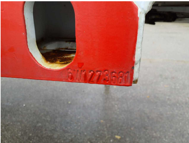
Abbildung 6: FIN