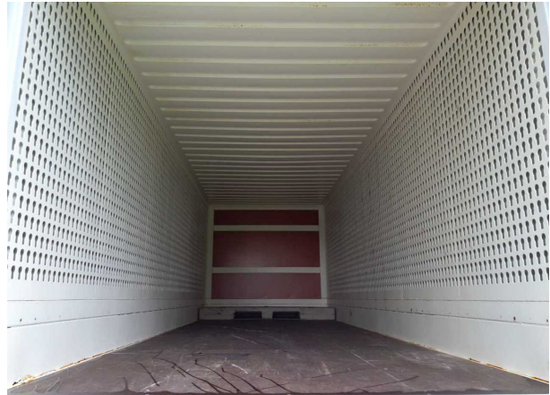
Abbildung 4: Innenraum