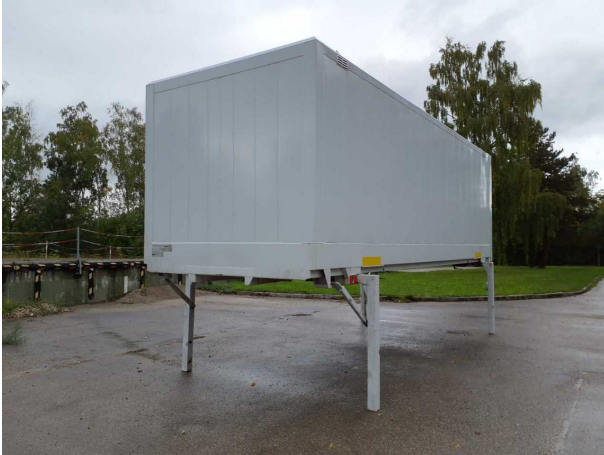
Abbildung 1: Schräg vorne