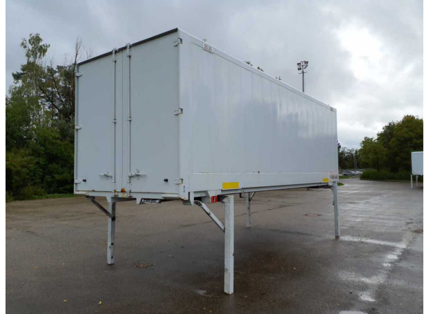
Abbildung 2: Schräg hinten