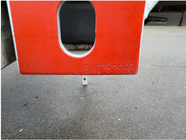
Abbildung 6: FIN