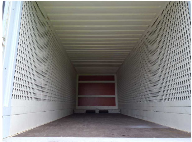
Abbildung 4: Innenraum