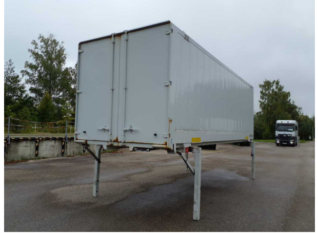
Abbildung 2: Schräg hinten