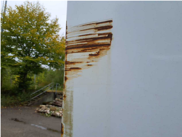
Beschädigung 1: Seitenwand rechts: Seitenwand - beschädigt - instandsetzen und lackieren