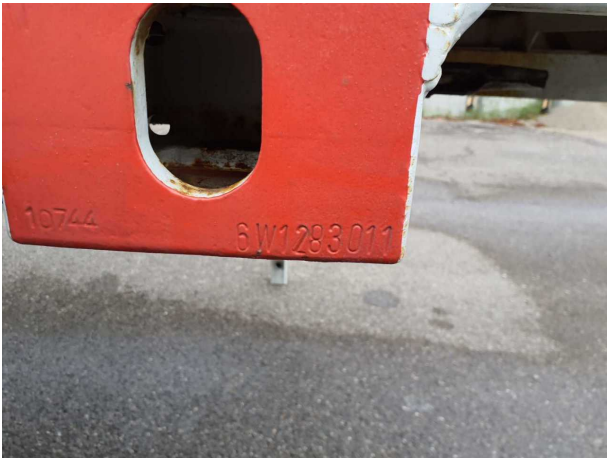
Abbildung 6: FIN