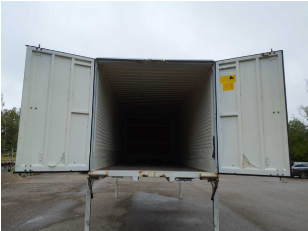
Abbildung 3: Innenraum