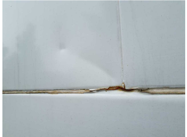
Beschädigung 1: Seitenwand rechts: Seitenwand - beschädigt - instandsetzen und lackieren