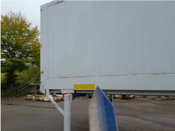
Beschädigung 1: Seitenwand rechts: Seitenwand - beschädigt - instandsetzen und lackieren