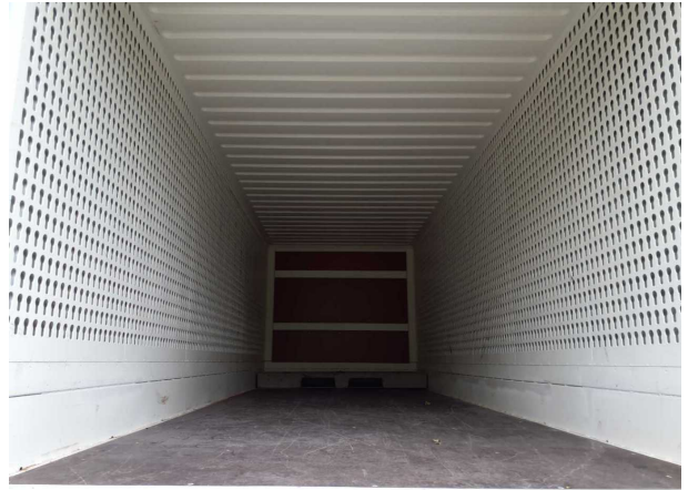
Abbildung 4: Innenraum