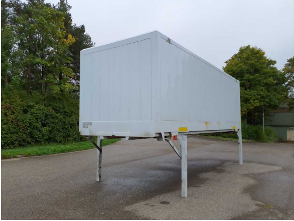
Abbildung 1: Schräg vorne