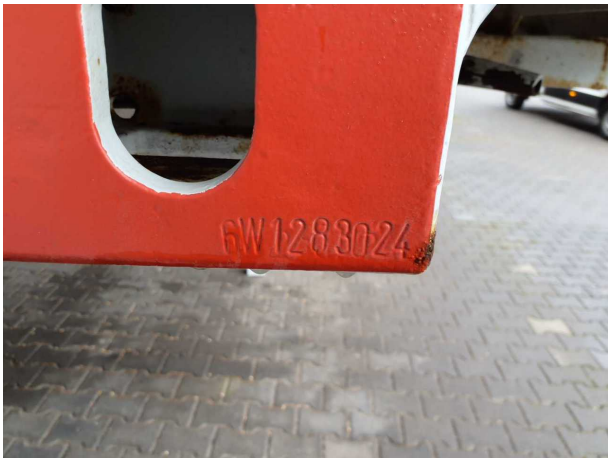
Abbildung 5: FIN