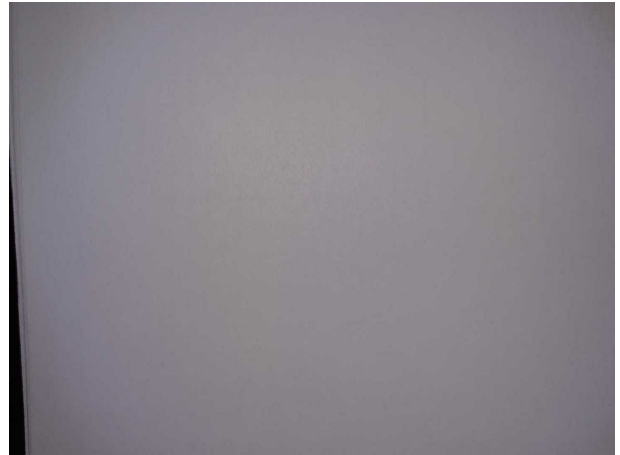
Abbildung 4: Kombiinstrument