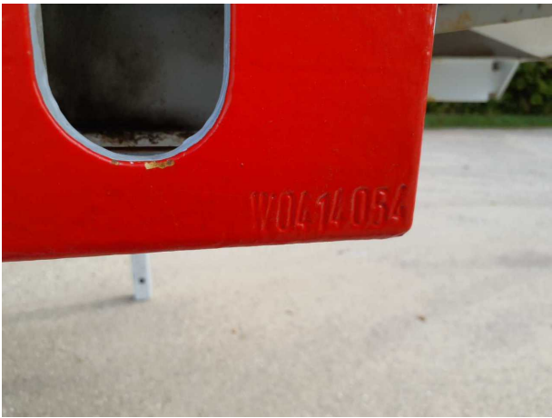
Abbildung 6: FIN