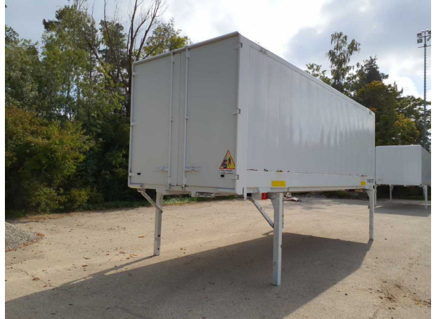
Abbildung 2: Schräg hinten