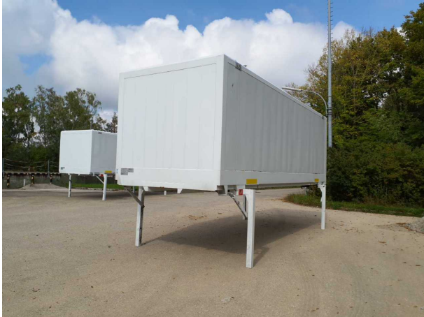
Abbildung 1: Schräg vorne