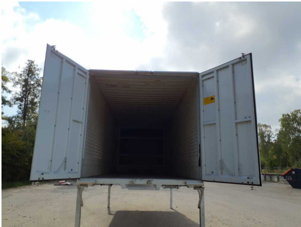
Abbildung 3: Innenraum