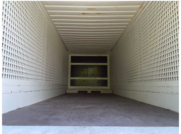
Abbildung 4: Innenraum