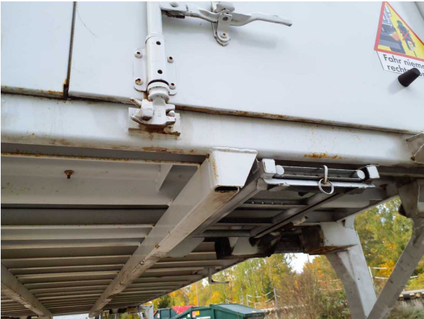
Gebrauchsspur 1: Karosserie: Karosserie - beschädigt - kein Abzug