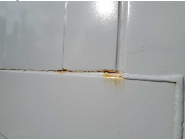
Gebrauchsspur 1: Karosserie: Karosserie - beschädigt - kein Abzug