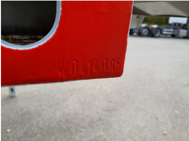
Abbildung 5: FIN