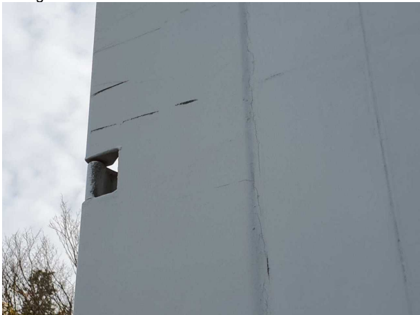
Gebrauchsspur 1: Karosserie: Karosserie - beschädigt - kein Abzug