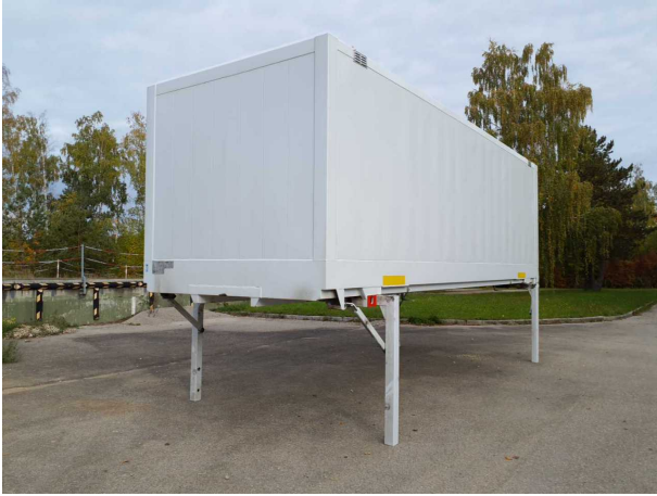
Abbildung 1: Schräg vorne