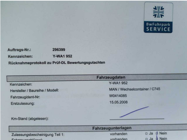
Abbildung 6: Dokumente