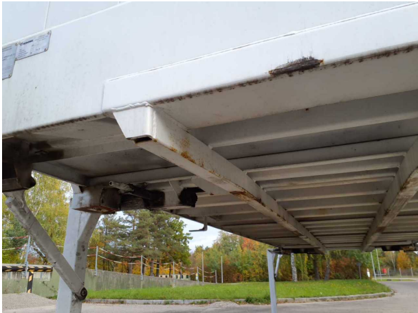
Gebrauchsspur 1: Karosserie: Karosserie - beschädigt - kein Abzug