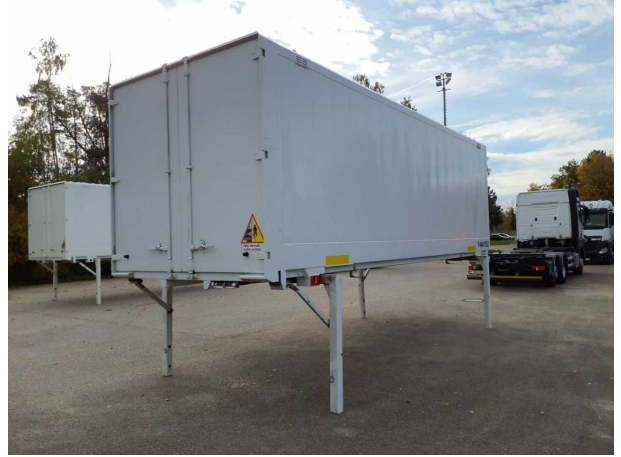
Abbildung 2: Schräg hinten