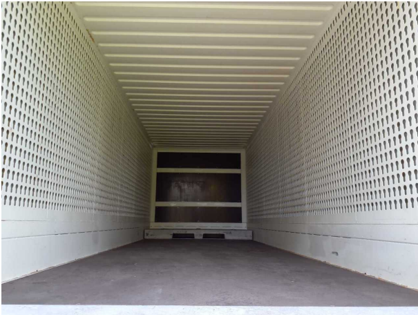
Abbildung 3: Innenraum