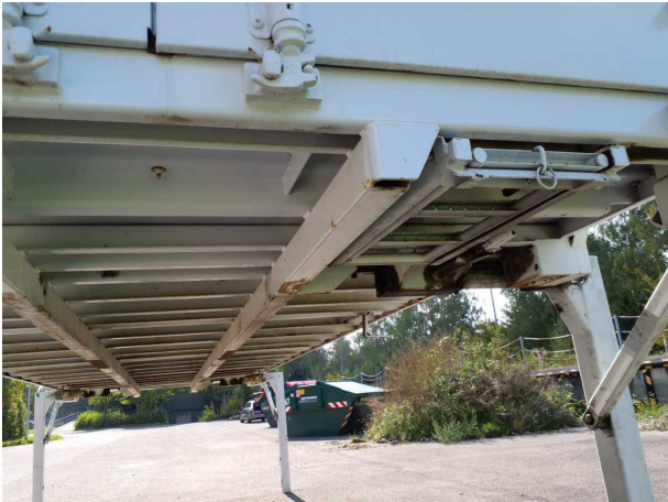
Gebrauchsspur 1: Karosserie: Karosserie - beschädigt - kein Abzug