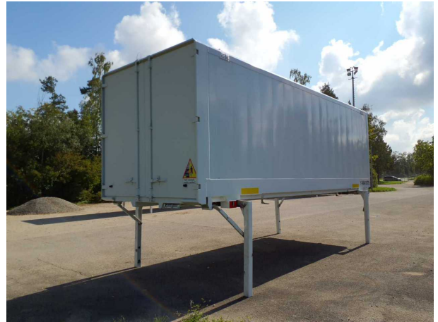
Abbildung 2: Schräg hinten