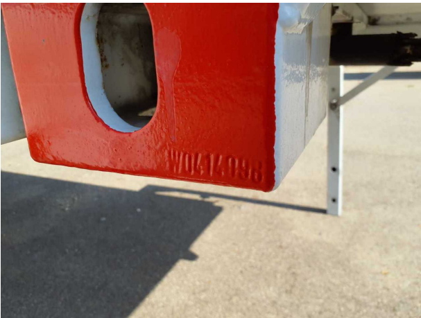
Abbildung 5: FIN