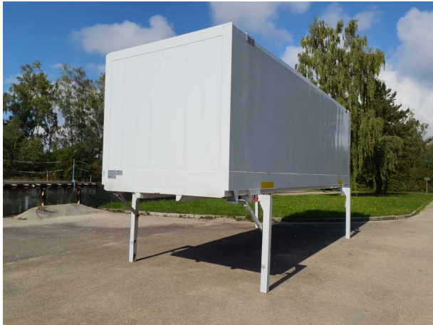
Abbildung 1: Schräg vorne