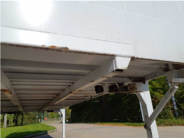
Gebrauchsspur 1: Karosserie: Karosserie - beschädigt - kein Abzug