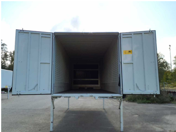
Abbildung 3: Innenraum