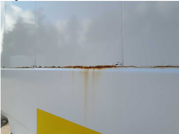
Gebrauchsspur 1: Karosserie: Karosserie - beschädigt - kein Abzug