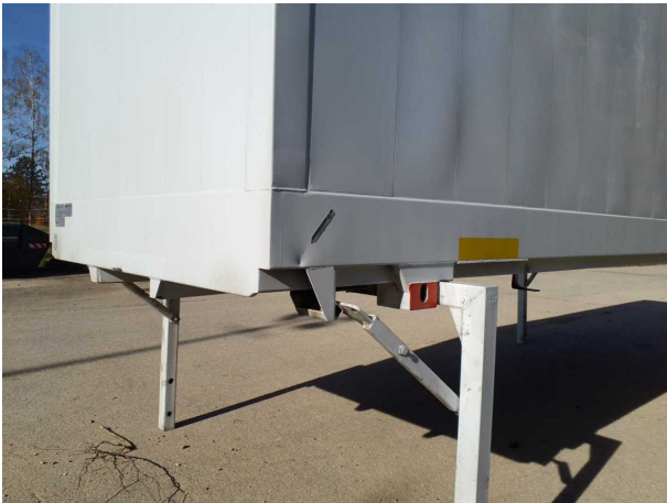
Beschädigung 2: Seitenwand links: Seitenwand - verformt - instandsetzen und lackieren