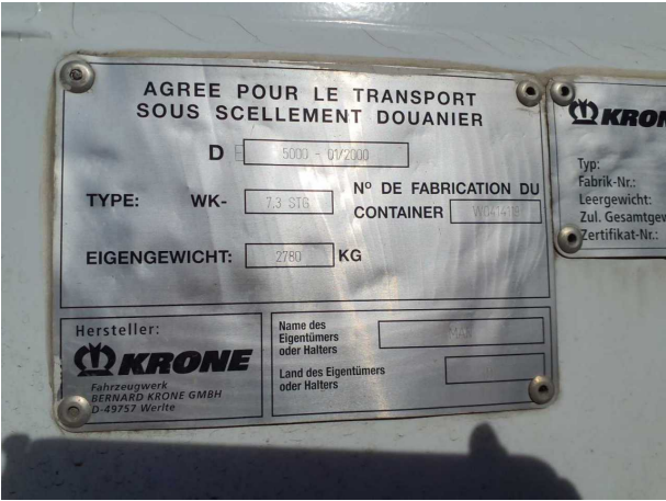
Abbildung 5: FIN