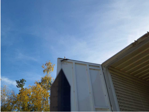
Beschädigung 1: Tür hinten links: Türdichtung - beschädigt - erneuern