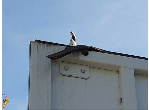
Beschädigung 1: Tür hinten links: Türdichtung - beschädigt - erneuern