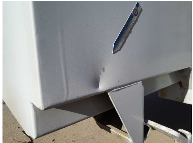
Beschädigung 2: Seitenwand links: Seitenwand - verformt - instandsetzen und lackieren