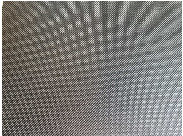
Abbildung 4: Kombiinstrument