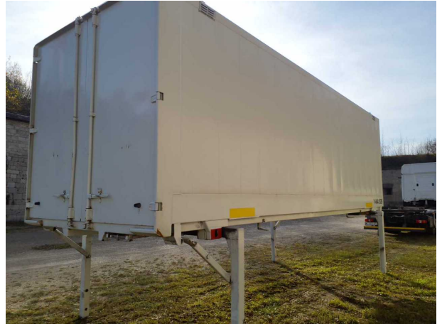
Abbildung 2: Schräg hinten