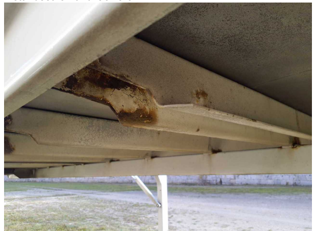
Gebrauchsspur 1: Karosserie: Karosserie - Korrosion - kein Abzug