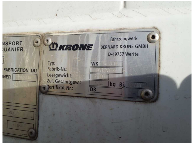
Abbildung 4: Kombiinstrument