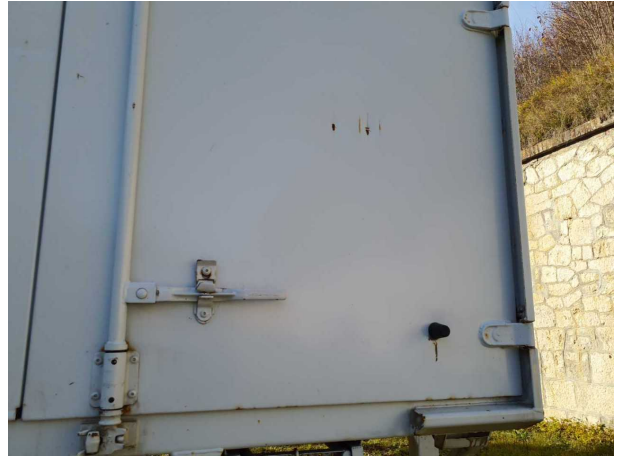
Beschädigung 2: Heckklappe/-tür: Hecktür rechts - verformt - instandsetzen und lackieren