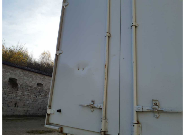
Beschädigung 3: Heckklappe/-tür: Hecktür links - verformt - instandsetzen und lackieren