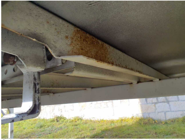
Gebrauchsspur 1: Karosserie: Karosserie - Korrosion - kein Abzug