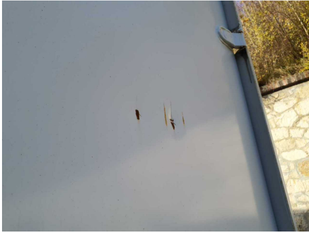
Beschädigung 2: Heckklappe/-tür: Hecktür rechts - verformt - instandsetzen und lackieren