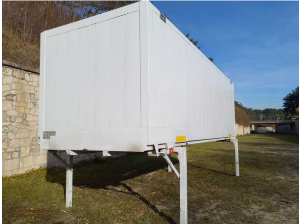
Abbildung 1: Schräg vorne