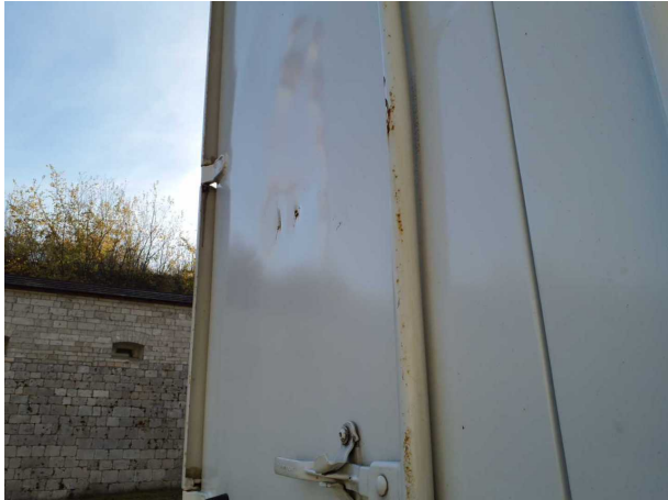
Beschädigung 3: Heckklappe/-tür: Hecktür links - verformt - instandsetzen und lackieren