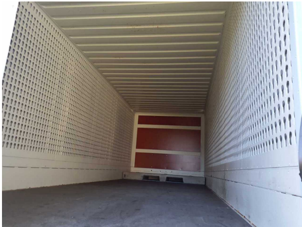
Abbildung 3: Innenraum