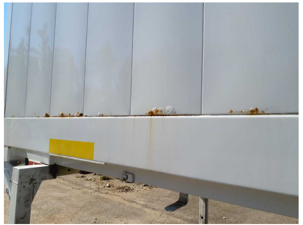
Gebrauchsspur 1: Karosserie: Karosserie - beschädigt - kein Abzug