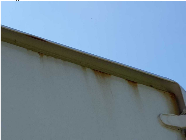
Gebrauchsspur 1: Karosserie: Karosserie - beschädigt - kein Abzug