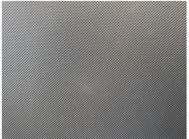
Abbildung 4: Kombiinstrument