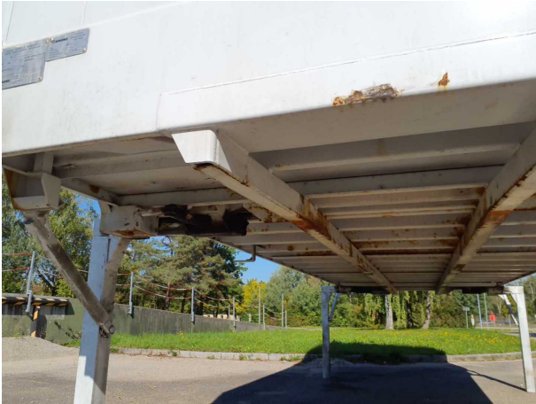
Gebrauchsspur 1: Karosserie: Karosserie - beschädigt - kein Abzug