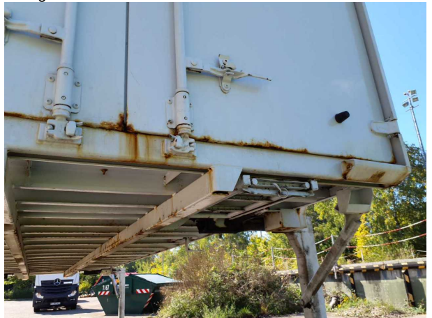
Gebrauchsspur 1: Karosserie: Karosserie - beschädigt - kein Abzug