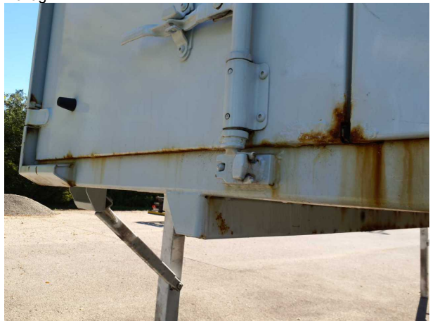
Gebrauchsspur 1: Karosserie: Karosserie - beschädigt - kein Abzug