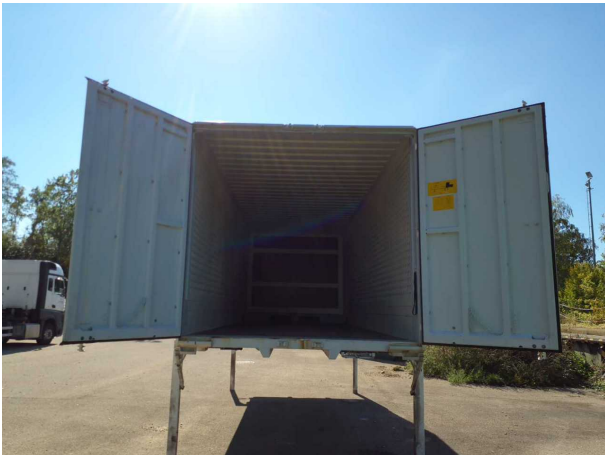
Abbildung 3: Innenraum