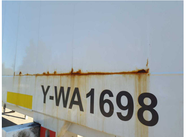
Gebrauchsspur 1: Karosserie: Karosserie - beschädigt - kein Abzug