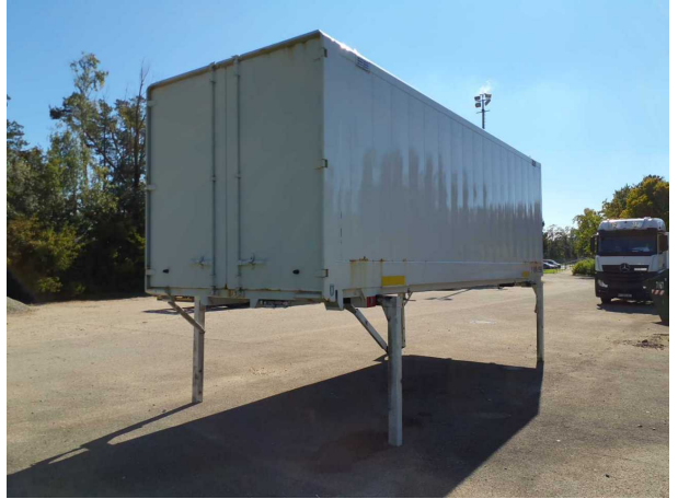
Abbildung 2: Schräg hinten