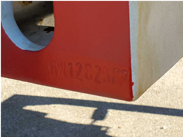
Abbildung 5: FIN