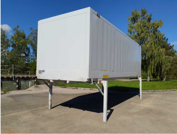
Abbildung 1: Schräg vorne