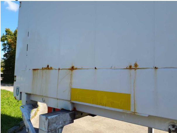
Gebrauchsspur 1: Karosserie: Karosserie - beschädigt - kein Abzug