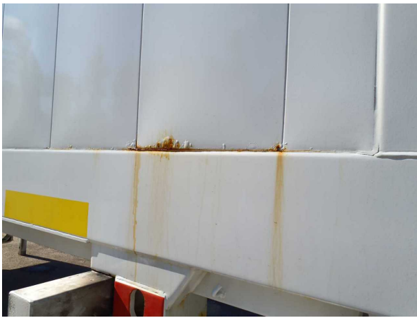
Gebrauchsspur 1: Karosserie: Karosserie - beschädigt - kein Abzug