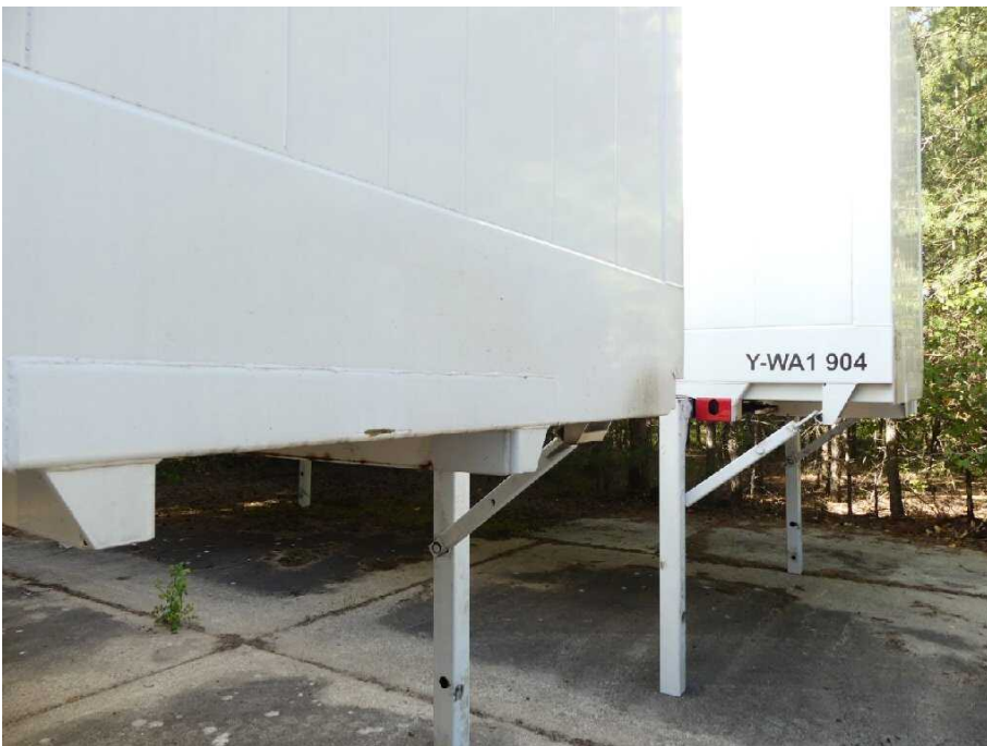
Bild 14 Fahrzeug Rahmen vorn korrodiert