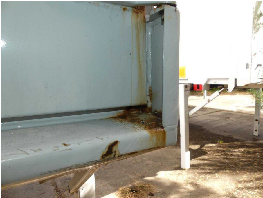
Bild 18 Fahrzeug Rahmen hinten rechts korrodiert