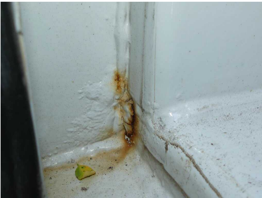
Bild 13 Fahrzeug Rahmen hi.li. korrodiert