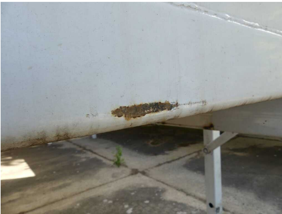
Bild 15 Fahrzeug Rahmen vorn korrodiert