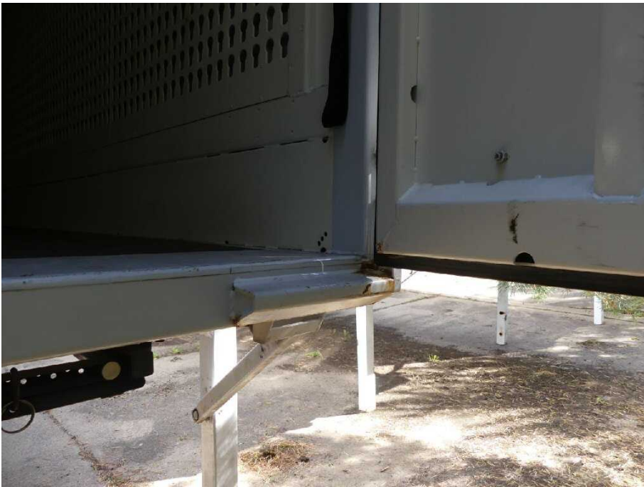
Bild 19 Fahrzeug Rahmen hinten rechts korrodiert