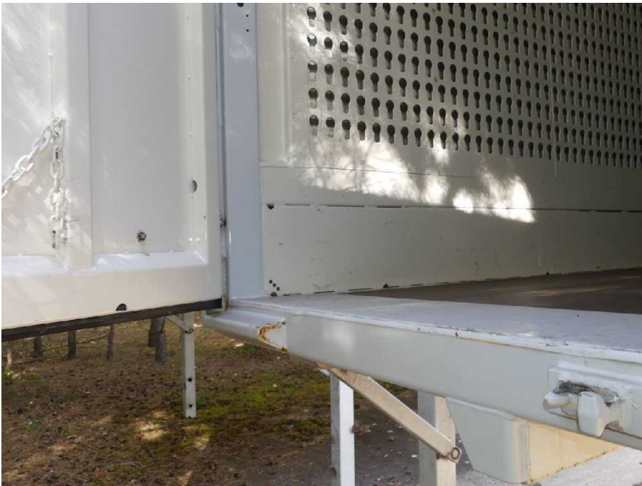
Bild 11 Fahrzeug Rahmen hi.li. korrodiert