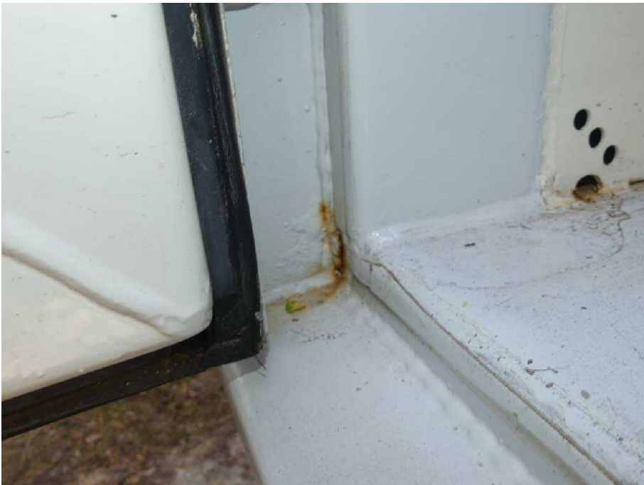
Bild 12 Fahrzeug Rahmen hi.li. korrodiert