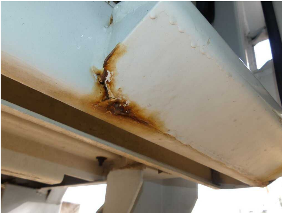
Bild 21 Fahrzeug Rahmen hinten rechts korrodiert