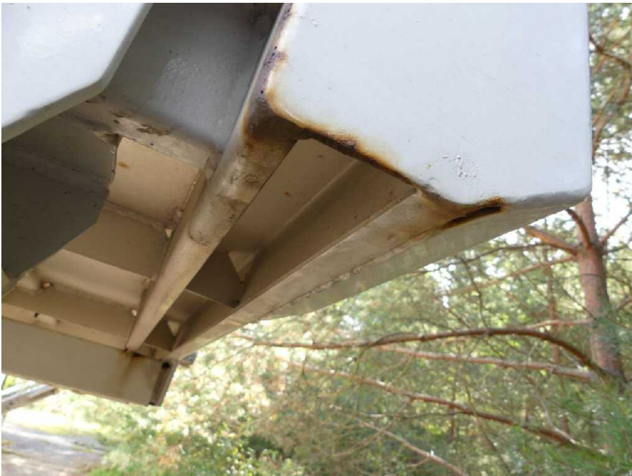
Bild 10 Fahrzeug Rahmen hi.li. korrodiert