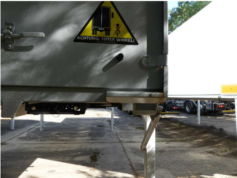
Bild 16 Fahrzeug Rahmen hinten rechts korrodiert