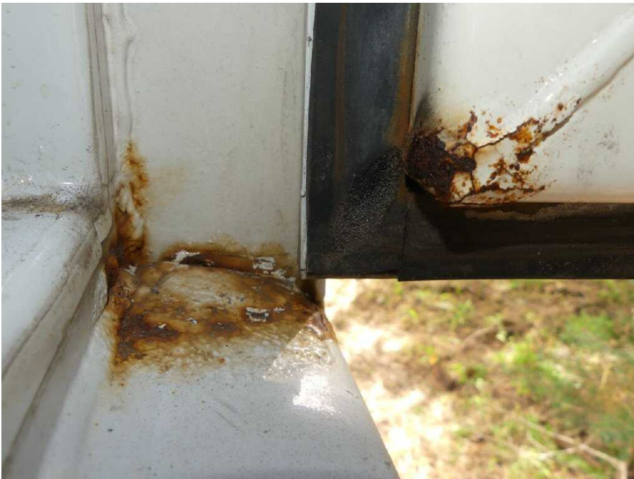
Bild 23 Fahrzeugheck Heckflügeltür rechts innen korrodiert