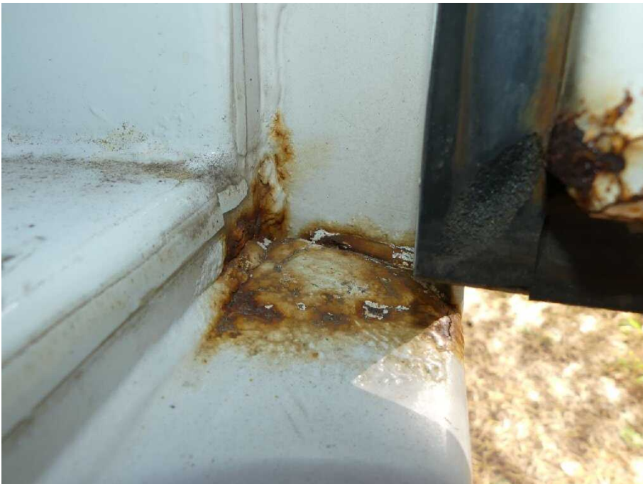
Bild 20 Fahrzeug Rahmen hinten rechts korrodiert