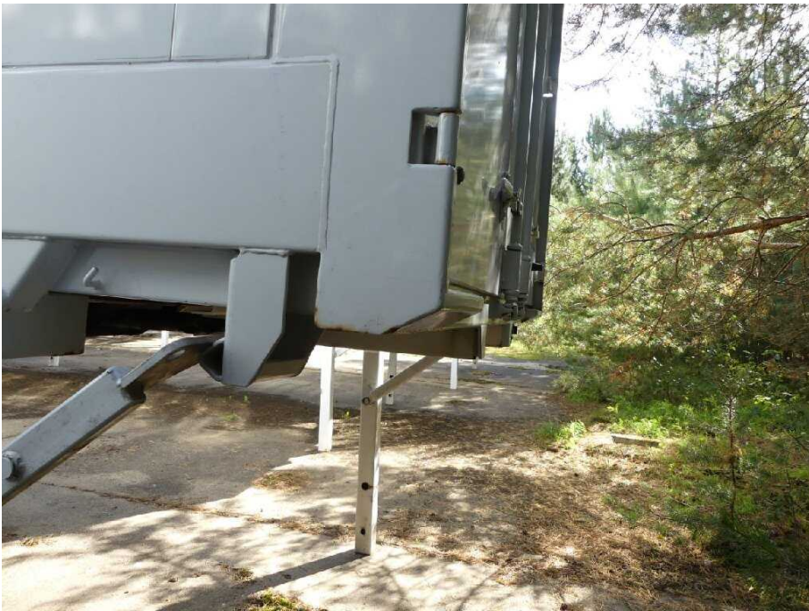
Bild 9 Fahrzeug Rahmen hi.li. korrodiert