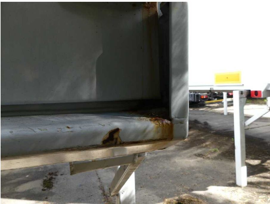
Bild 17 Fahrzeug Rahmen hinten rechts korrodiert