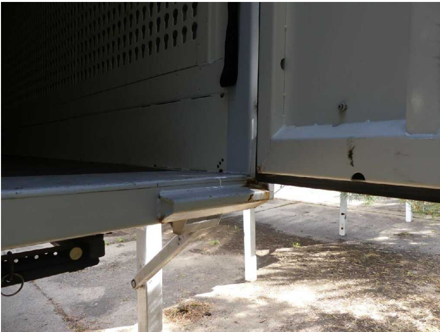
Bild 22 Fahrzeugheck Heckflügeltür rechts innen korrodiert