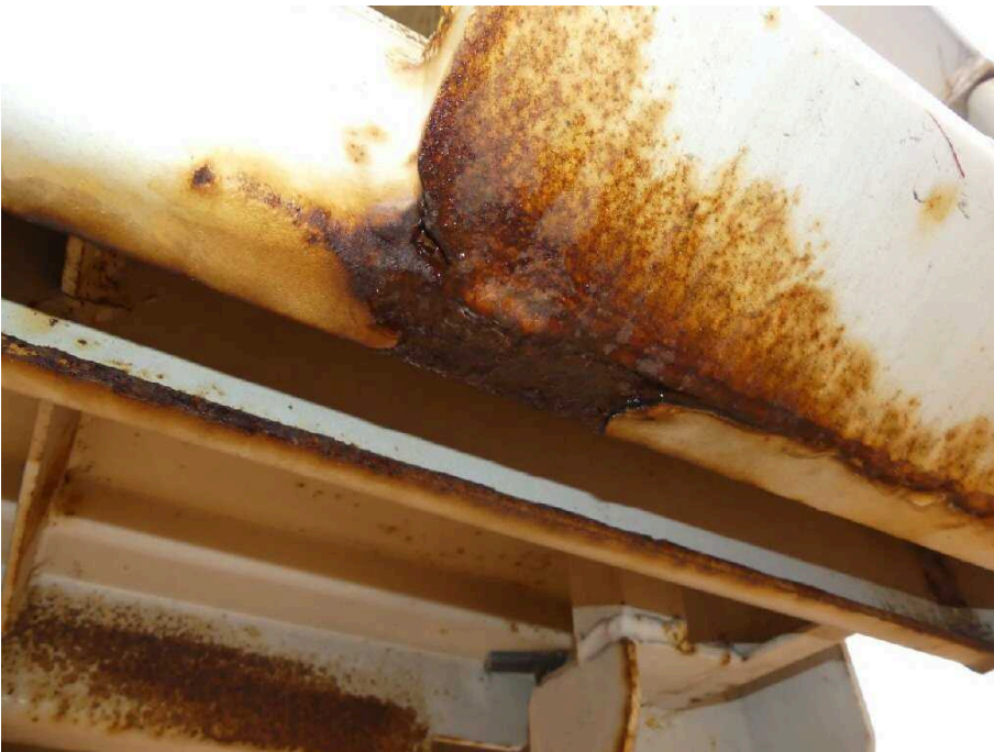
Bild 38 Fahrzeugheck Rahmen hinten rechts korrodiert