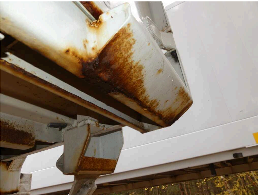
Bild 34 Fahrzeugheck Rahmen hinten rechts korrodiert