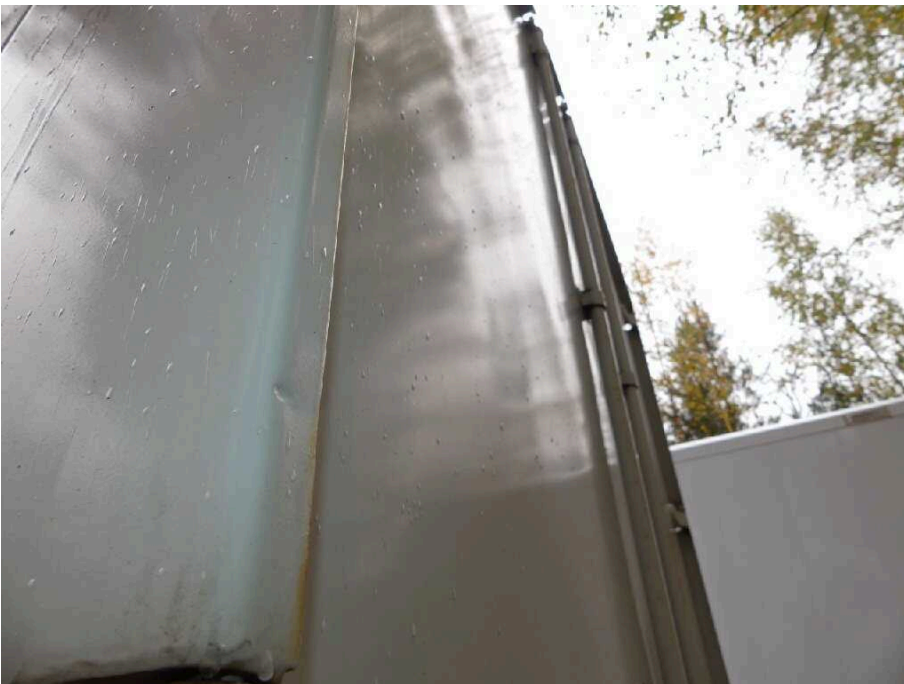
Bild 28 Fahrzeugheck Ecksäule hinten links eingedrückt und korrodiert