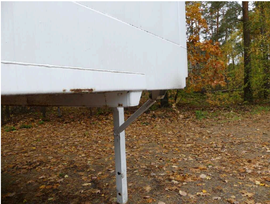
Bild 9 Aufbau Bodenrahmen vorne korrodiert