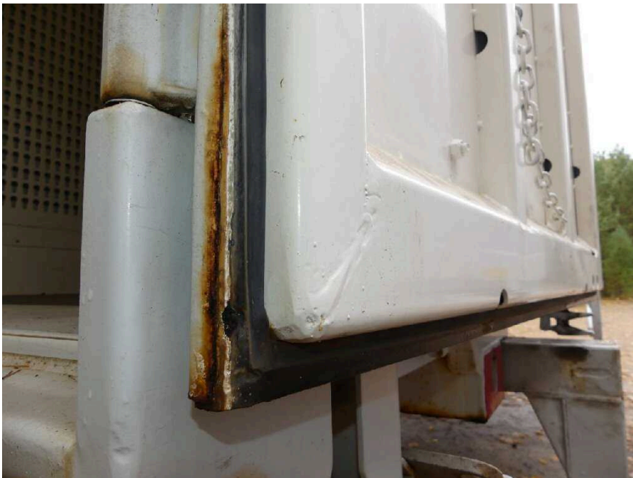
Bild 24 Fahrzeugheck Heckflügeltür rechts korrodiert