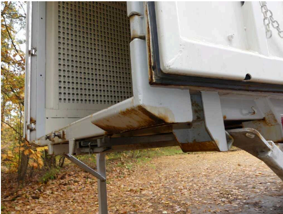
Bild 23 Fahrzeugheck Heckflügeltür rechts korrodiert