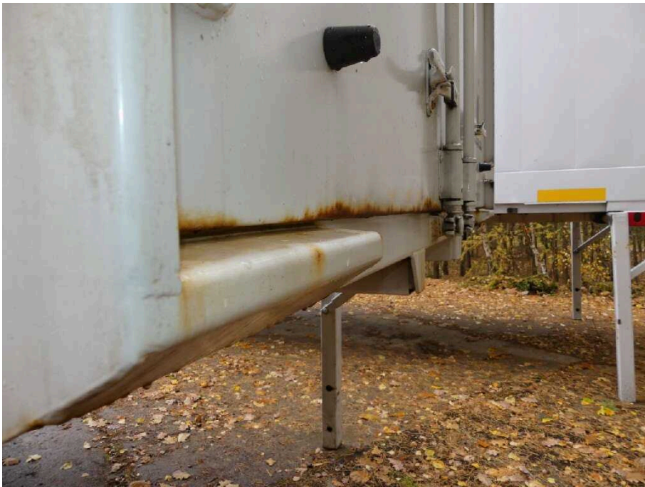
Bild 15 Fahrzeugheck Heckflügeltür links stark korrodiert