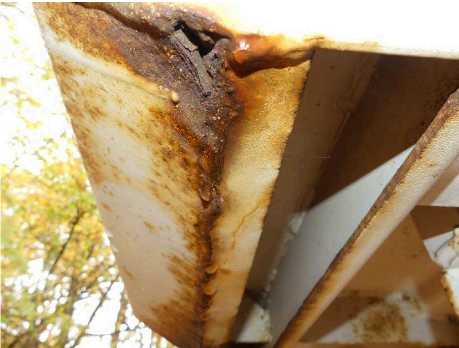
Bild 39 Fahrzeugheck Rahmen hinten rechts korrodiert