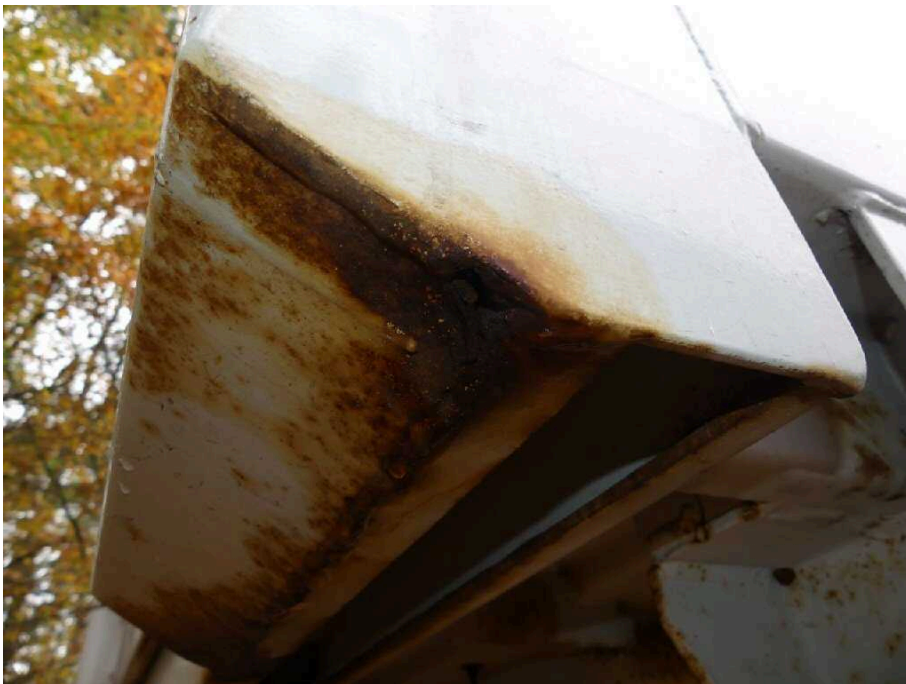
Bild 36 Fahrzeugheck Rahmen hinten rechts korrodiert