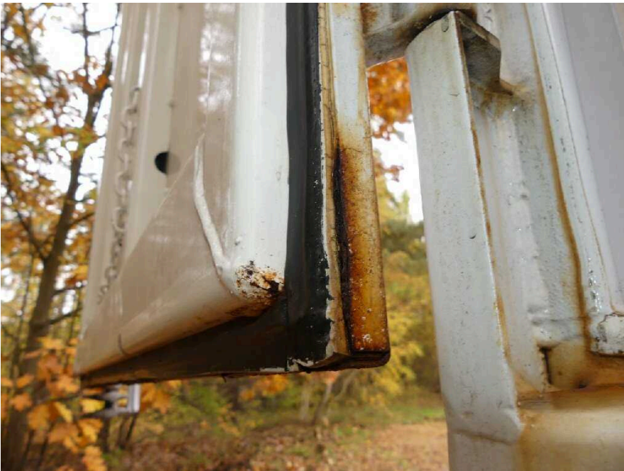
Bild 21 Fahrzeugheck Heckflügeltür links stark korrodiert