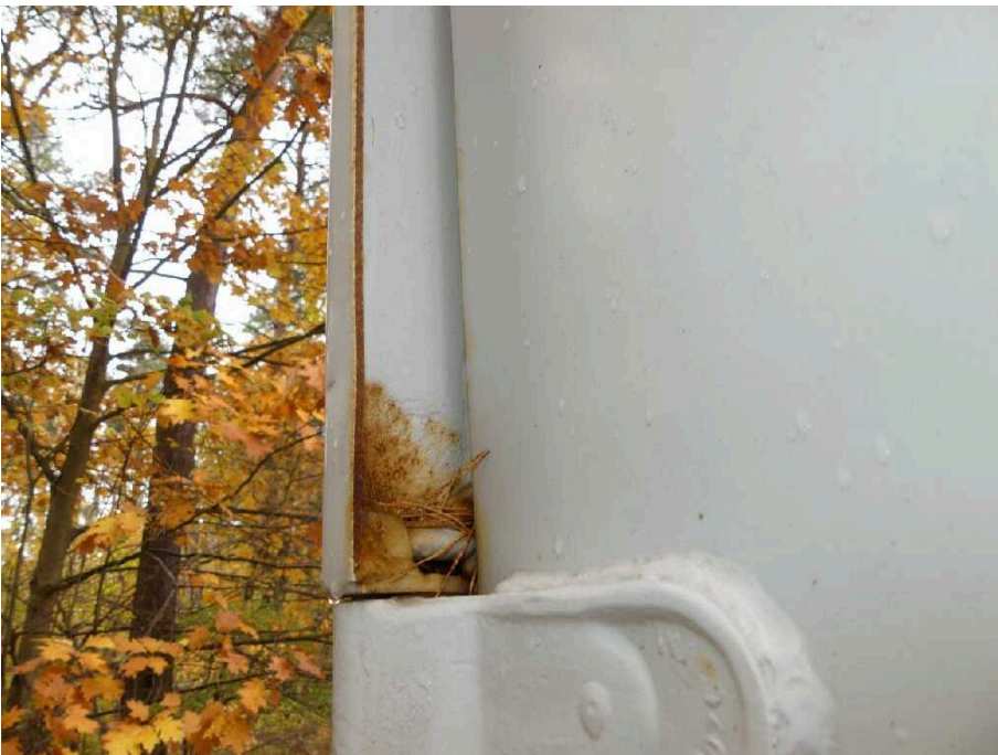
Bild 30 Fahrzeugheck Ecksäule hinten links eingedrückt und korrodiert