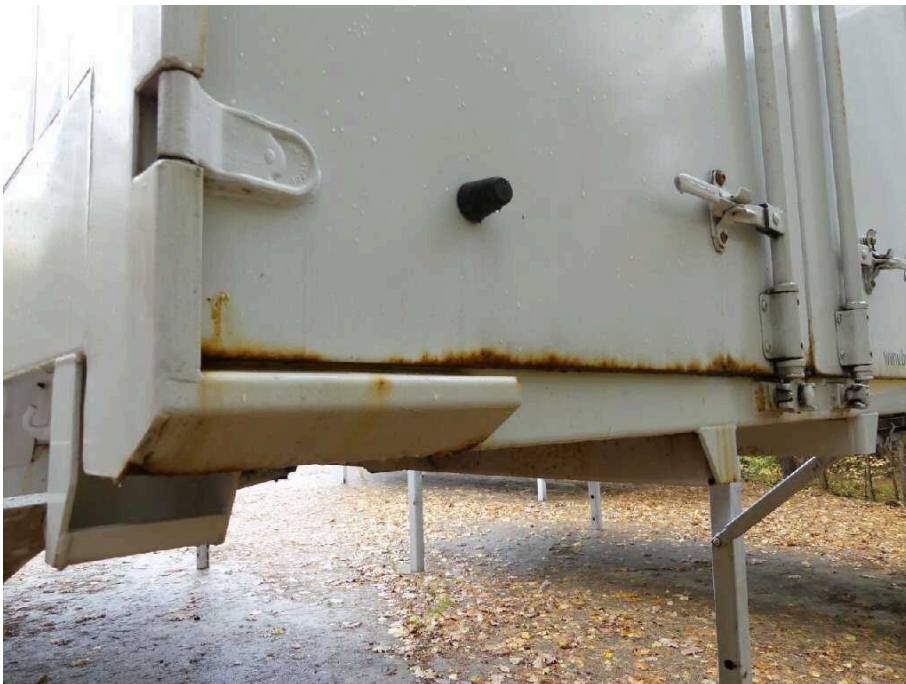
Bild 14 Fahrzeugheck Heckflügeltür links stark korrodiert