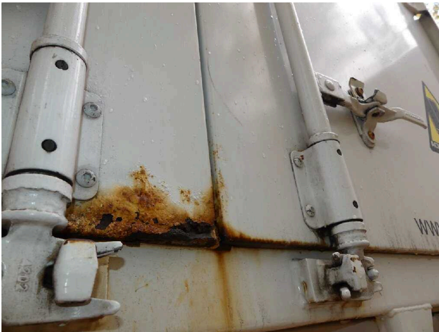
Bild 18 Fahrzeugheck Heckflügeltür links stark korrodiert