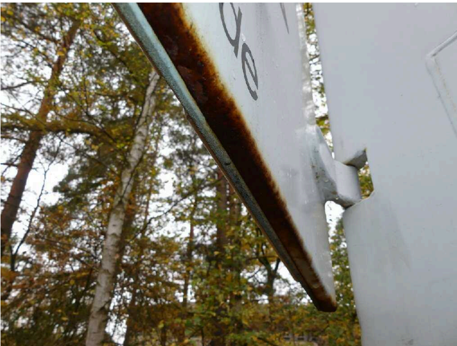
Bild 26 Fahrzeugheck Heckflügeltür rechts korrodiert