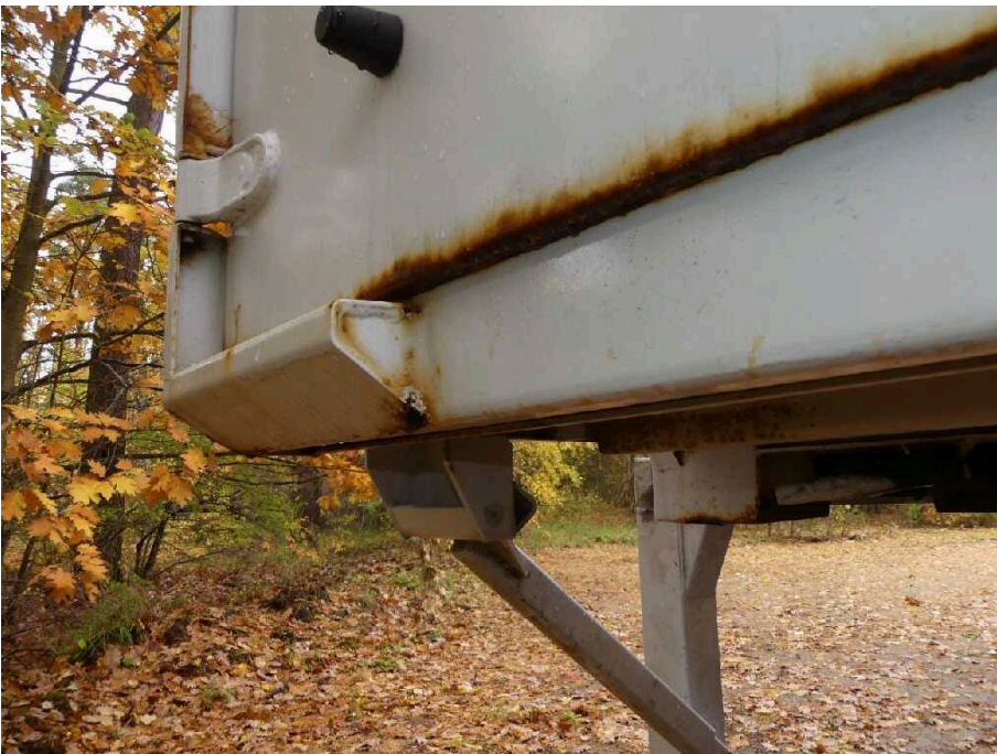
Bild 32 Fahrzeugheck Rahmen hinten links korrodiert