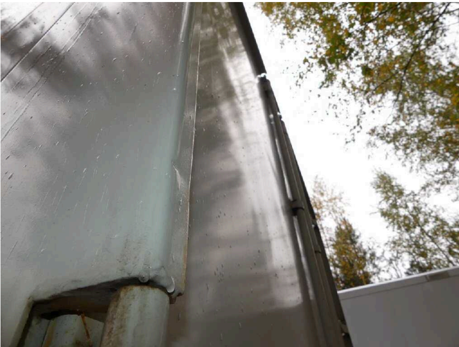
Bild 29 Fahrzeugheck Ecksäule hinten links eingedrückt und korrodiert