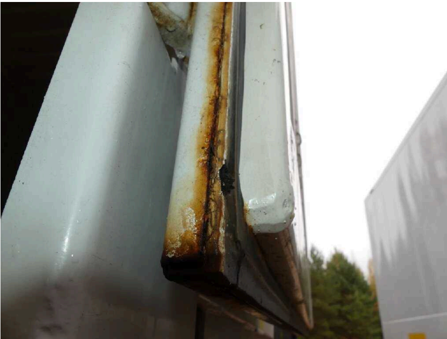
Bild 25 Fahrzeugheck Heckflügeltür rechts korrodiert