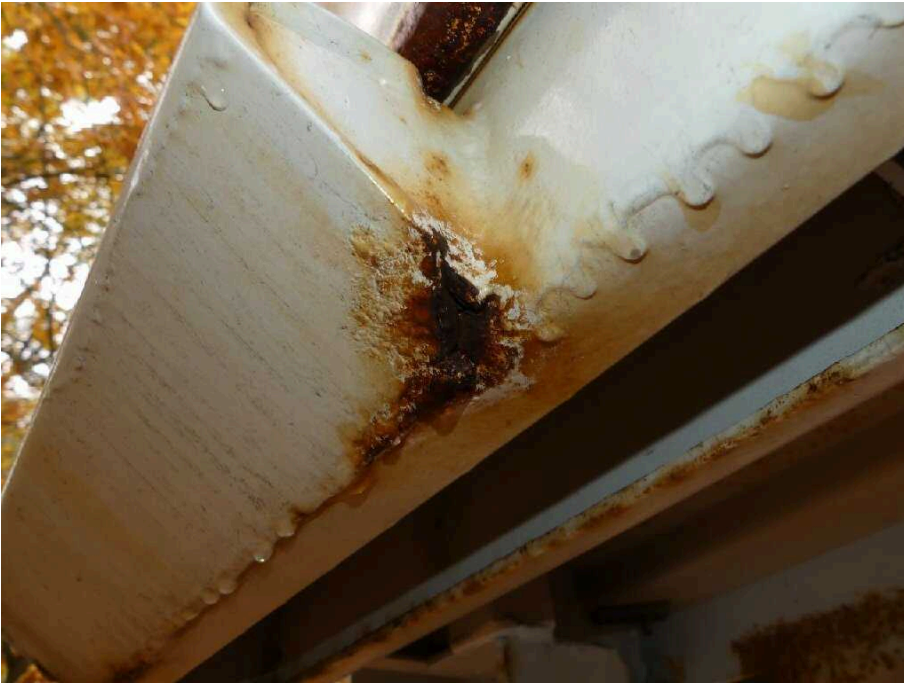
Bild 33 Fahrzeugheck Rahmen hinten links korrodiert