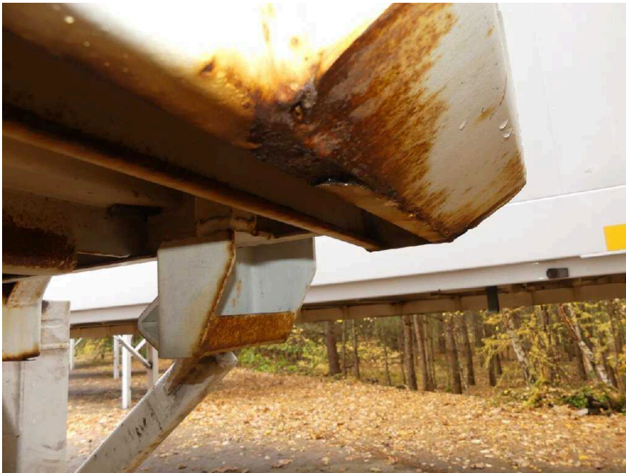
Bild 35 Fahrzeugheck Rahmen hinten rechts korrodiert