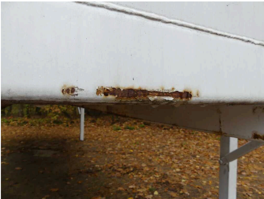
Bild 10 Aufbau Bodenrahmen vorne korrodiert