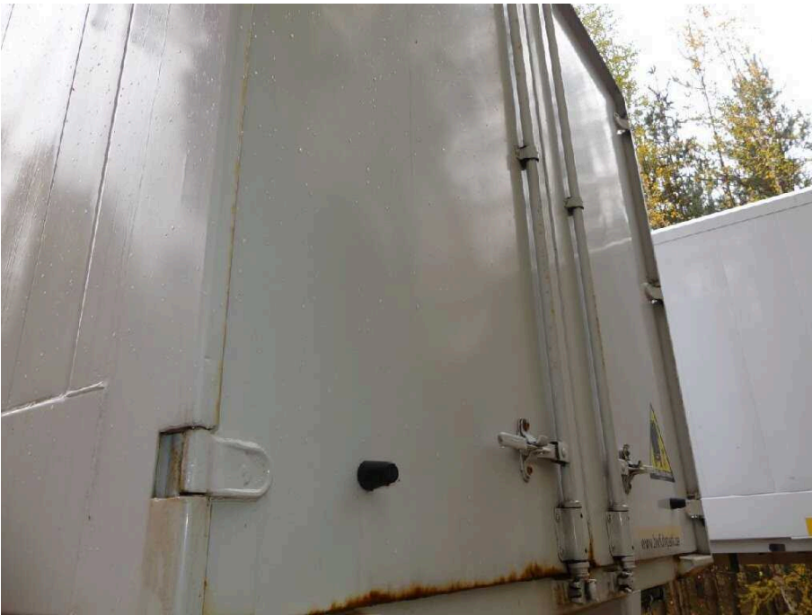
Bild 27 Fahrzeugheck Ecksäule hinten links eingedrückt und korrodiert