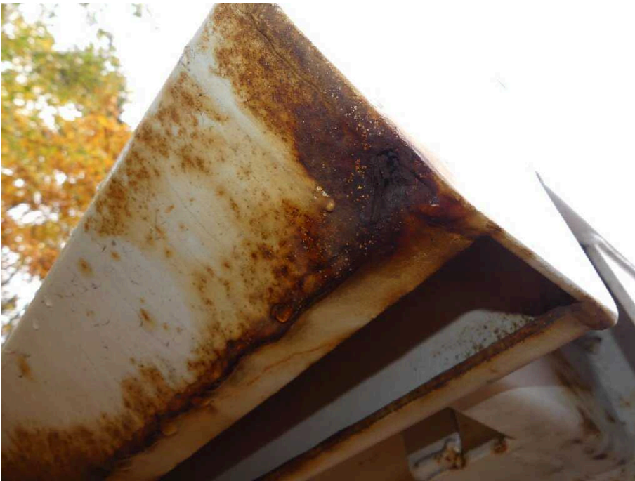
Bild 37 Fahrzeugheck Rahmen hinten rechts korrodiert