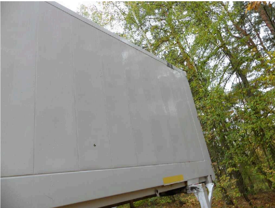
Bild 11 Fahrzeug Fahrzeug aussen links, korrodiert und verkratzt