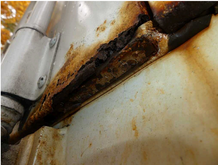
Bild 19 Fahrzeugheck Heckflügeltür links stark korrodiert