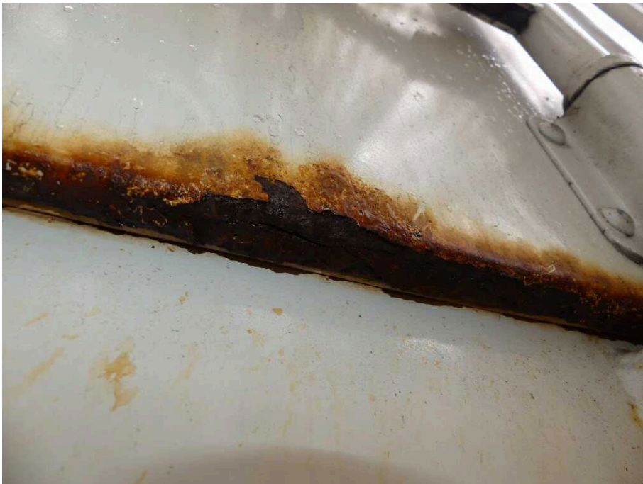
Bild 17 Fahrzeugheck Heckflügeltür links stark korrodiert