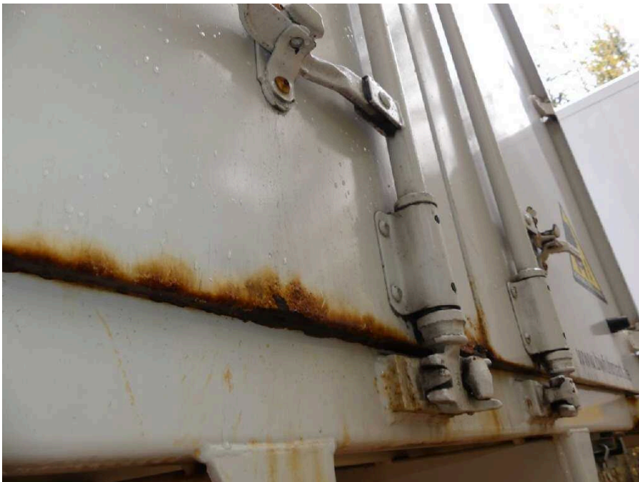
Bild 16 Fahrzeugheck Heckflügeltür links stark korrodiert