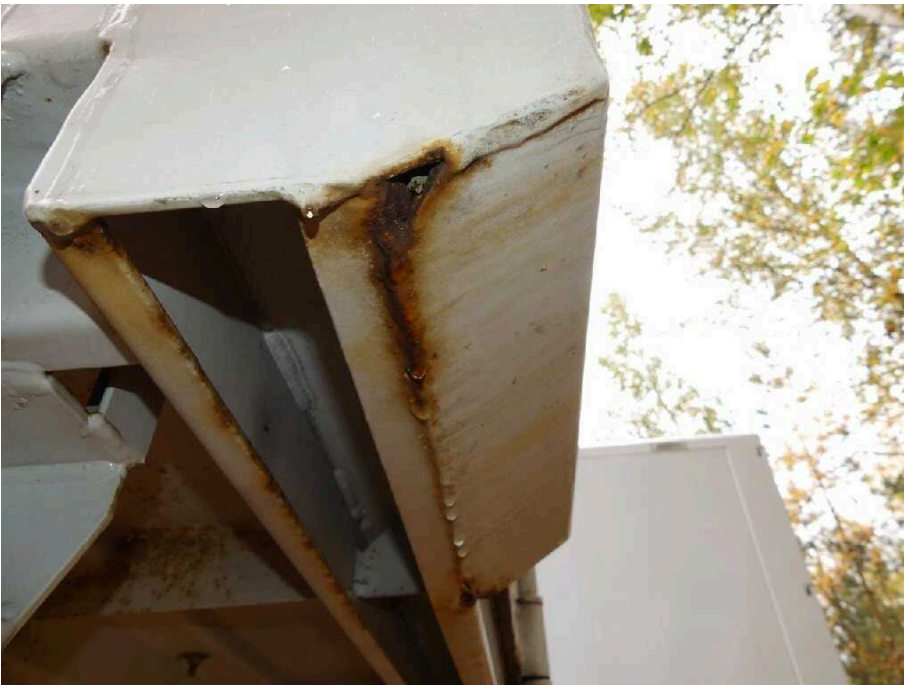
Bild 31 Fahrzeugheck Rahmen hinten links korrodiert