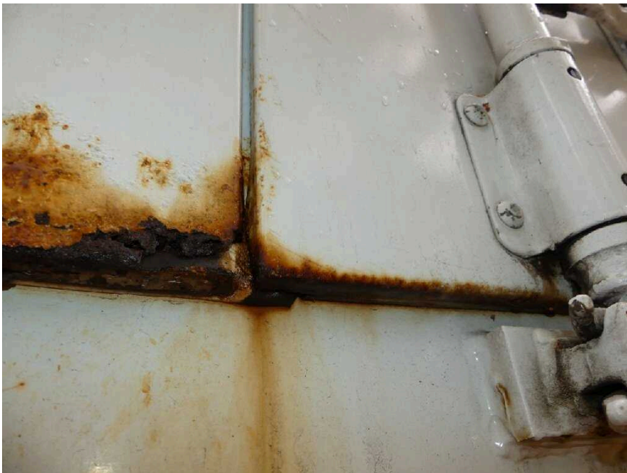
Bild 20 Fahrzeugheck Heckflügeltür links stark korrodiert