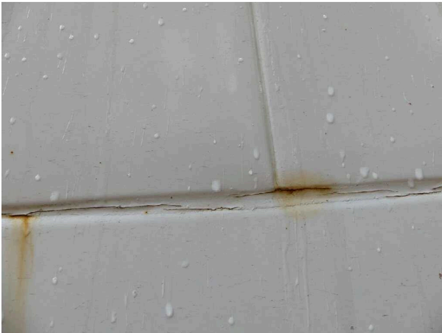
Bild 13 Fahrzeug Fahrzeug aussen links, korrodiert und verkratzt