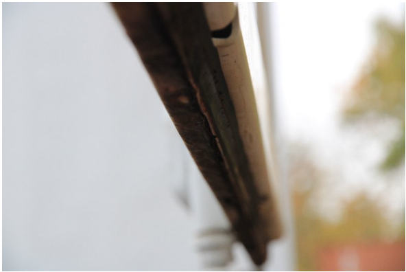
Bild 10: Heckbereich starke Korrosion - entrosten und beilackieren