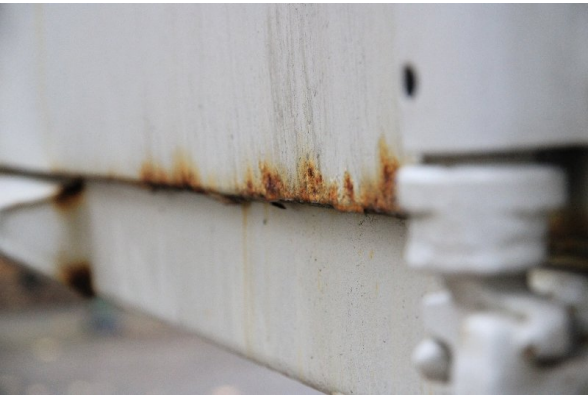
Bild 7: Heckbereich starke Korrosion - entrosten und beilackieren