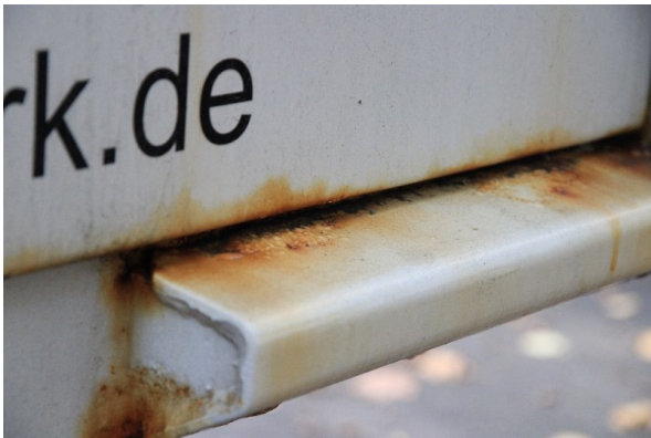
Bild 5: Heckbereich starke Korrosion - entrosten und beilackieren