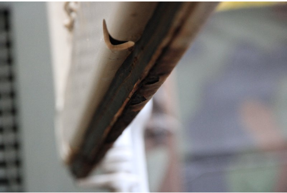
Bild 9: Heckbereich starke Korrosion - entrosten und beilackieren