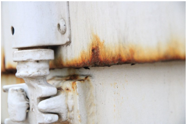
Bild 6: Heckbereich starke Korrosion - entrosten und beilackieren