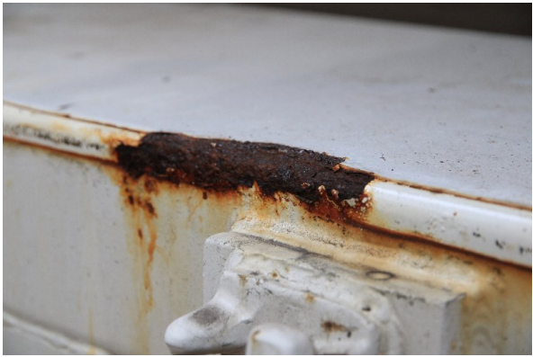
Bild 8: Heckbereich starke Korrosion - entrosten und beilackieren