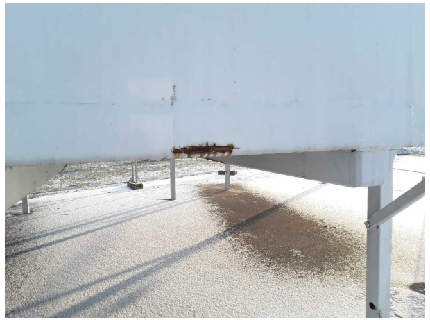
Gebrauchsspur 1: Koffer: Koffer - Korrosion - kein Abzug