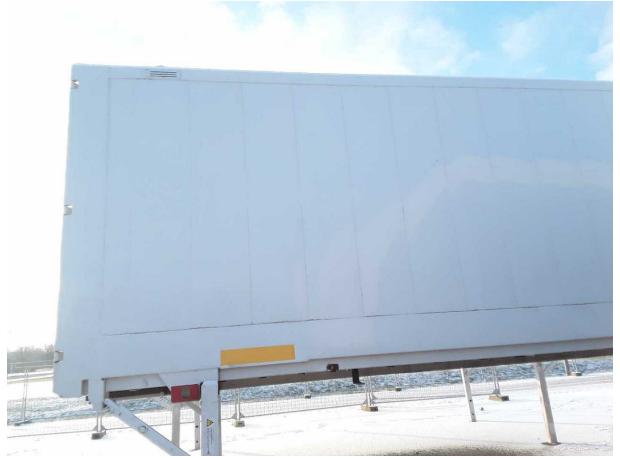
Abbildung 2: Schräg hinten