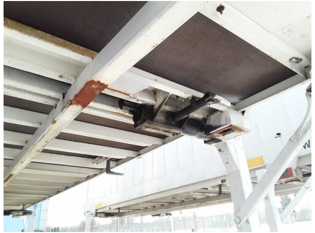
Gebrauchsspur 1: Koffer: Koffer - Korrosion - kein Abzug