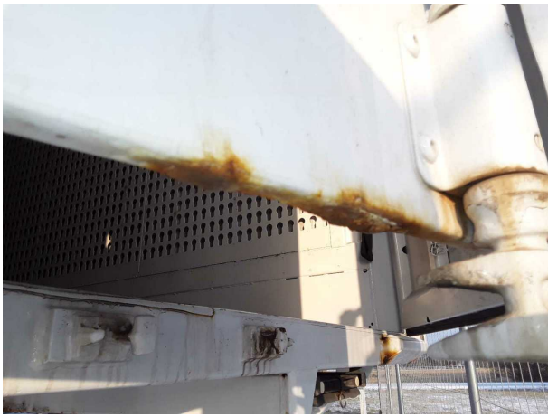
Beschädigung 2: Heckklappe/-tür: Hecktür links (Stark) - Korrosion - instandsetzen und lackieren