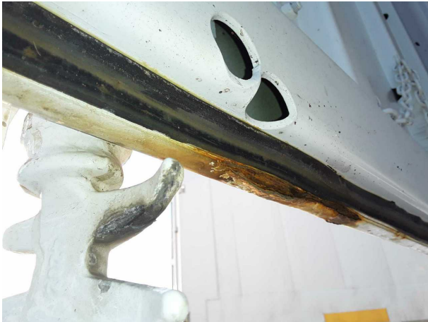
Beschädigung 2: Heckklappe/-tür: Hecktür links (Stark) - Korrosion - instandsetzen und lackieren