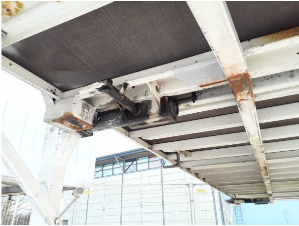
Gebrauchsspur 1: Koffer: Koffer - Korrosion - kein Abzug