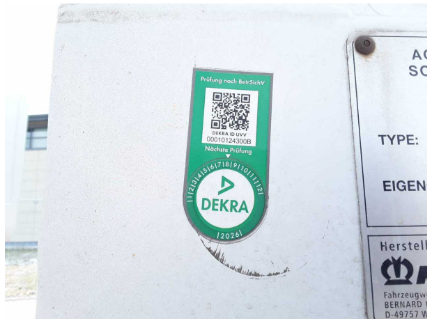
Abbildung 4: Kombiinstrument