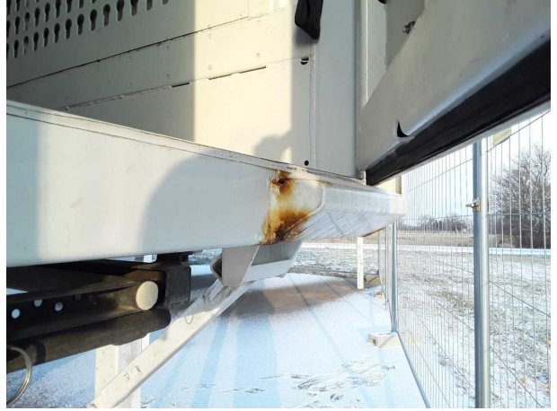
Beschädigung 1: Koffer: Portalrahmen - Korrosion - instandsetzen und lackieren