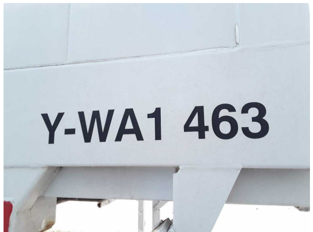
Abbildung 6: Dokumente