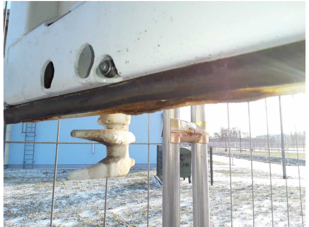
Beschädigung 2: Heckklappe/-tür: Hecktür links (Stark) - Korrosion - instandsetzen und lackieren