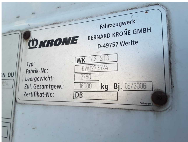
Abbildung 5: FIN