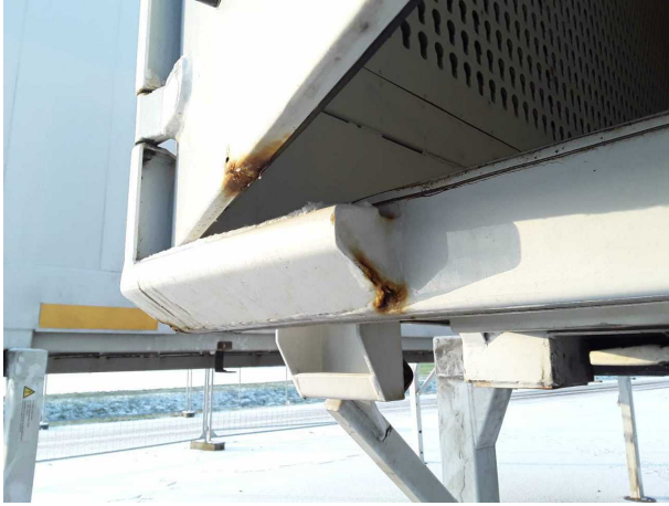
Beschädigung 1: Koffer: Portalrahmen - Korrosion - instandsetz... und lackieren