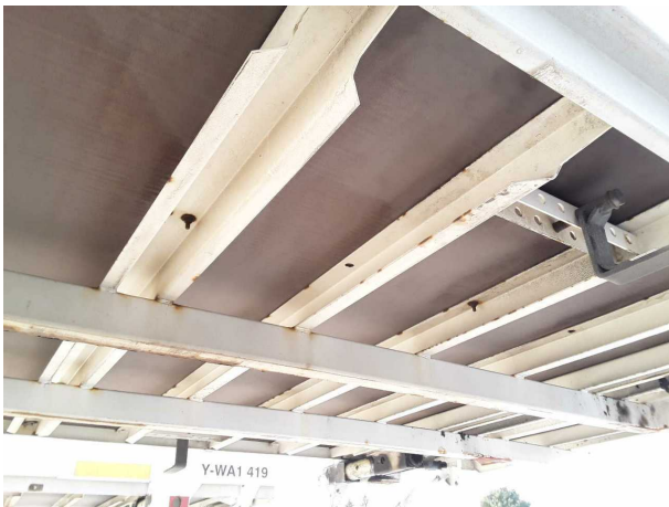
Gebrauchsspur 1: Koffer: Koffer - Korrosion - kein Abzug