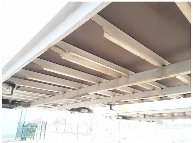
Gebrauchsspur 1: Koffer: Koffer - Korrosion - kein Abzug