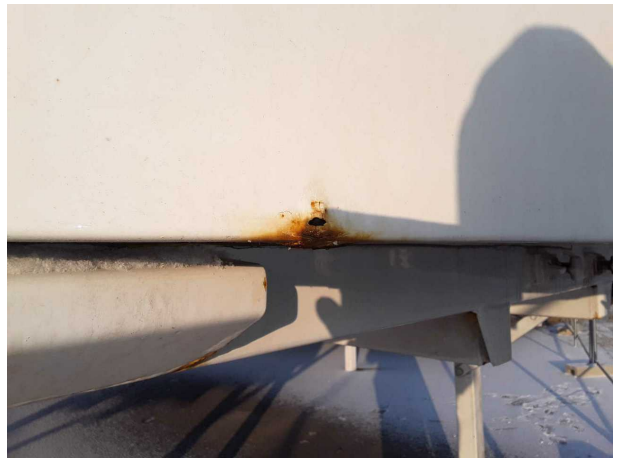
Beschädigung 2: Heckklappe/-tür: Hecktür links (Stark) - Korrosion - instandsetzen und lackieren