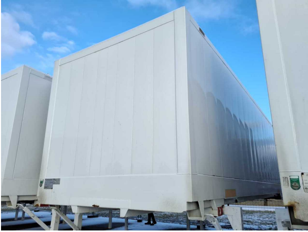
Abbildung 1: Schräg vorne