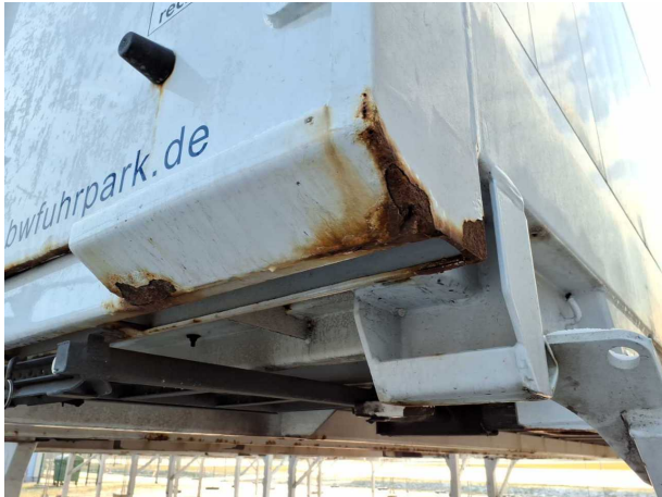
Beschädigung 3: Koffer: Portalrahmen - Korrosion - instandsetz... und lackieren