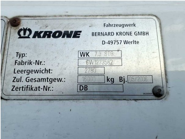
Abbildung 6: Dokumente