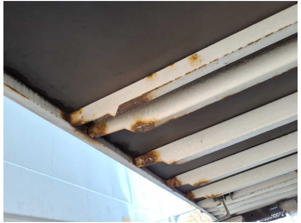
Gebrauchsspur 1: Koffer: Koffer - Korrosion - kein Abzug