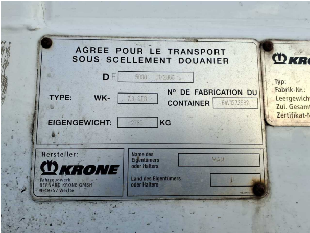
Abbildung 5: FIN