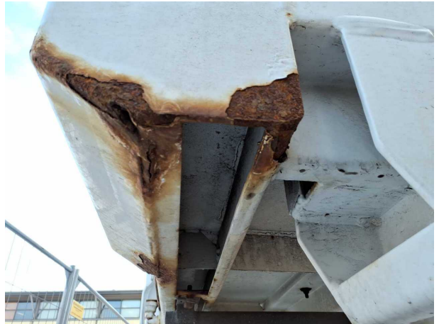
Beschädigung 3: Koffer: Portalrahmen - Korrosion - instandsetzen und lackieren