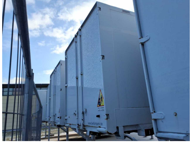
Abbildung 2: Schräg hinten