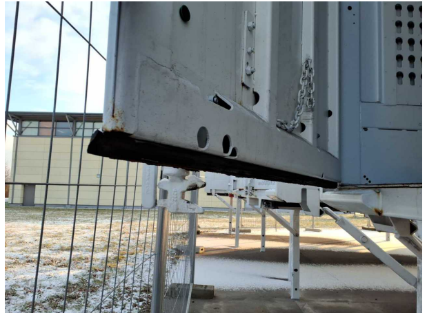
Beschädigung 1: Heckklappe/-tür: Hecktür links - Korrosion - instandsetzen und lackieren