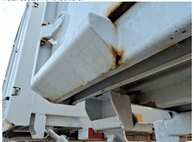
Beschädigung 3: Koffer: Portalrahmen - Korrosion - instandsetzen und lackieren