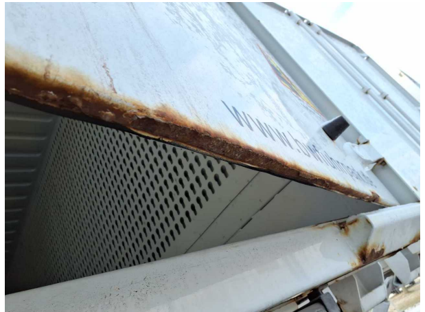
Beschädigung 2: Heckklappe/-tür: Hecktür rechts - Korrosio... instandsetzen und lackieren