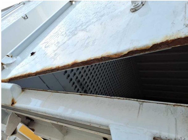
Beschädigung 1: Heckklappe/-tür: Hecktür links - Korrosion - instandsetzen und lackieren