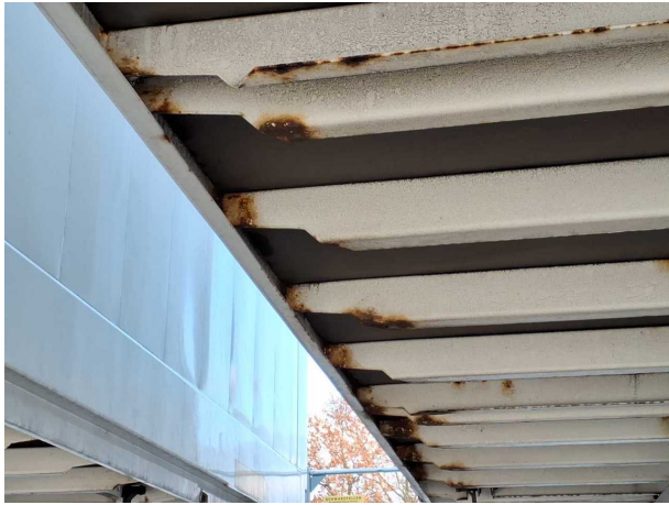
Gebrauchsspur 1: Koffer: Koffer - Korrosion - kein Abzug