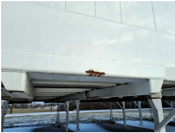
Gebrauchsspur 1: Koffer: Koffer - Korrosion - kein Abzug