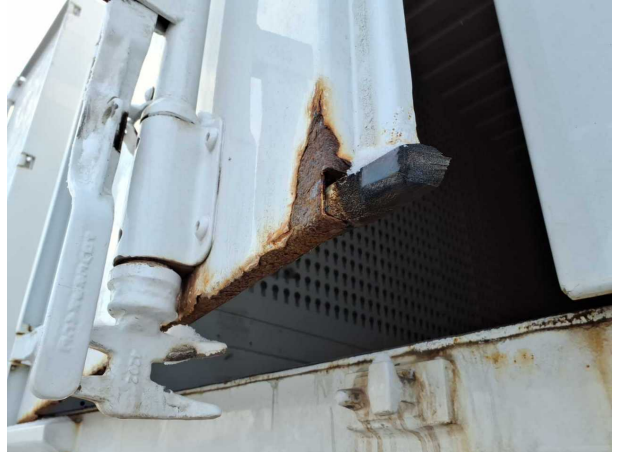
Beschädigung 1: Heckklappe/-tür: Hecktür links - Korrosion - instandsetzen und lackieren