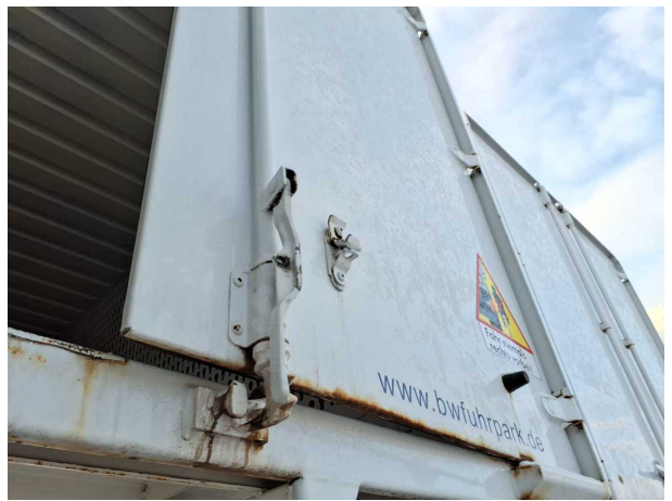
Beschädigung 2: Heckklappe/-tür: Hecktür rechts - Korrosio... instandsetzen und lackieren