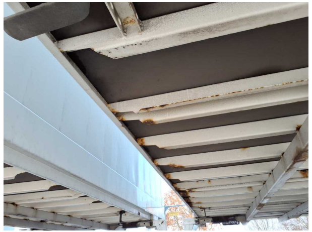
Gebrauchsspur 1: Koffer: Koffer - Korrosion - kein Abzug