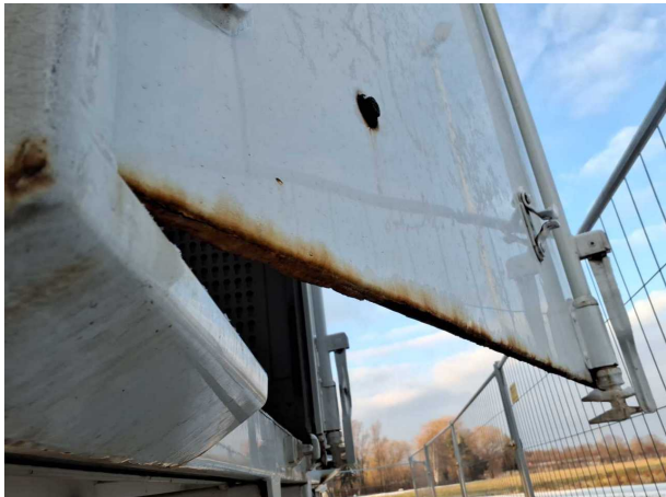
Beschädigung 1: Heckklappe/-tür: Hecktür links - Korrosion - instandsetzen und lackieren