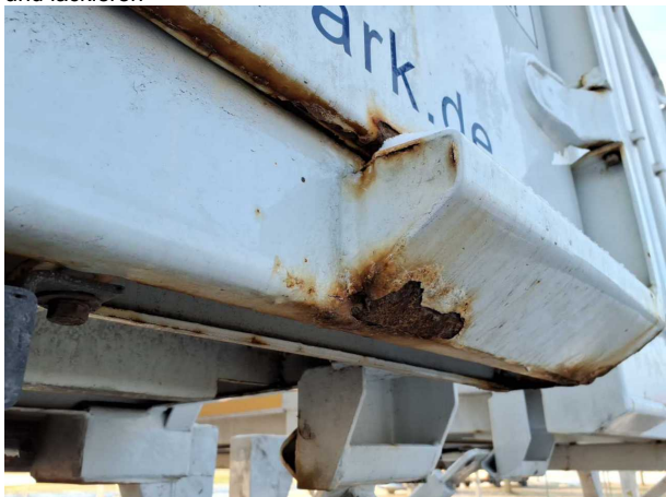
Beschädigung 3: Koffer: Portalrahmen - Korrosion - instandsetz... und lackieren