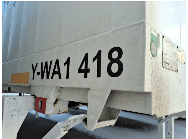
Abbildung 4: Kombiinstrument