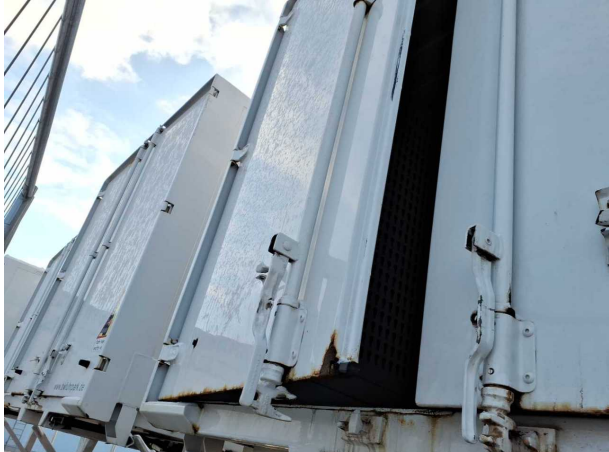
Beschädigung 1: Heckklappe/-tür: Hecktür links - Korrosion - instandsetzen und lackieren