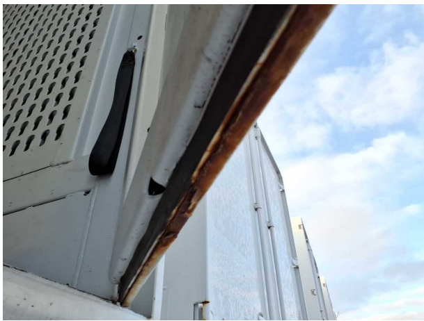
Beschädigung 2: Heckklappe/-tür: Hecktür rechts - Korrosion - instandsetzen und lackieren