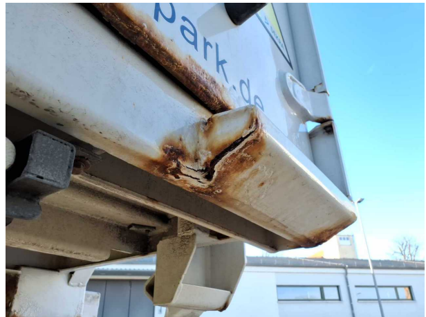
Gebrauchsspur 1: Koffer: Koffer - Korrosion - kein Abzug