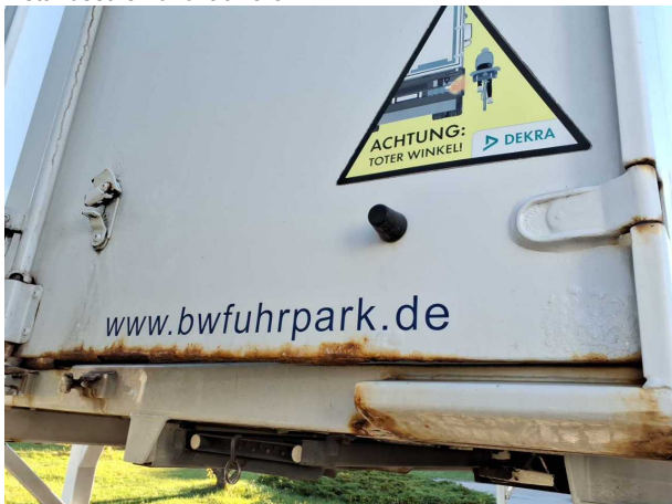
Beschädigung 2: Heckklappe/-tür: Hecktür rechts - Korrosion - instandsetzen und lackieren