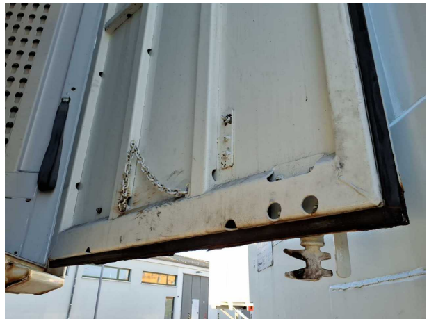
Beschädigung 2: Heckklappe/-tür: Hecktür rechts - Korrosio... instandsetzen und lackieren