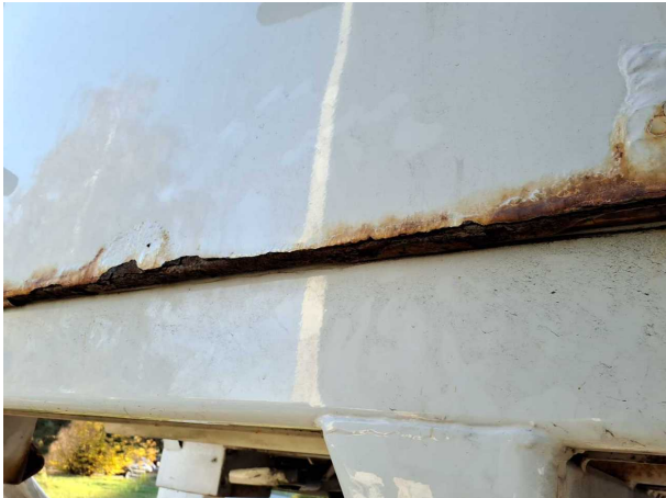
Beschädigung 1: Heckklappe/-tür: Hecktür links - Korrosion - instandsetzen und lackieren