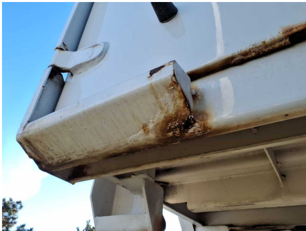
Gebrauchsspur 1: Koffer: Koffer - Korrosion - kein Abzug