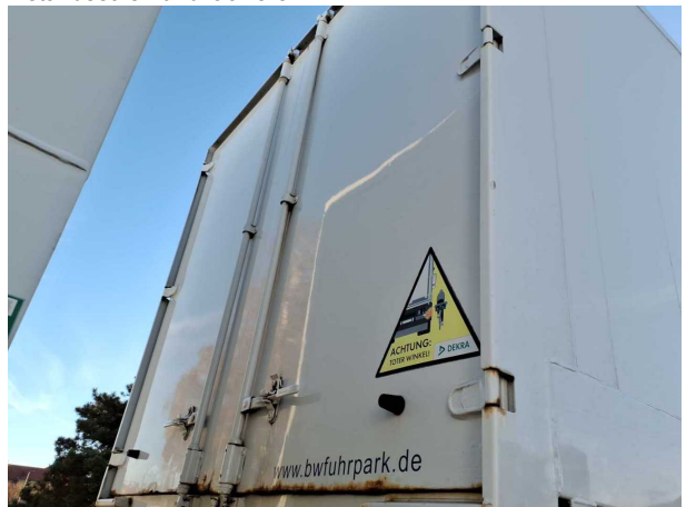
Beschädigung 2: Heckklappe/-tür: Hecktür rechts - Korrosio... instandsetzen und lackieren