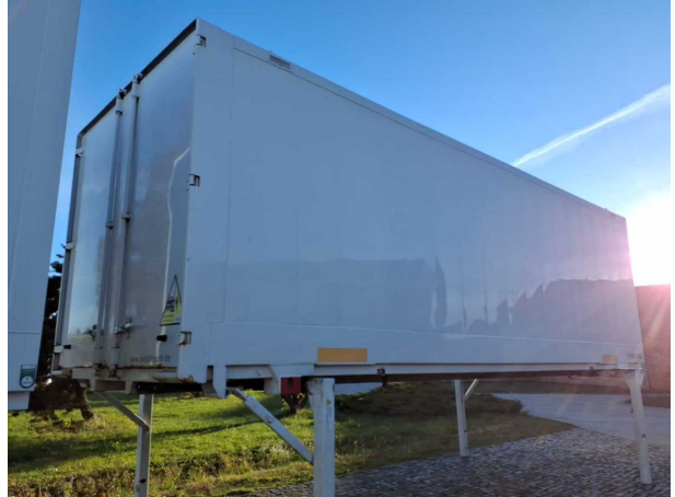
Abbildung 2: Schräg hinten