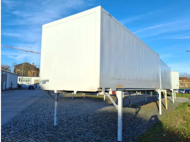
Abbildung 1: Schräg vorne