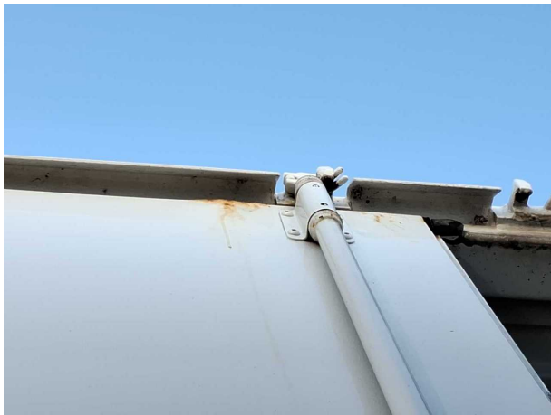
Beschädigung 1: Heckklappe/-tür: Hecktür links - Korrosion - instandsetzen und lackieren