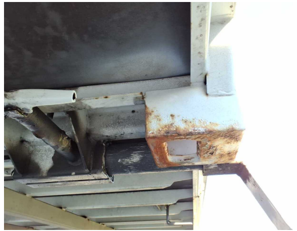
Gebrauchsspur 1: Koffer: Koffer - Korrosion - kein Abzug