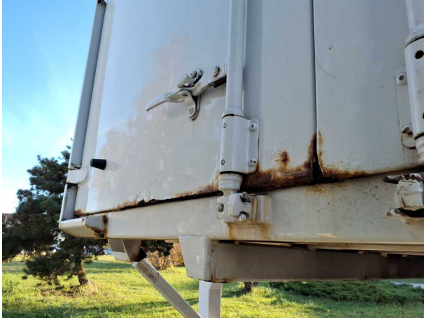
Beschädigung 1: Heckklappe/-tür: Hecktür links - Korrosion - instandsetzen und lackieren