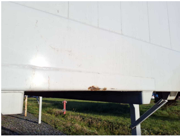
Gebrauchsspur 1: Koffer: Koffer - Korrosion - kein Abzug