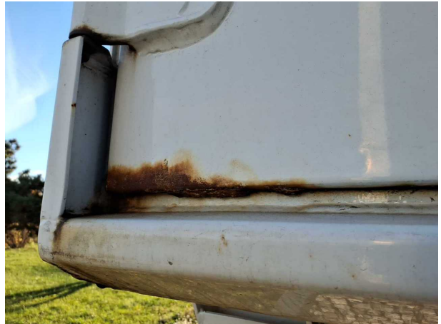
Beschädigung 1: Heckklappe/-tür: Hecktür links - Korrosion - instandsetzen und lackieren