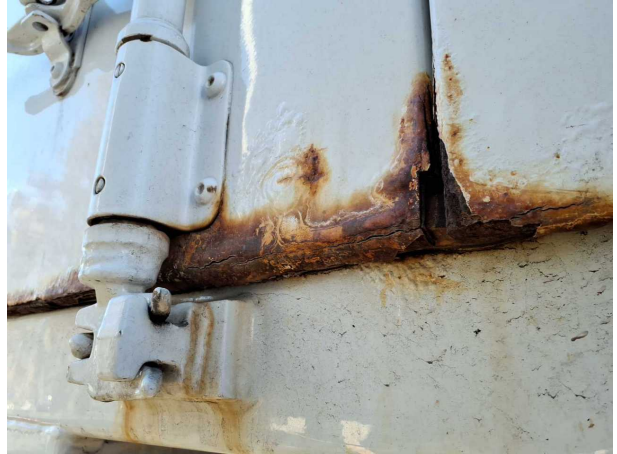
Beschädigung 1: Heckklappe/-tür: Hecktür links - Korrosion - instandsetzen und lackieren