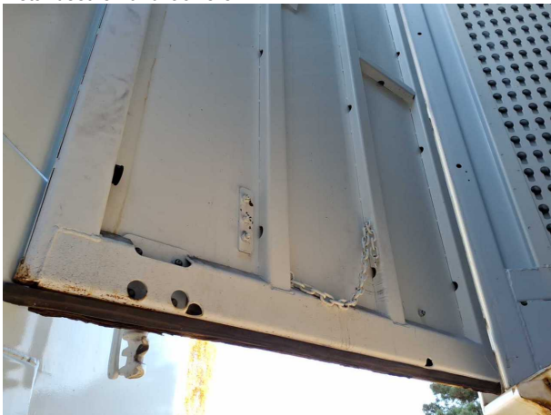
Beschädigung 1: Heckklappe/-tür: Hecktür links - Korrosion - instandsetzen und lackieren