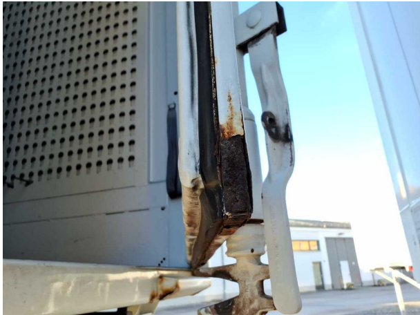
Beschädigung 2: Heckklappe/-tür: Hecktür rechts - Korrosion - instandsetzen und lackieren