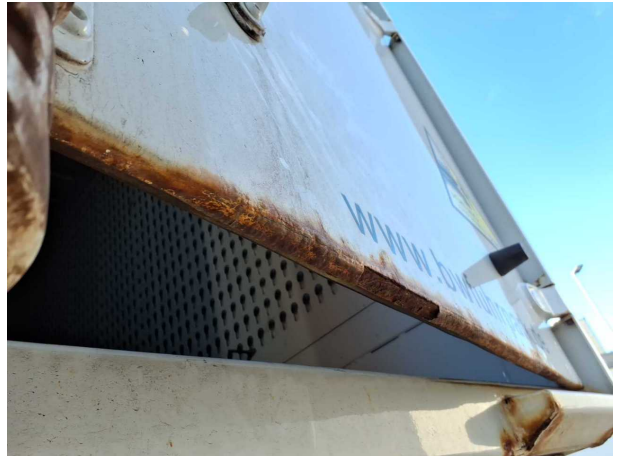
Beschädigung 2: Heckklappe/-tür: Hecktür rechts - Korrosio... instandsetzen und lackieren