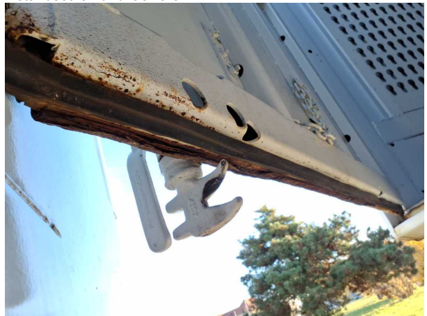
Beschädigung 1: Heckklappe/-tür: Hecktür links - Korrosion - instandsetzen und lackieren