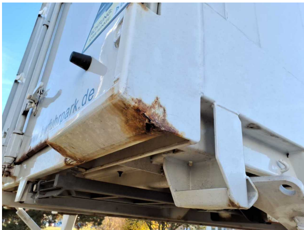
Gebrauchsspur 1: Koffer: Koffer - Korrosion - kein Abzug