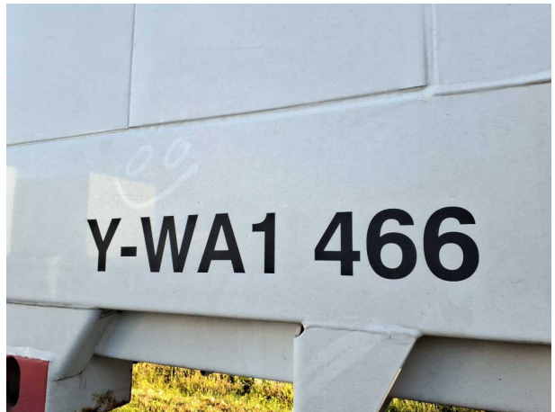
Abbildung 4: Kombiinstrument