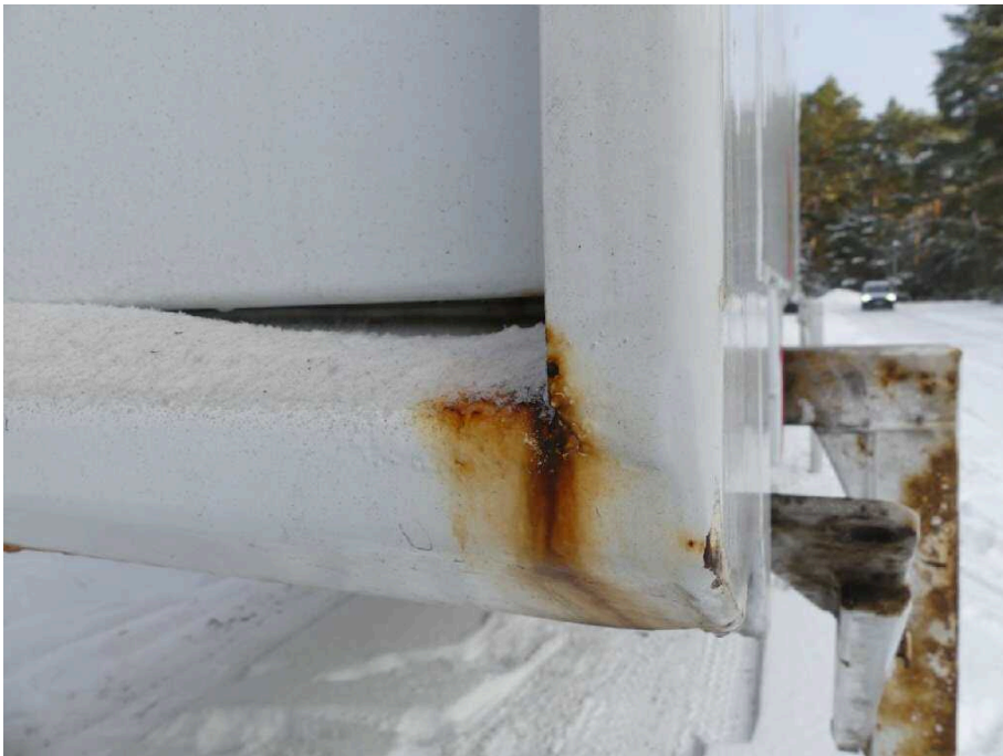
Bild 25 Fahrzeugheck Rahmen hinten rechts stark korrodiert