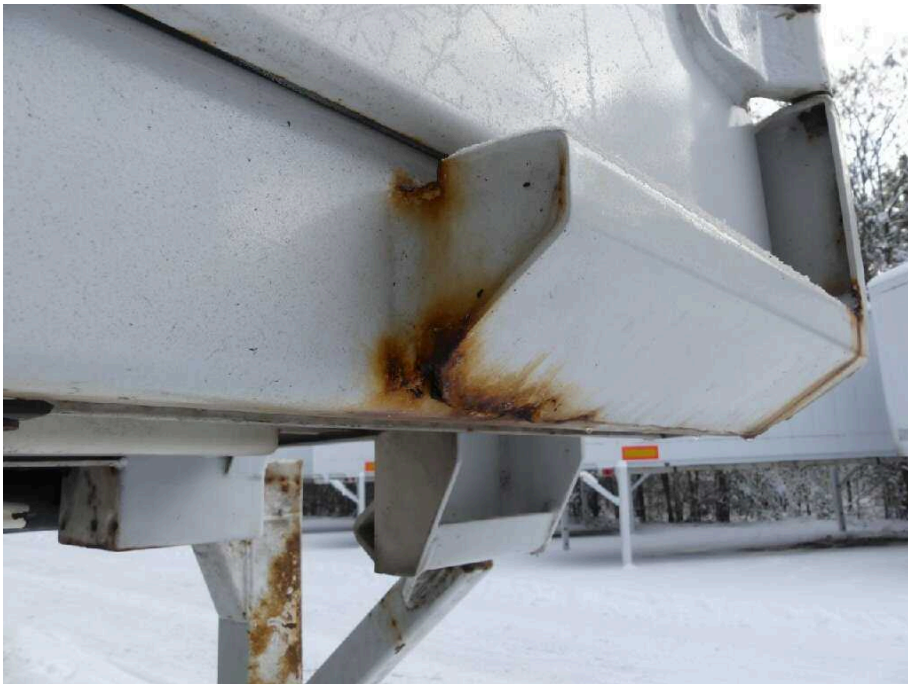
Bild 21 Fahrzeugheck Rahmen hinten rechts stark korrodiert