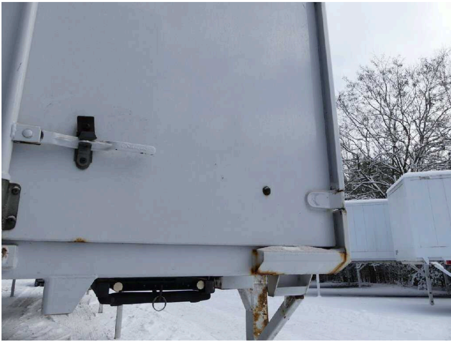
Bild 35 Fahrzeugheck Heckflügeltür rechts Anschlaggummi fehlt