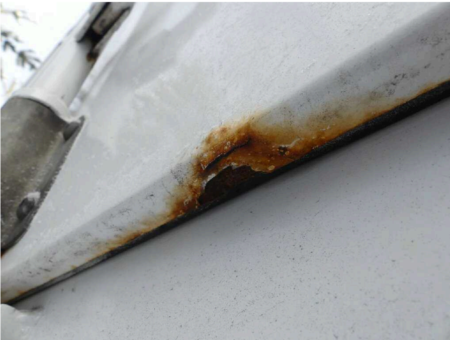
Bild 32 Fahrzeugheck Heckflügeltür rechts stark korrodiert