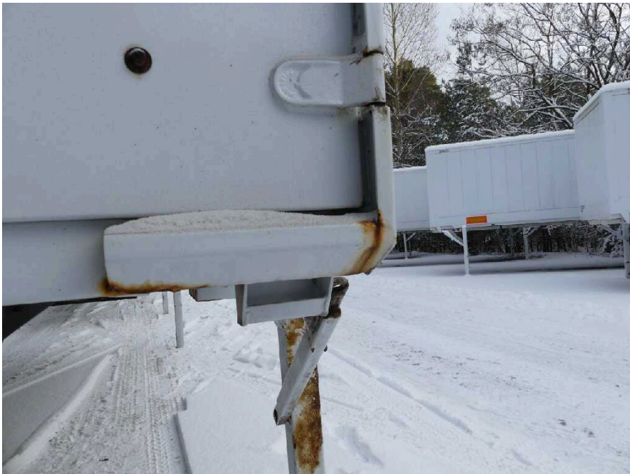
Bild 23 Fahrzeugheck Rahmen hinten rechts stark korrodiert