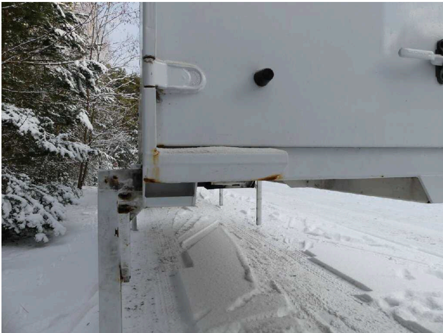
Bild 15 Fahrzeugheck Rahmen hinten links stark korrodiert