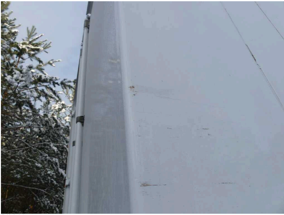
Bild 39 Aufbau Kofferseitenwand rechts hinten verkratzt