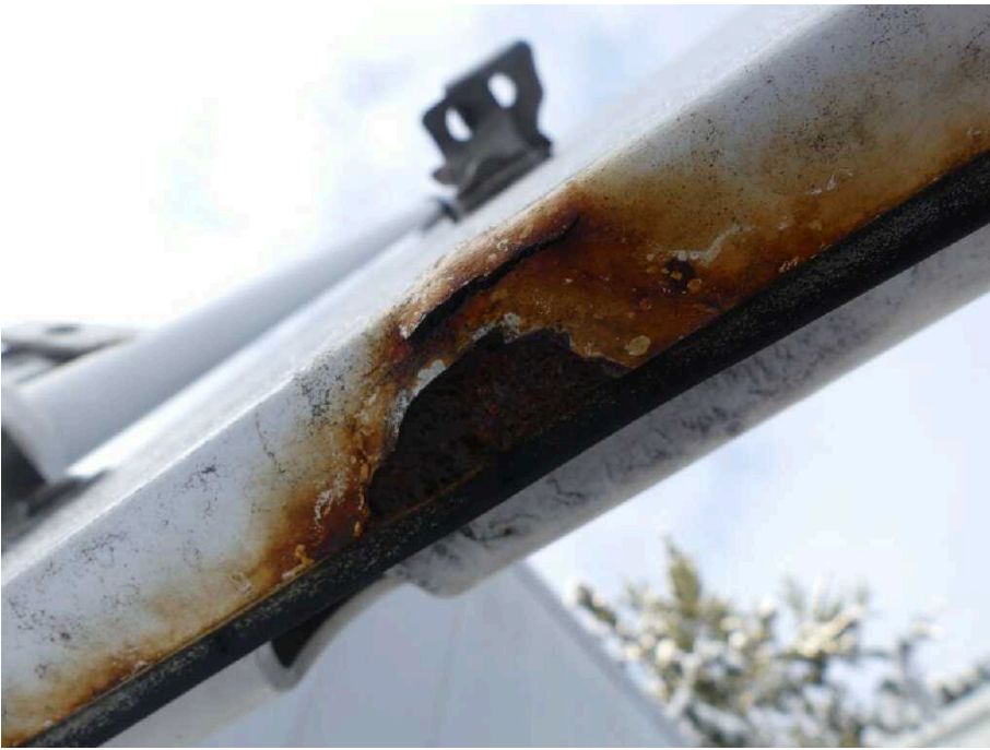
Bild 34 Fahrzeugheck Heckflügeltür rechts stark korrodiert