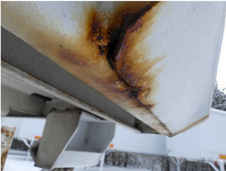
Bild 22 Fahrzeugheck Rahmen hinten rechts stark korrodiert