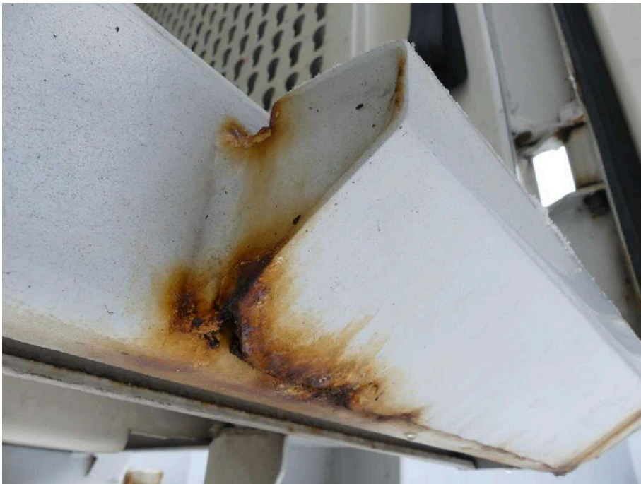
Bild 26 Fahrzeugheck Rahmen hinten rechts stark korrodiert