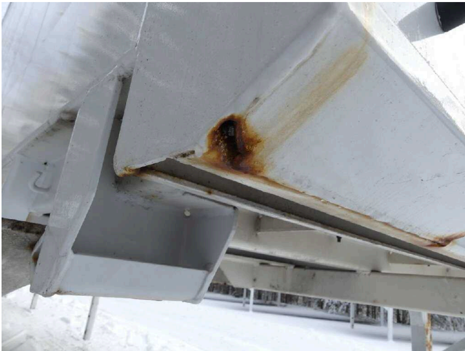
Bild 16 Fahrzeugheck Rahmen hinten links stark korrodiert