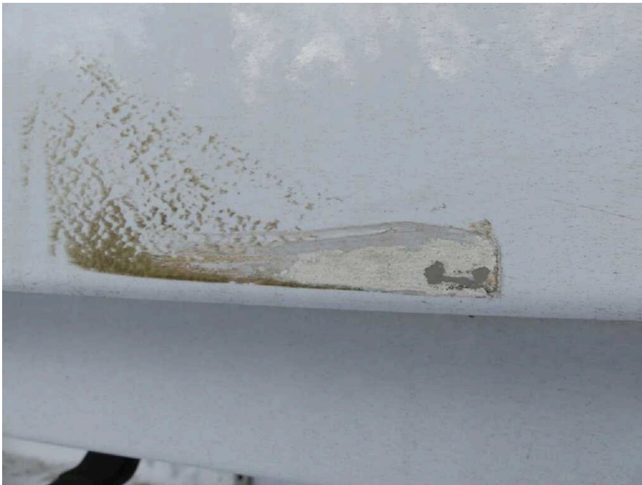
Bild 12 Aufbau Kofferseitenwand rechts hinten verkratzt