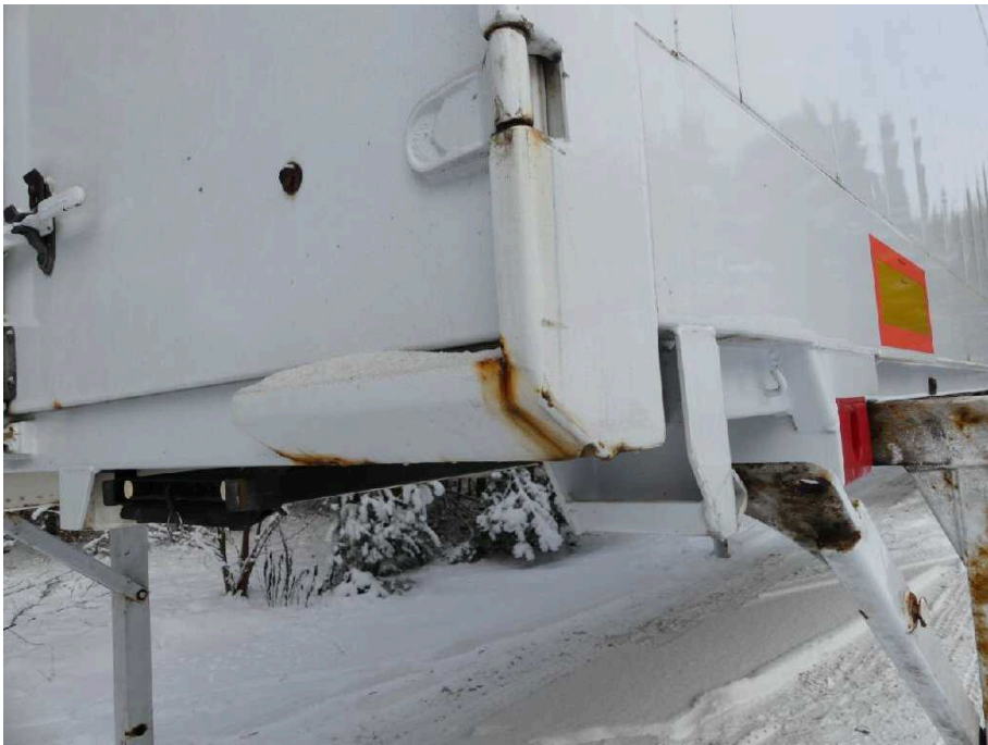
Bild 24 Fahrzeugheck Rahmen hinten rechts stark korrodiert