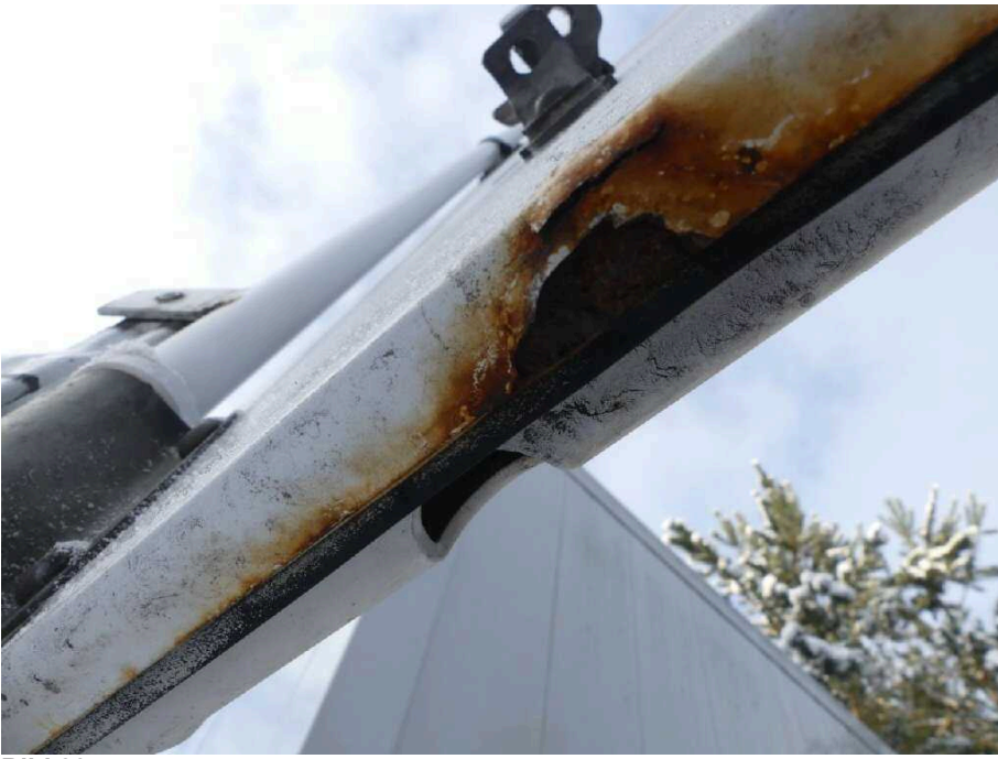
Bild 33 Fahrzeugheck Heckflügeltür rechts stark korrodiert