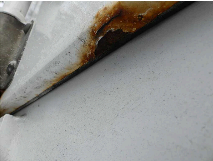
Bild 31 Fahrzeugheck Heckflügeltür rechts stark korrodiert