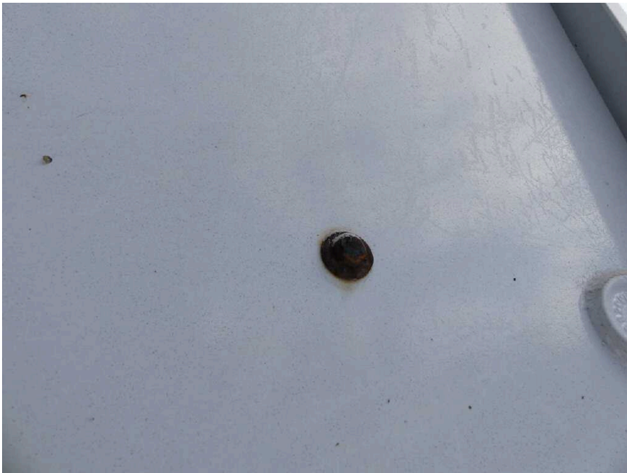
Bild 36 Fahrzeugheck Heckflügeltür rechts Anschlaggummi fehlt