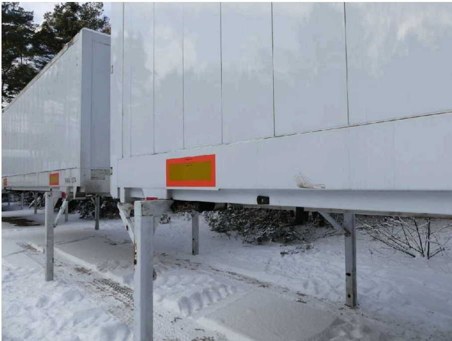
Bild 11 Aufbau Kofferseitenwand rechts hinten verkratzt