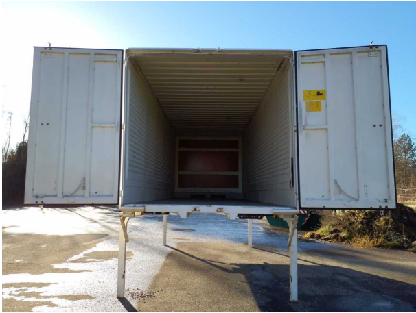
Abbildung 3: Innenraum