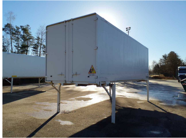
Abbildung 2: Schräg hinten