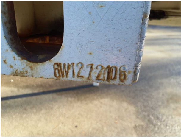
Abbildung 5: FIN