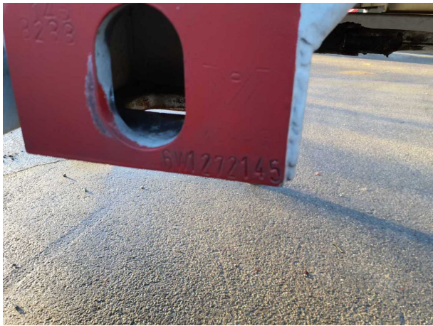
Abbildung 5: FIN