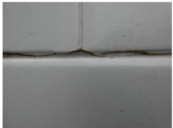
Bild 28: Seitenwand rechts und links Silikonnähte gerissen - erneuern