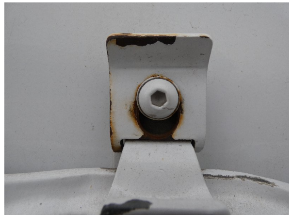
Bild 16: Heckbereich Kratzer/Korrosion - instandsetzen und lackieren