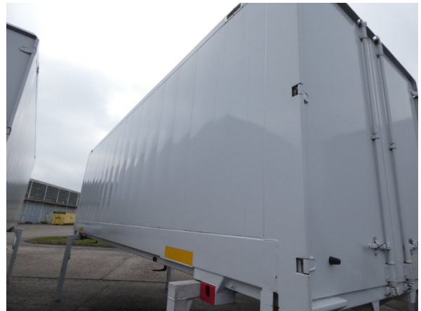
Bild 22: Seitenwand Kratzer/Korrosion - instandsetzen und lackieren