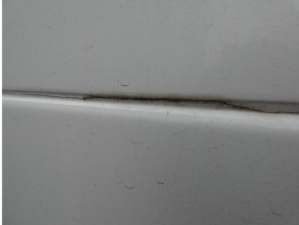
Bild 29: Seitenwand rechts und links Silikonnähte gerissen - erneuern