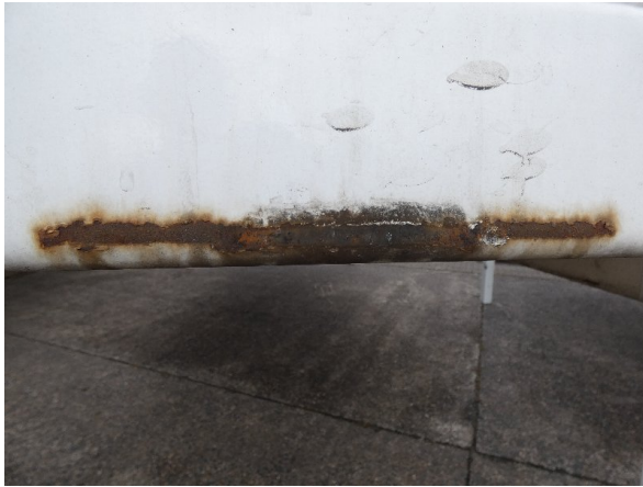
Bild 13: Frontbereich Kratzer/Korrosion - instandsetzen und lackieren