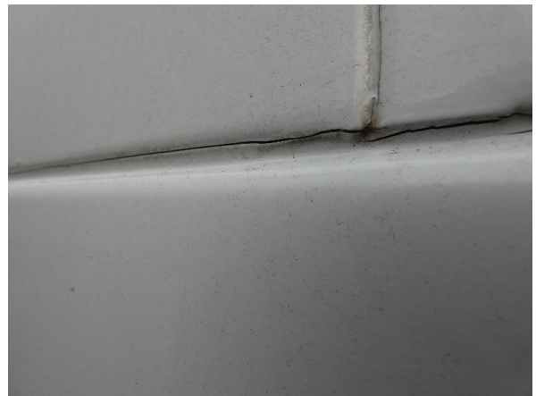
Bild 26: Seitenwand rechts und links Silikonnähte gerissen - erneuern