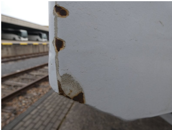
Bild 21: Seitenwand Kratzer/Korrosion - instandsetzen und lackieren