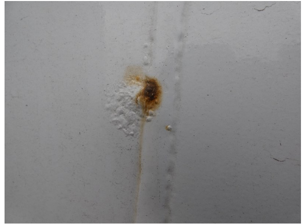
Bild 24: Seitenwand Kratzer/Korrosion - instandsetzen und lackieren