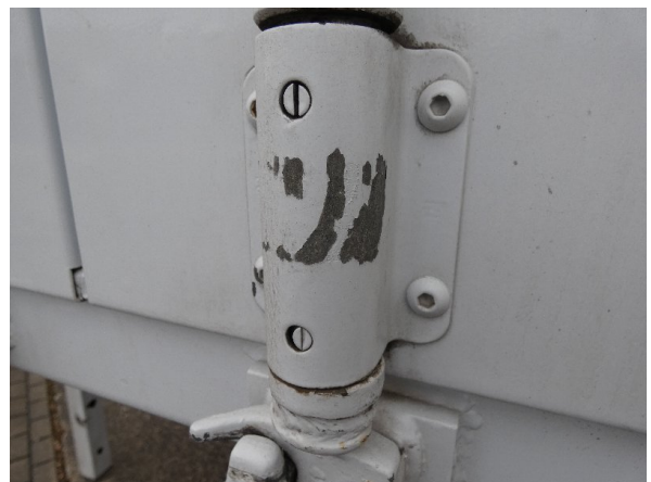
Bild 18: Heckbereich Kratzer/Korrosion - instandsetzen und lackieren