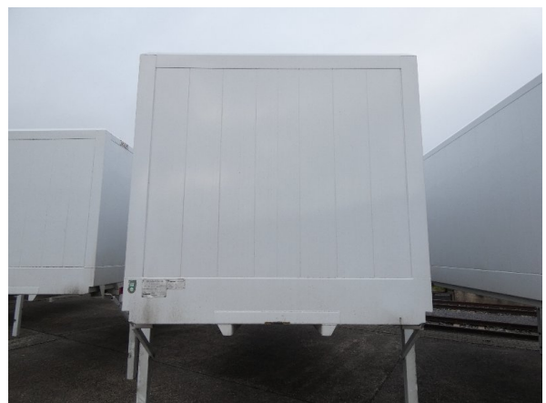
Bild 12: Frontbereich Kratzer/Korrosion - instandsetzen und lackieren