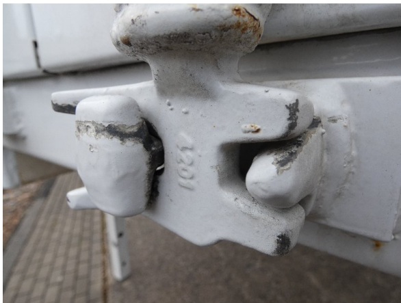
Bild 15: Heckbereich Kratzer/Korrosion - instandsetzen und lackieren