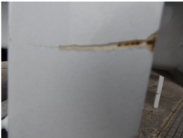
Bild 25: Seitenwand Kratzer/Korrosion - instandsetzen und lackieren