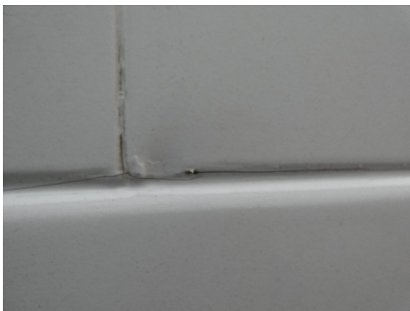
Bild 27: Seitenwand rechts und links Silikonnähte gerissen - erneuern