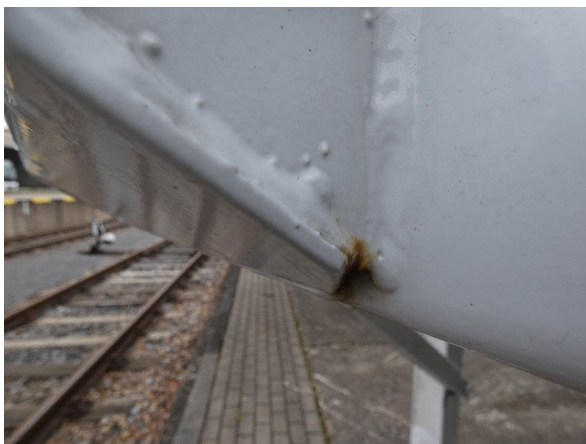
Bild 17: Heckbereich Kratzer/Korrosion - instandsetzen und lackieren