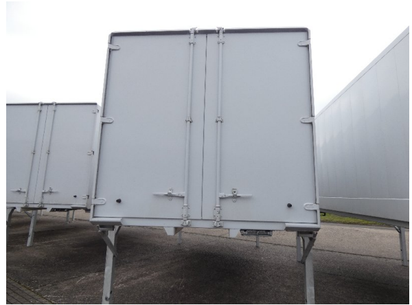
Bild 14: Heckbereich Kratzer/Korrosion - instandsetzen und lackieren