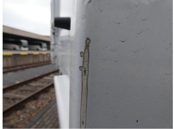
Bild 20: Seitenwand Kratzer/Korrosion - instandsetzen und lackieren