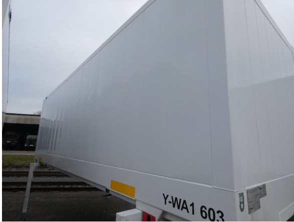
Bild 19: Seitenwand Kratzer/Korrosion - instandsetzen und lackieren