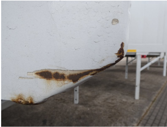
Bild 23: Seitenwand Kratzer/Korrosion - instandsetzen und lackieren