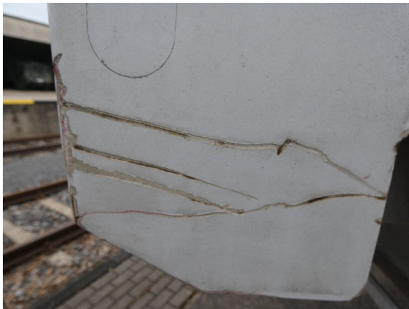
Bild 21: Seitenwand Kratzer/Korrosion - instandsetzen und lackieren