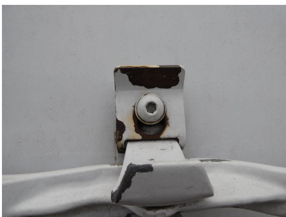
Bild 17: Heckbereich Kratzer/Korrosion - instandsetzen und lackieren