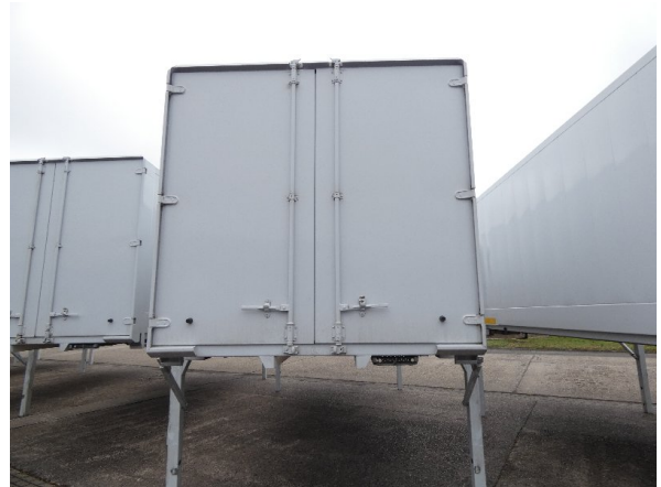
Bild 14: Heckbereich Kratzer/Korrosion - instandsetzen und lackieren