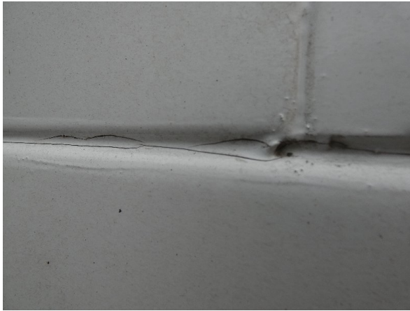
Bild 23: Seitenwand rechts und links Silikonnähte gerissen - erneuern