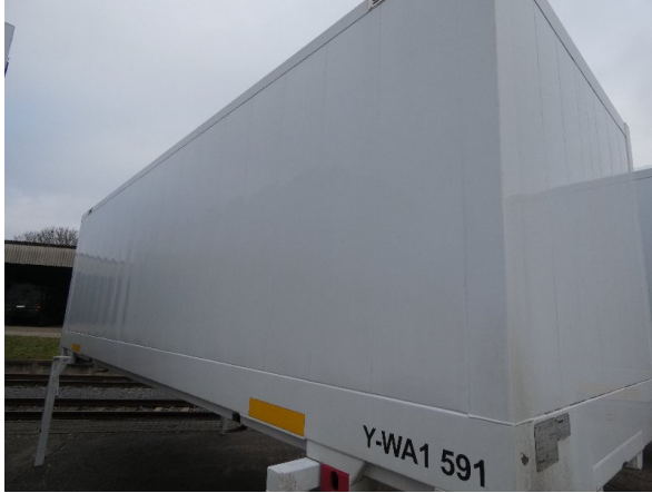
Bild 19: Seitenwand Kratzer/Korrosion - instandsetzen und lackieren