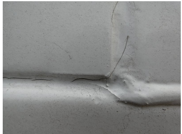
Bild 22: Seitenwand rechts und links Silikonnahte gerissen - erneuern