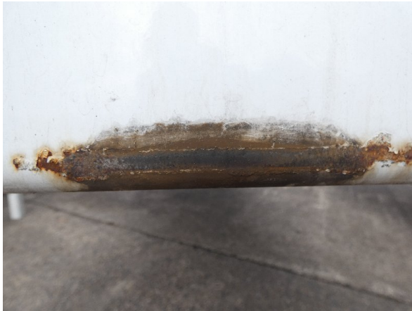
Bild 13: Frontbereich Kratzer/Korrosion - instandsetzen und lackieren