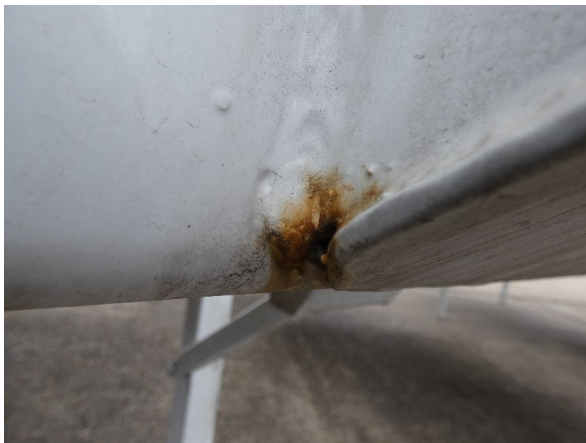
Bild 15: Heckbereich Kratzer/Korrosion - instandsetzen und lackieren