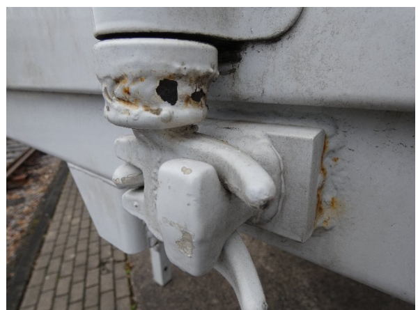
Bild 18: Heckbereich Kratzer/Korrosion - instandsetzen und lackieren