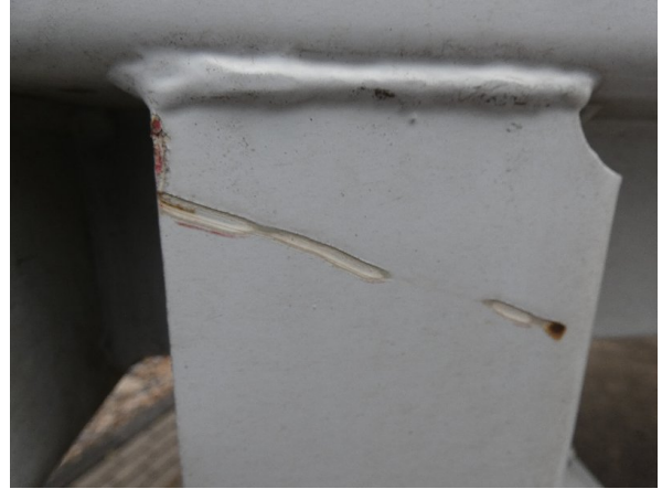
Bild 20: Seitenwand Kratzer/Korrosion - instandsetzen und lackieren