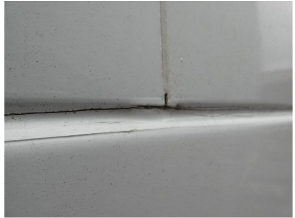
Bild 24: Seitenwand rechts und links Silikonnähte gerissen - erneuern