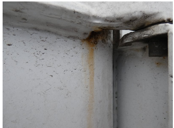
Bild 16: Heckbereich Kratzer/Korrosion - instandsetzen und lackieren