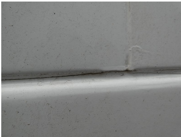
Bild 25: Seitenwand rechts und links Silikonnähte gerissen - erneuern