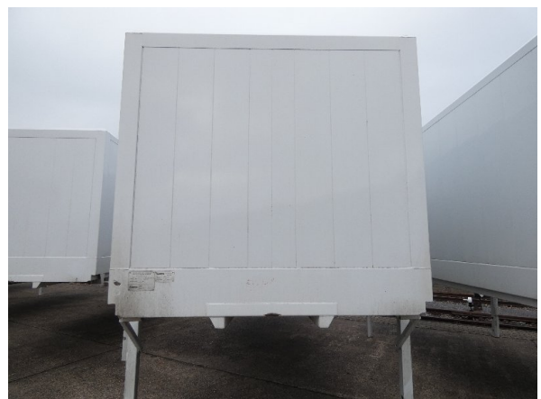
Bild 12: Frontbereich Kratzer/Korrosion - instandsetzen und lackieren