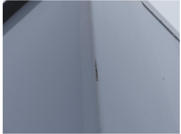
Bild 20: Eckbeplankung rechts Abschürfung - instandsetzen und lackieren