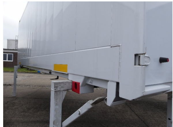
Bild 16: Abdichtung Seitenwand links und rechts beschädigt - erneuern