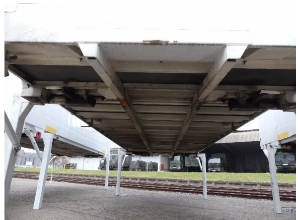
Bild 28: Karosserie Delle / Kratzer / Abschürfung - ohne Reparatur