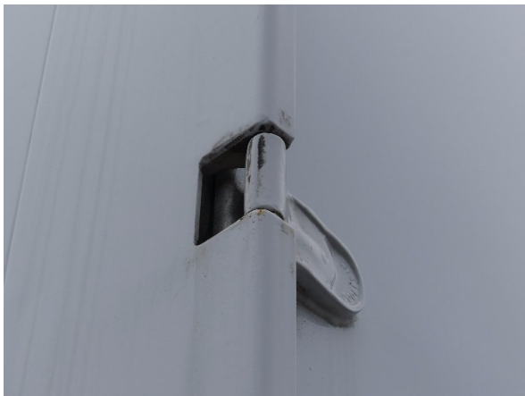
Bild 25: Eckbeplankung links Abschürfung - instandsetzen und lackieren