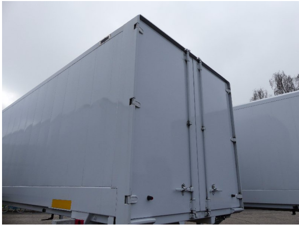
Bild 23: Eckbeplankung links Abschürfung - instandsetzen und lackieren