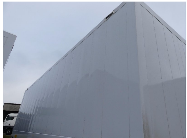
Bild 26: Karosserie Delle / Kratzer / Abschürfung - ohne Reparatur