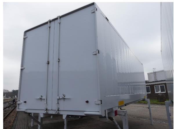
Bild 18: Eckbeplankung rechts Abschürfung - instandsetzen und lackieren