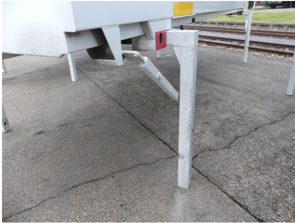
Bild 33: Karosserie Delle / Kratzer / Abschürfung- ohne Reparatur