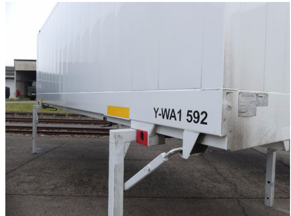
Bild 14: Abdichtung Seitenwand links und rechts beschädigt - erneuern