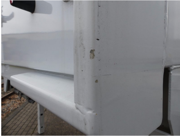
Bild 19: Eckbeplankung rechts Abschürfung - instandsetzen und lackieren