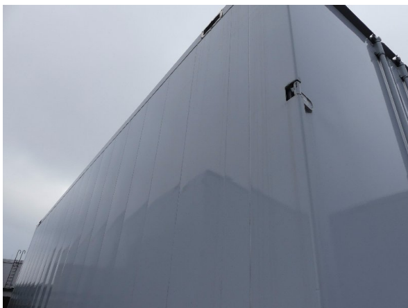
Bild 27: Karosserie Delle / Kratzer / Abschürfung - ohne Reparatur