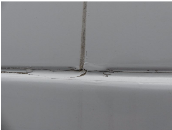
Bild 15: Abdichtung Seitenwand links und rechts beschädigt - erneuern