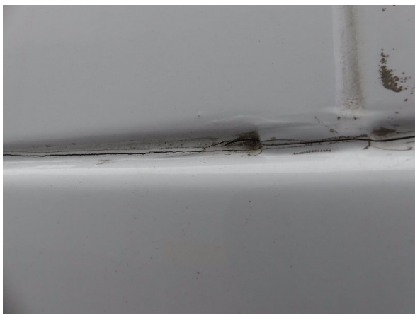
Bild 17: Abdichtung Seitenwand links und rechts beschädigt - erneuern