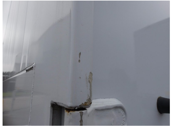
Bild 24: Eckbeplankung links Abschürfung - instandsetzen und lackieren