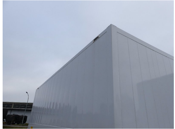
Bild 30: Karosserie Delle / Kratzer / Abschürfung - ohne Reparatur