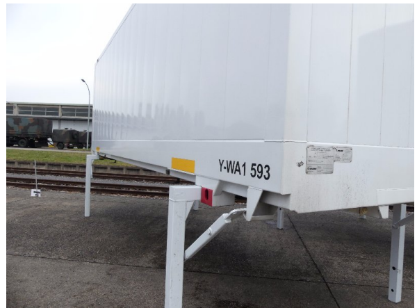
Bild 16: Abdichtung Frontwand, Seitenwand links und rechts beschädigt - erneuern