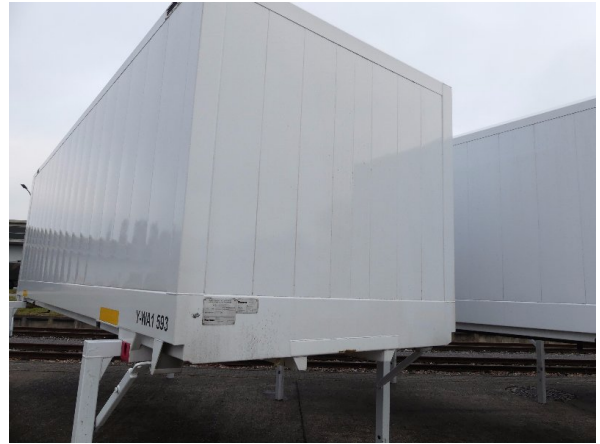
Bild 14: Abdichtung Frontwand, Seitenwand links und rechts beschädigt - erneuern