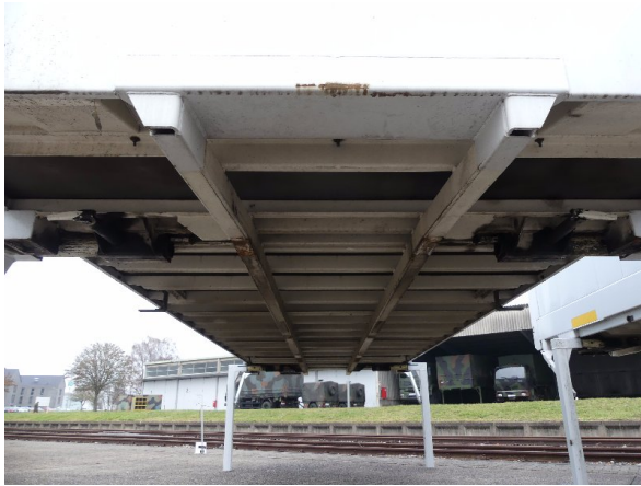
Bild 33: Karosserie Delle / Kratzer / Abschürfung- ohne Reparatur