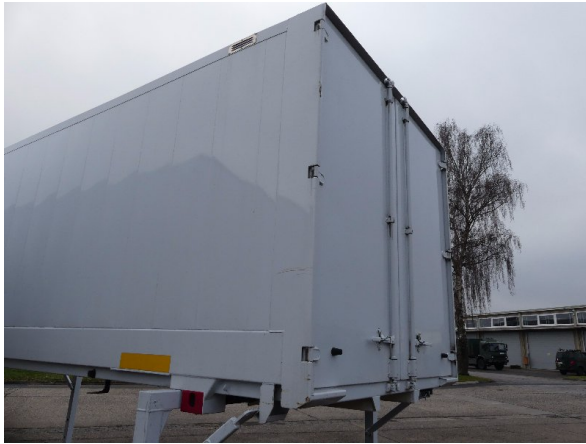
Bild 23: Eckbeplankung links Abschürfung - instandsetzen und lackieren