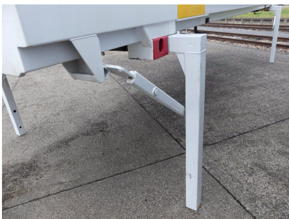
Bild 37: Karosserie Delle / Kratzer / Abschürfung- ohne Reparatur