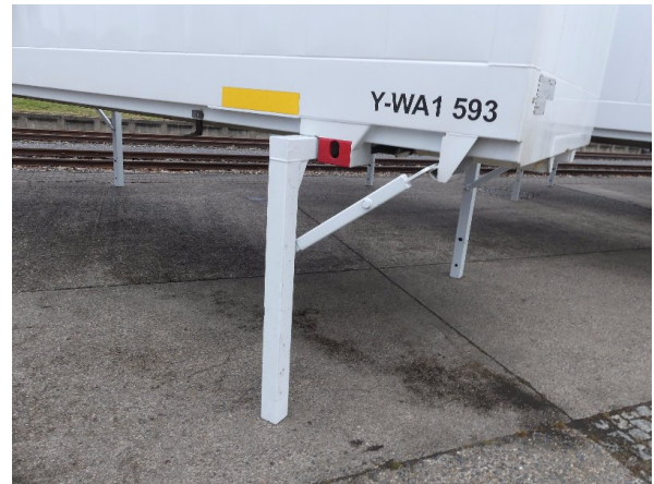
Bild 34: Karosserie Delle / Kratzer / Abschürfung- ohne Reparatur