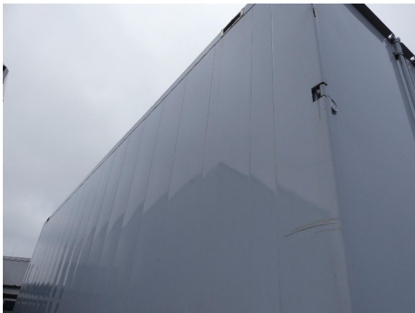
Bild 31: Karosserie Delle / Kratzer / Abschürfung- ohne Reparatur