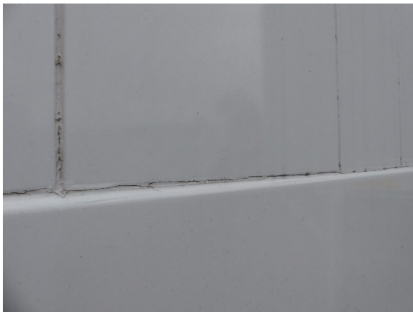
Bild 15: Abdichtung Frontwand, Seitenwand links und rechts beschädigt - erneuern