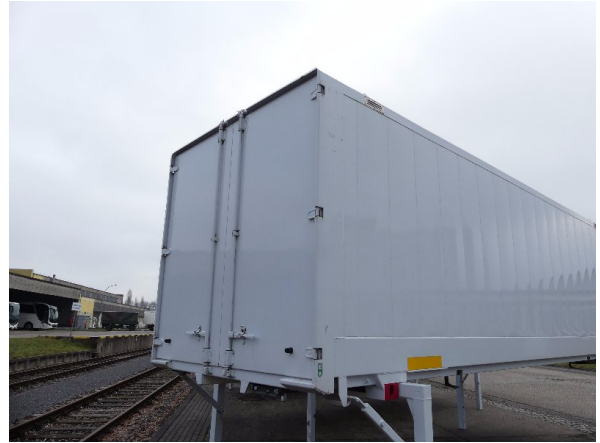
Bild 20: Eckbeplankung rechts Korrosion - instandsetzen und lackieren