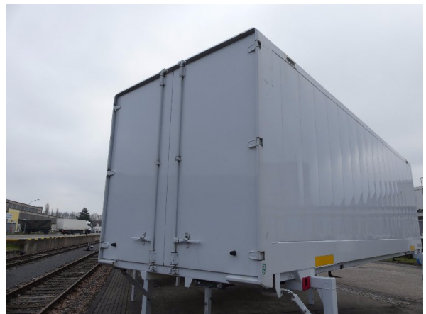
Bild 32: Karosserie Delle / Kratzer / Abschürfung- ohne Reparatur