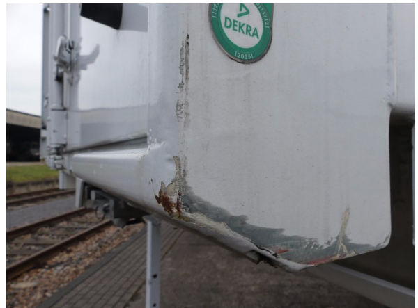
Bild 22: Eckbeplankung rechts Korrosion - instandsetzen und lackieren