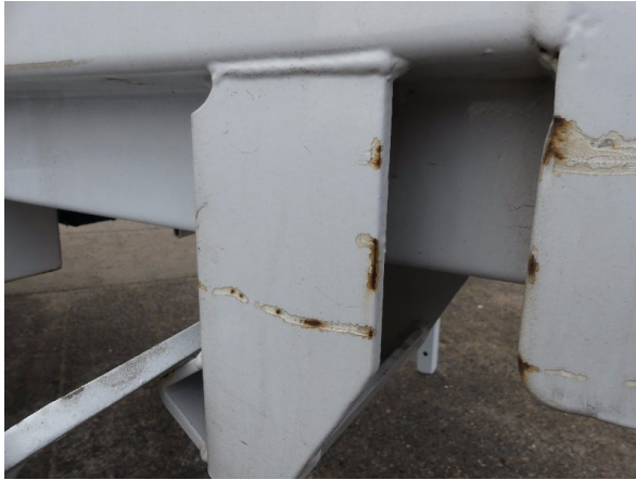
Bild 29: Aufnahme hinten links Korrosion - instandsetzen und lackieren