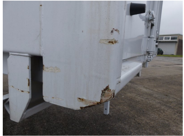
Bild 24: Eckbeplankung links Abschürfung - instandsetzen und lackieren