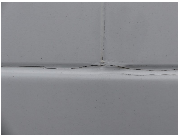
Bild 17: Abdichtung Frontwand, Seitenwand links und rechts beschädigt - erneuern