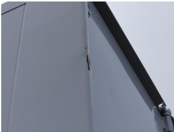
Bild 25: Eckbeplankung links Abschürfung - instandsetzen und lackieren