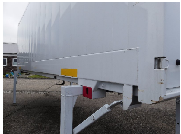
Bild 18: Abdichtung Frontwand, Seitenwand links und rechts beschädigt - erneuern