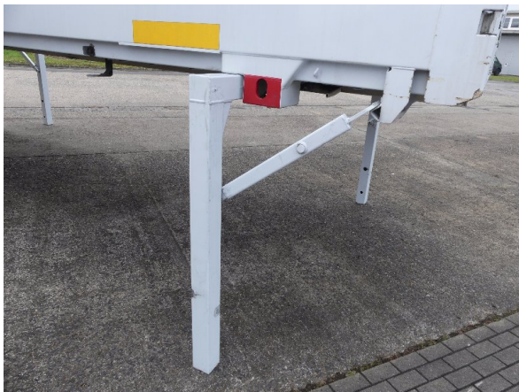
Bild 35: Karosserie Delle / Kratzer / Abschürfung- ohne Reparatur