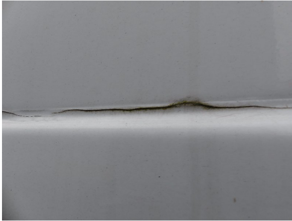
Bild 19: Abdichtung Frontwand, Seitenwand links und rechts beschädigt - erneuern