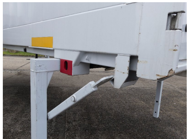
Bild 28: Aufnahme hinten links Korrosion - instandsetzen und lackieren