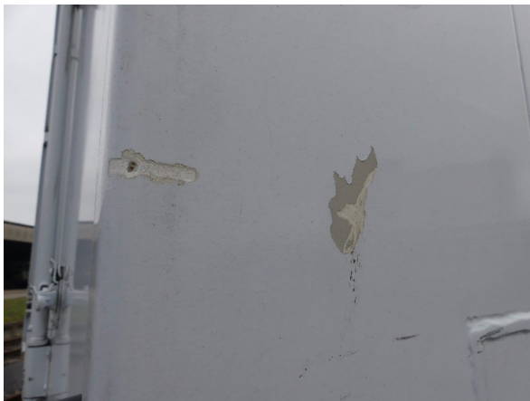
Bild 21: Eckbeplankung rechts Korrosion - instandsetzen und lackieren