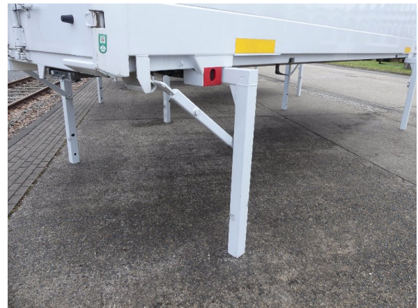
Bild 36: Karosserie Delle / Kratzer / Abschürfung- ohne Reparatur