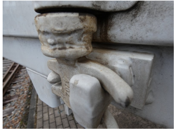
Bild 24: Heckbereich Kratzer/Korrosion - instandsetzen und lackieren