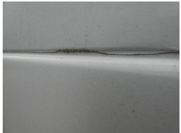
Bild 16: Seitenwand rechts und links Silikonnähte gerissen - erneuern