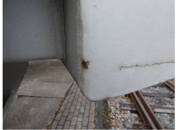
Bild 20: Seitenwand Kratzer/Korrosion - instandsetzen und lackieren