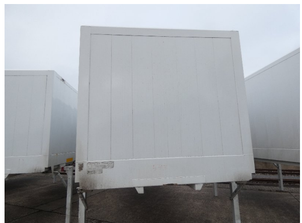
Bild 12: Frontbereich Kratzer/Korrosion - instandsetzen und lackieren