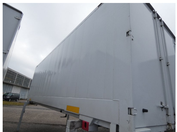
Bild 18: Seitenwand Kratzer/Korrosion - instandsetzen und lackieren