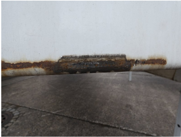
Bild 13: Frontbereich Kratzer/Korrosion - instandsetzen und lackieren