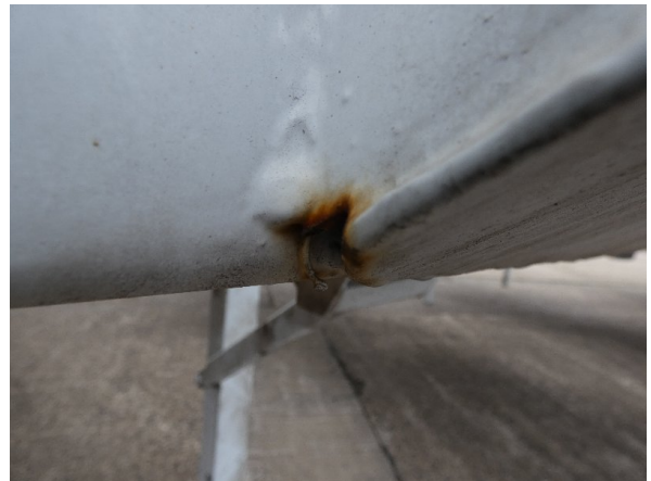
Bild 22: Heckbereich Kratzer/Korrosion - instandsetzen und lackieren