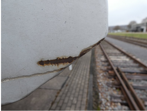
Bild 19: Seitenwand Kratzer/Korrosion - instandsetzen und lackieren