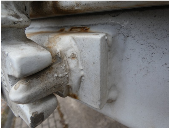
Bild 23: Heckbereich Kratzer/Korrosion - instandsetzen und lackieren