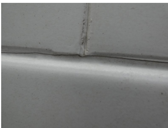
Bild 17: Seitenwand rechts und links Silikonnähte gerissen - erneuern