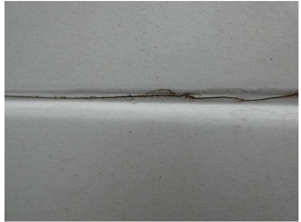
Bild 14: Seitenwand rechts und links Silikonnähte gerissen - erneuern