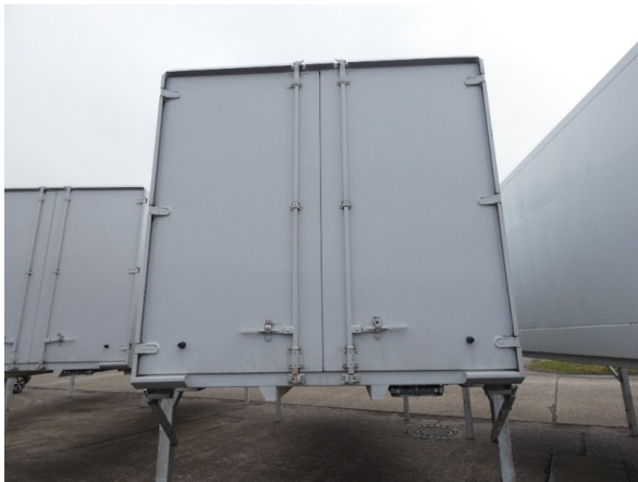
Bild 21: Heckbereich Kratzer/Korrosion - instandsetzen und lackieren