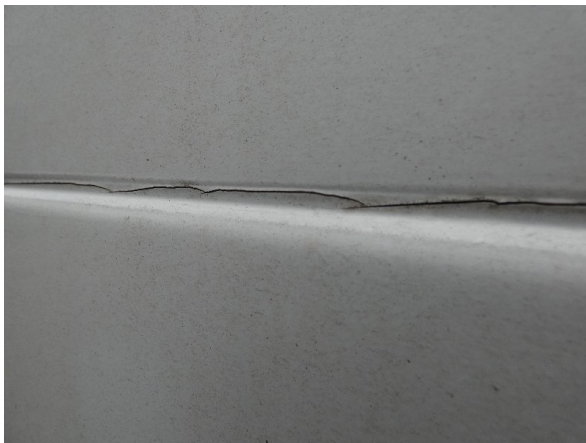
Bild 15: Seitenwand rechts und links Silikonnähte gerissen - erneuern