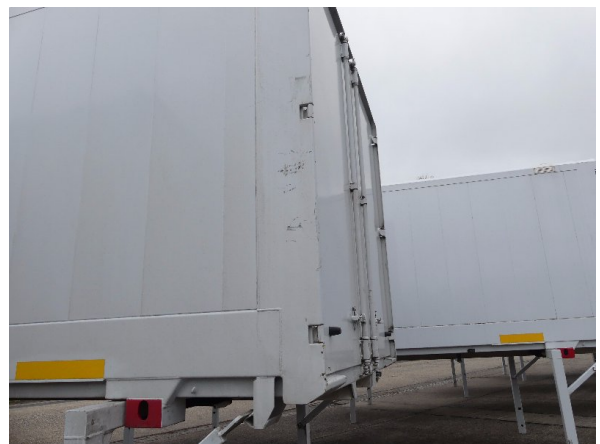
Bild 28: Eckbeplankung links Abschürfung - instandsetzen und lackieren