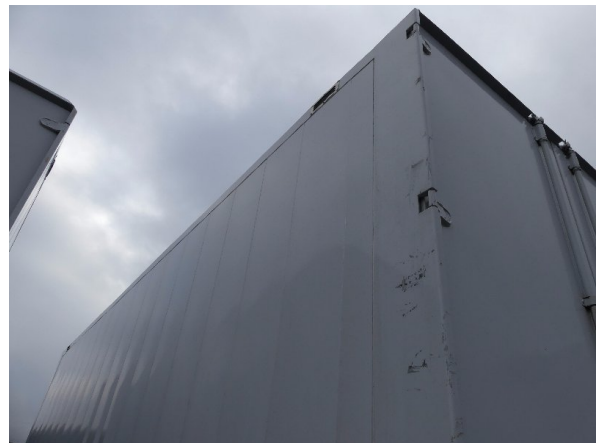
Bild 32: Karosserie Delle / Kratzer / Abschürfung- ohne Reparatur