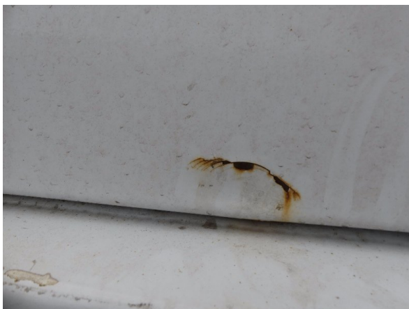
Bild 27: Tür hinten links Korrosion - instandsetzen und lackieren