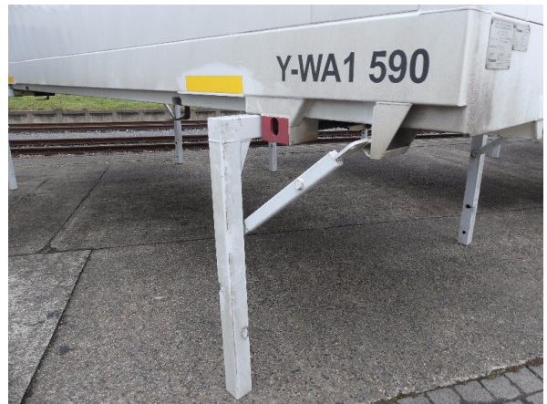
Bild 36: Karosserie Delle / Kratzer / Abschürfung- ohne Reparatur