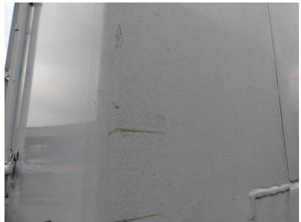
Bild 22: Eckbeplankung rechts Abschürfung - instandsetzen und lackieren