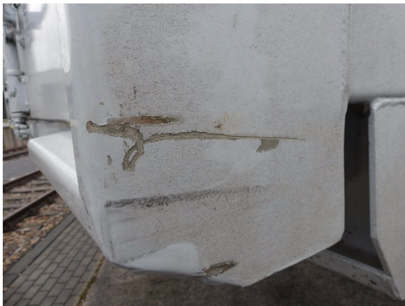
Bild 21: Eckbeplankung rechts Abschürfung - instandsetzen und lackieren