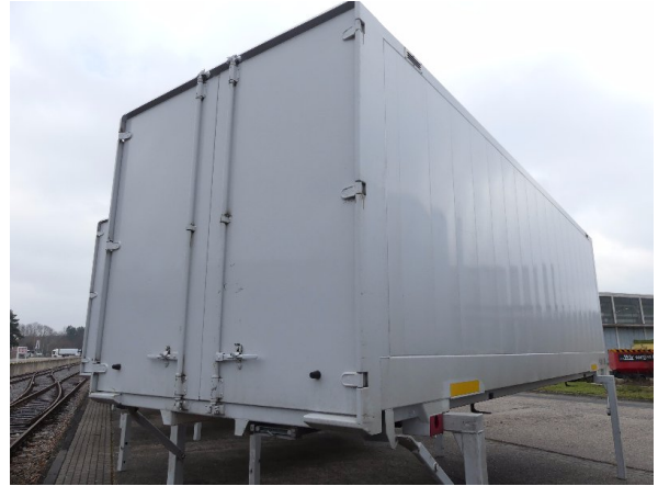
Bild 20: Eckbeplankung rechts Abschürfung - instandsetzen und lackieren