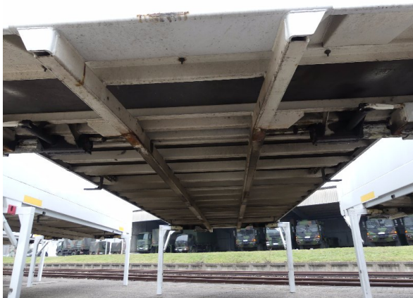
Bild 35: Karosserie Delle / Kratzer / Abschürfung- ohne Reparatur