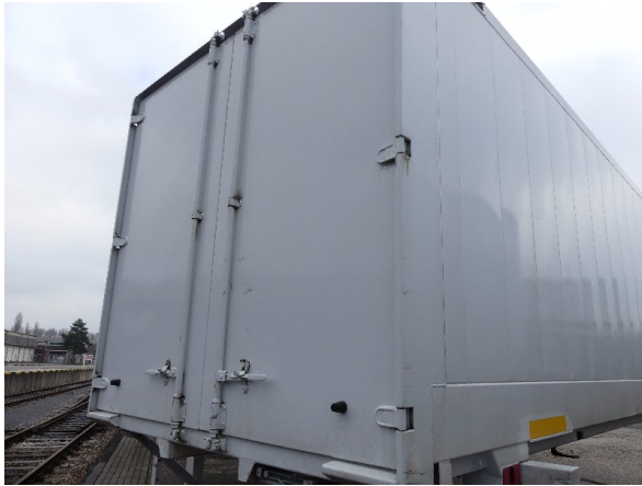
Bild 23: Tür hinten rechts Abschürfung - instandsetzen und lackieren