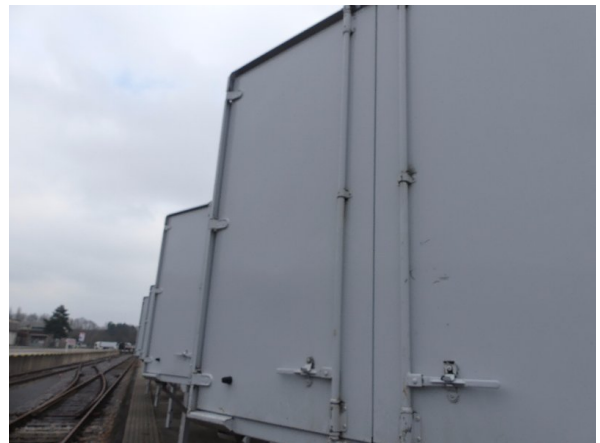
Bild 26: Tür hinten links Korrosion - instandsetzen und lackieren