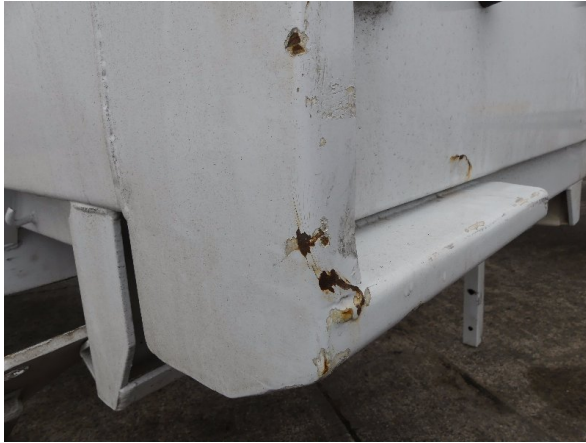
Bild 29: Eckbeplankung links Abschürfung - instandsetzen und lackieren