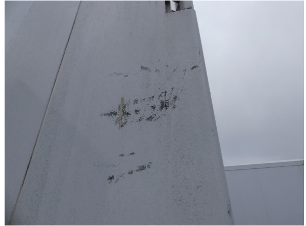
Bild 30: Eckbeplankung links Abschürfung - instandsetzen und lackieren