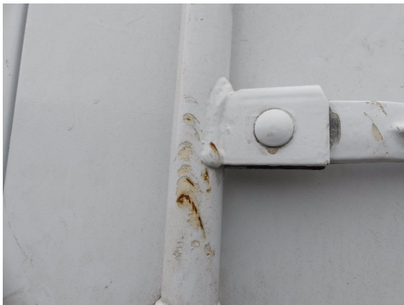
Bild 25: Tür hinten rechts Abschürfung - instandsetzen und lackieren