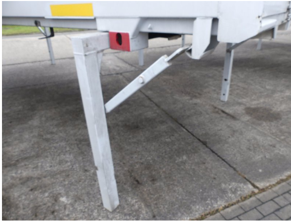
Bild 33: Karosserie Delle / Kratzer / Abschürfung- ohne Reparatur