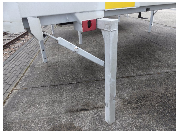
Bild 38: Karosserie Delle / Kratzer / Abschürfung- ohne Reparatur