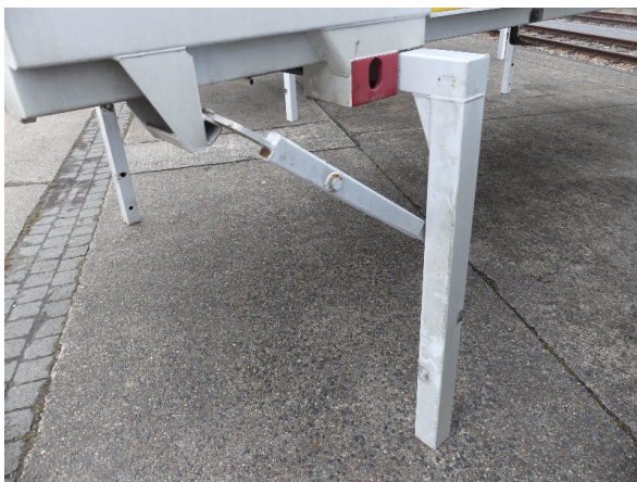
Bild 37: Karosserie Delle / Kratzer / Abschürfung- ohne Reparatur