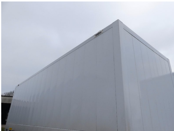
Bild 31: Karosserie Delle / Kratzer / Abschürfung - ohne Reparatur