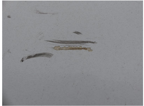
Bild 24: Tür hinten rechts Abschürfung - instandsetzen und lackieren