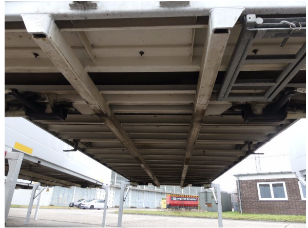
Bild 34: Karosserie Delle / Kratzer / Abschürfung- ohne Reparatur