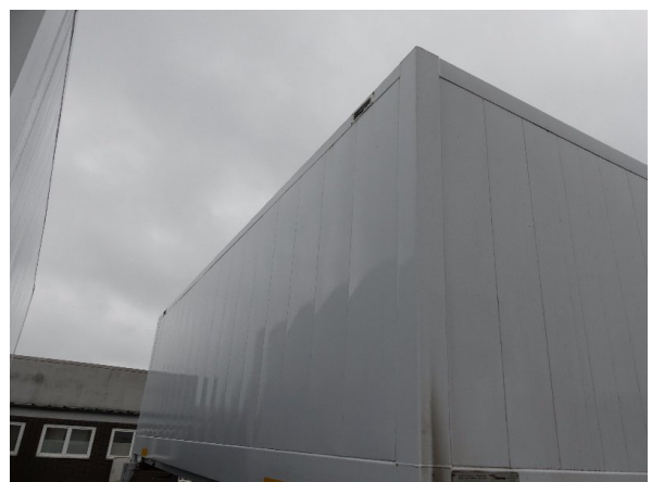
Bild 28: Profil vorne rechts Korrosion - instandsetzen und lackieren