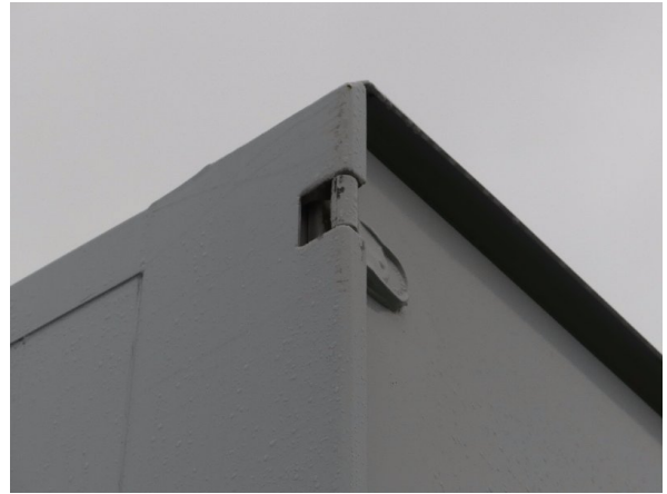
Bild 24: Eckbeplankung links Korrosion - instandsetzen und lackieren