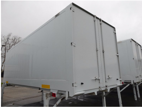
Bild 23: Eckbeplankung links Korrosion - instandsetzen und lackieren