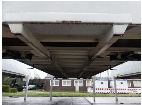
Bild 32: Karosserie Delle / Kratzer / Abschürfung - ohne Reparatur