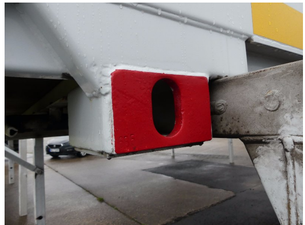
Bild 36: Karosserie Delle / Kratzer / Abschürfung - ohne Reparatur