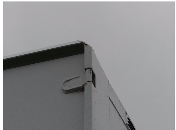
Bild 22: Eckbeplankung rechts Korrosion - instandsetzen und lackieren