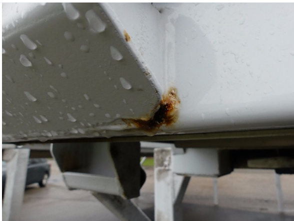
Bild 25: Eckbeplankung links Korrosion - instandsetzen und lackieren