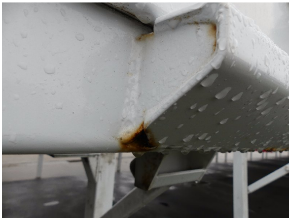
Bild 21: Eckbeplankung rechts Korrosion - instandsetzen und lackieren