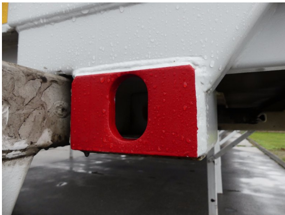
Bild 35: Karosserie Delle / Kratzer / Abschürfung - ohne Reparatur