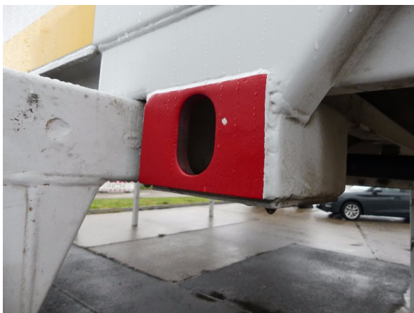
Bild 37: Karosserie Delle / Kratzer / Abschürfung - ohne Reparatur