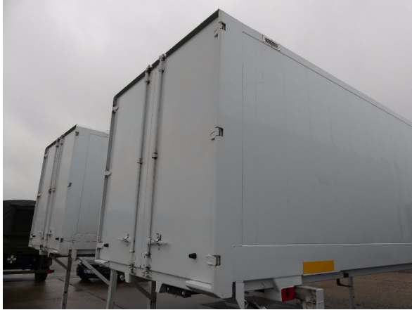
Bild 19: Eckbeplankung rechts Korrosion - instandsetzen und lackieren