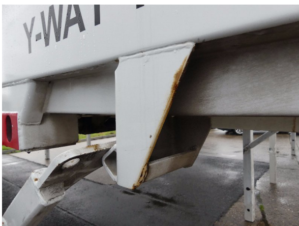
Bild 27: Halterung Stütze vorne rechts Korrosion - instandsetzen und lackieren