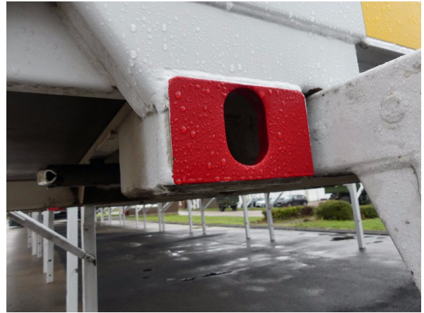
Bild 34: Karosserie Delle / Kratzer / Abschürfung - ohne Reparatur