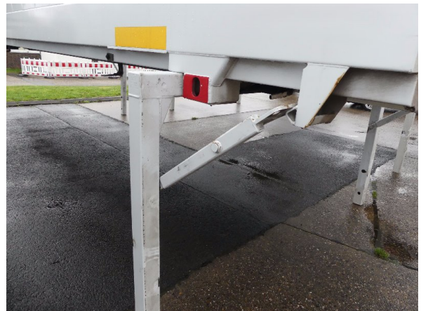
Bild 26: Halterung Stütze vorne rechts Korrosion - instandsetzen und lackieren