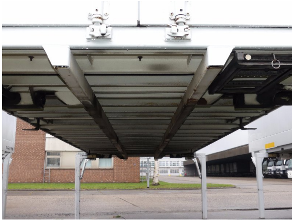
Bild 33: Karosserie Delle / Kratzer / Abschürfung - ohne Reparatur