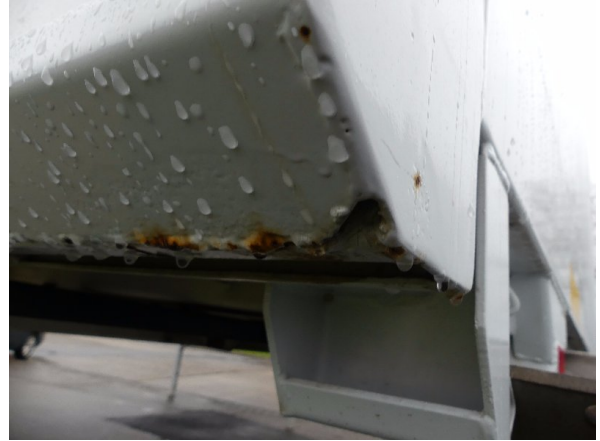
Bild 20: Eckbeplankung rechts Korrosion - instandsetzen und lackieren