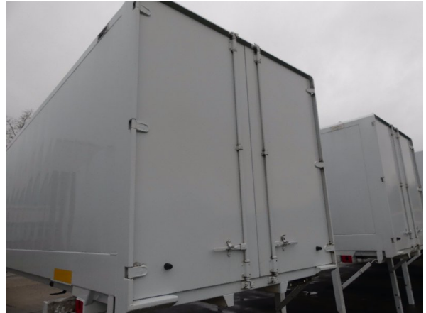
Bild 30: Karosserie Delle / Kratzer / Abschürfung - ohne Reparatur