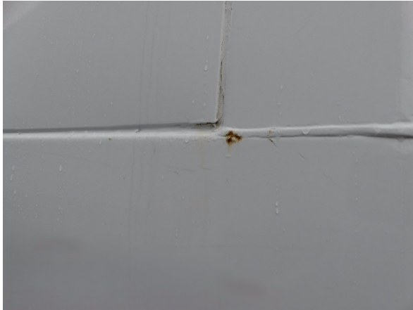
Bild 29: Profil vorne rechts Korrosion - instandsetzen und lackieren