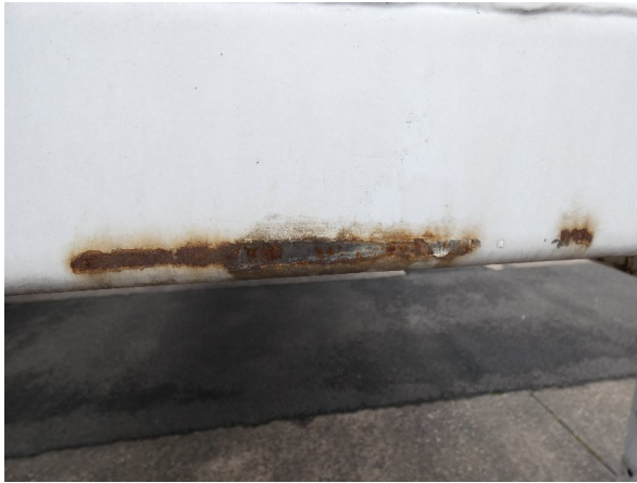
Bild 13: Frontbereich Kratzer/Korrosion - instandsetzen und lackieren