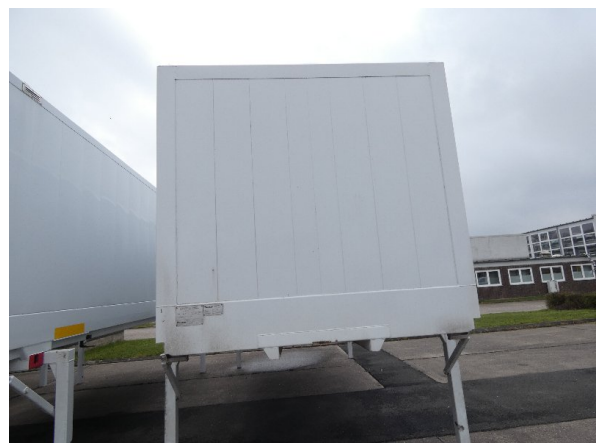
Bild 12: Frontbereich Kratzer/Korrosion - instandsetzen und lackieren