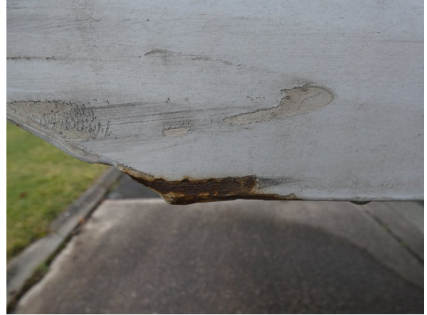
Bild 20: Seitenwand Kratzer/Korrosion - instandsetzen und lackieren