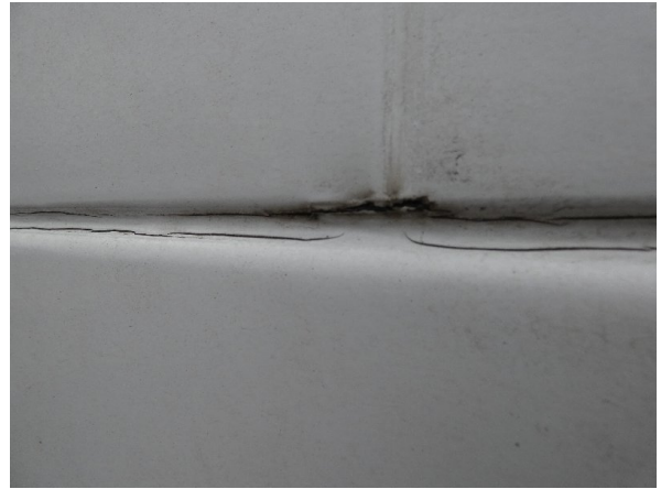
Bild 24: Seitenwand Kratzer/Korrosion - instandsetzen und lackieren