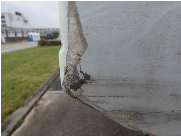
Bild 21: Seitenwand Kratzer/Korrosion - instandsetzen und lackieren