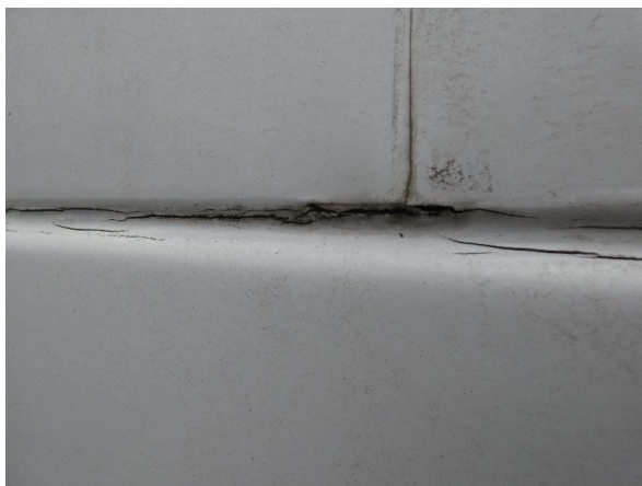
Bild 27: Seitenwand rechts und links Silikonnahte gerissen - erneuern