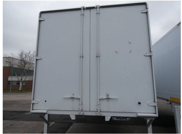
Bild 14: Heckbereich Kratzer/Korrosion - instandsetzen und lackieren