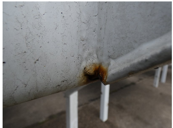
Bild 16: Heckbereich Kratzer/Korrosion - instandsetzen und lackieren