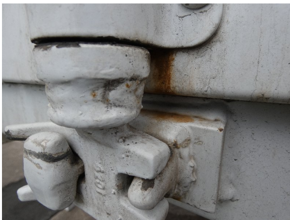
Bild 17: Heckbereich Kratzer/Korrosion - instandsetzen und lackieren