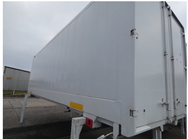
Bild 22: Seitenwand Kratzer/Korrosion - instandsetzen und lackieren