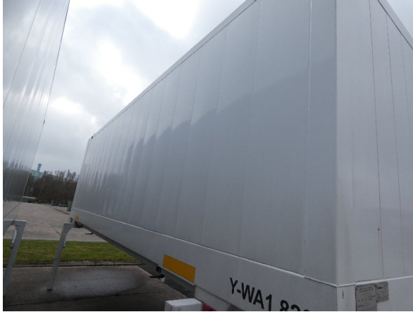
Bild 19: Seitenwand Kratzer/Korrosion - instandsetzen und lackieren