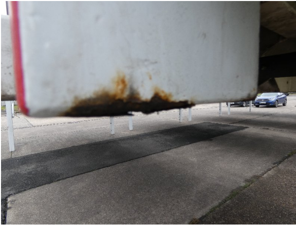
Bild 23: Seitenwand Kratzer/Korrosion - instandsetzen und lackieren