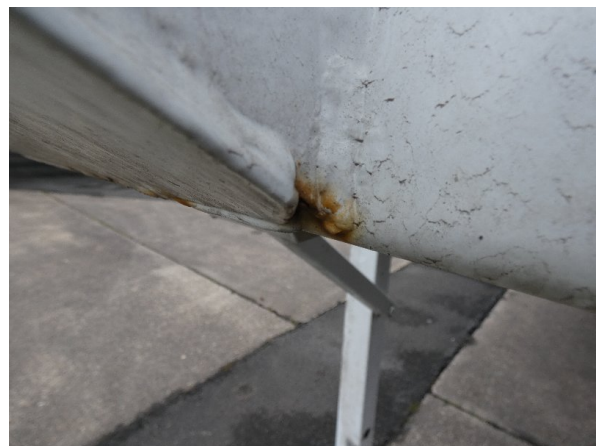
Bild 18: Heckbereich Kratzer/Korrosion - instandsetzen und lackieren