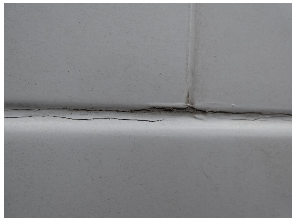
Bild 28: Seitenwand rechts und links Silikonnahte gerissen - erneuern