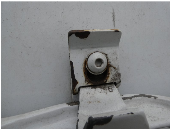
Bild 15: Heckbereich Kratzer/Korrosion - instandsetzen und lackieren