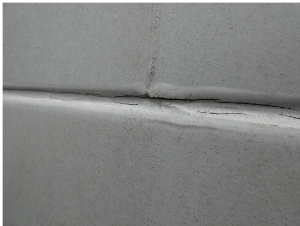
Bild 25: Seitenwand rechts und links Silikonnahte gerissen - erneuern