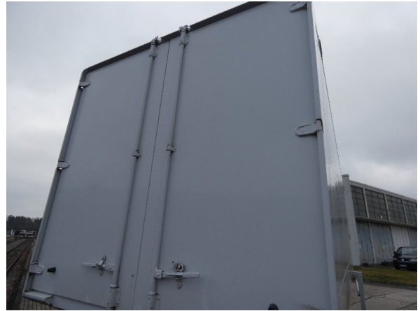
Bild 14: Heckbereich Kratzer/Korrosion - instandsetzen und lackieren