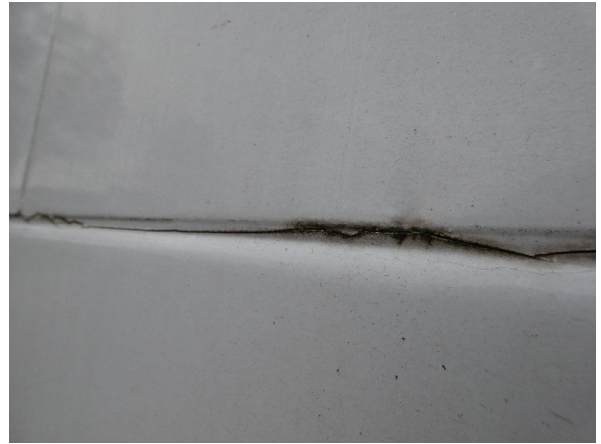
Bild 24: Seitenwand rechts und links Silikonnähte gerissen - erneuern