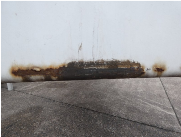
Bild 13: Frontbereich Kratzer/Korrosion - instandsetzen und lackieren