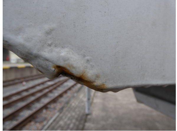
Bild 20: Seitenwand Kratzer/Korrosion - instandsetzen und lackieren