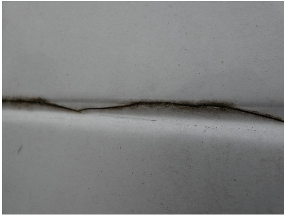
Bild 23: Seitenwand rechts und links Silikonnähte gerissen - erneuern