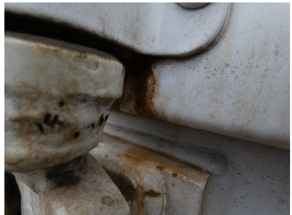
Bild 16: Heckbereich Kratzer/Korrosion - instandsetzen und lackieren