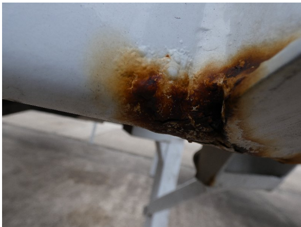
Bild 15: Heckbereich Kratzer/Korrosion - instandsetzen und lackieren