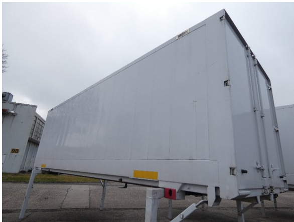
Bild 21: Seitenwand Kratzer/Korrosion - instandsetzen und lackieren