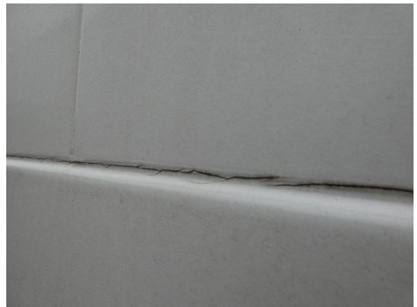
Bild 26: Seitenwand rechts und links Silikonnähte gerissen - erneuern