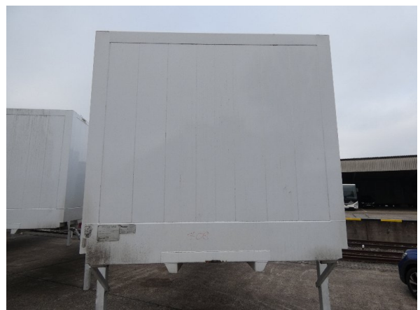
Bild 12: Frontbereich Kratzer/Korrosion - instandsetzen und lackieren