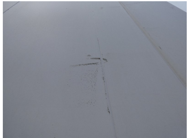
Bild 22: Seitenwand Kratzer/Korrosion - instandsetzen und lackieren