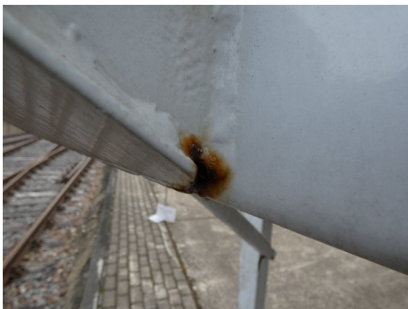
Bild 17: Heckbereich Kratzer/Korrosion - instandsetzen und lackieren