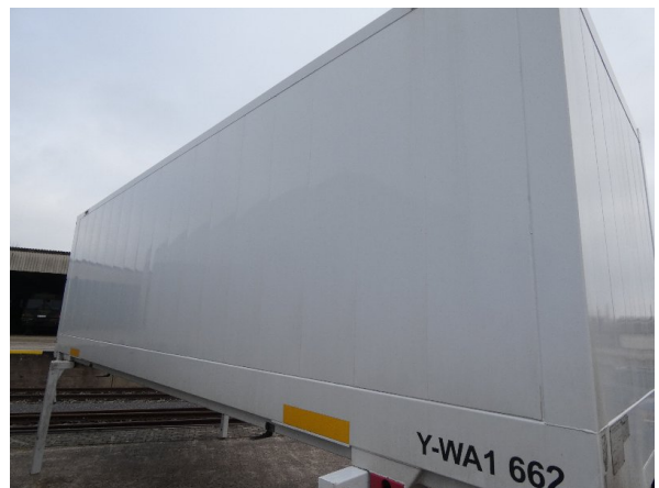
Bild 18: Seitenwand Kratzer/Korrosion - instandsetzen und lackieren