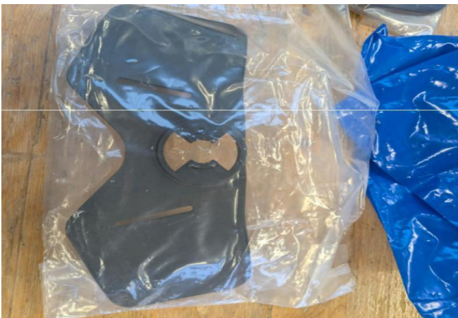
Drehplatte / Beckenplatte / Rückenplatte PSS 100 Dräger / Artikelnummer Dräger: 3338207