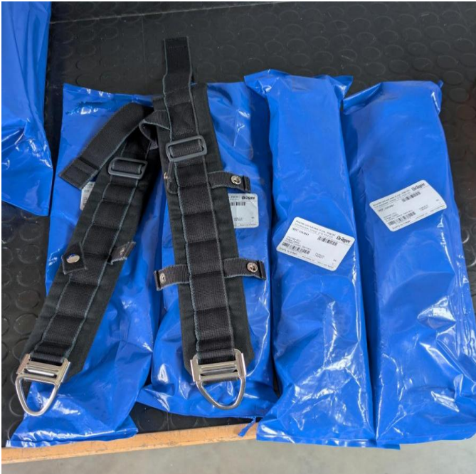
Schulterpolster Dräger PSS 100 á 2 Stück / Artikelnummer Dräger: 3353081