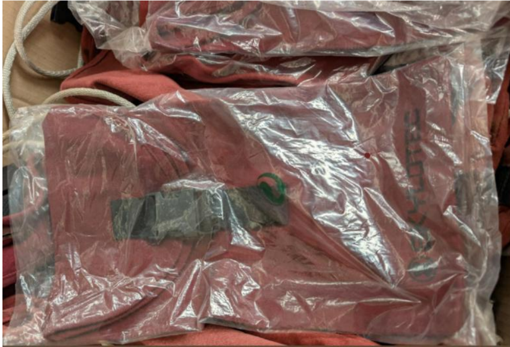
Trageleine zum Umhängen der Mehrzweckkleinenbeutel