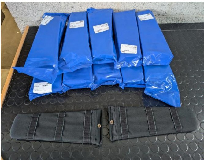
Hüftpolster Dräger PSS 100 á 2 Stück / Artikelnummer Dräger: 3351275