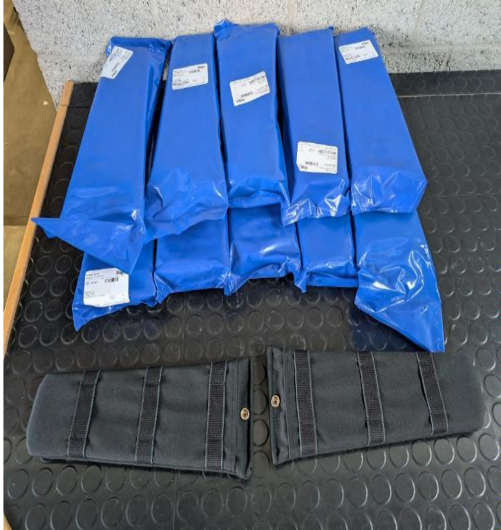
Hüftpolster Dräger PSS 100 á 2 Stück Artikelnummer Dräger: 3351275