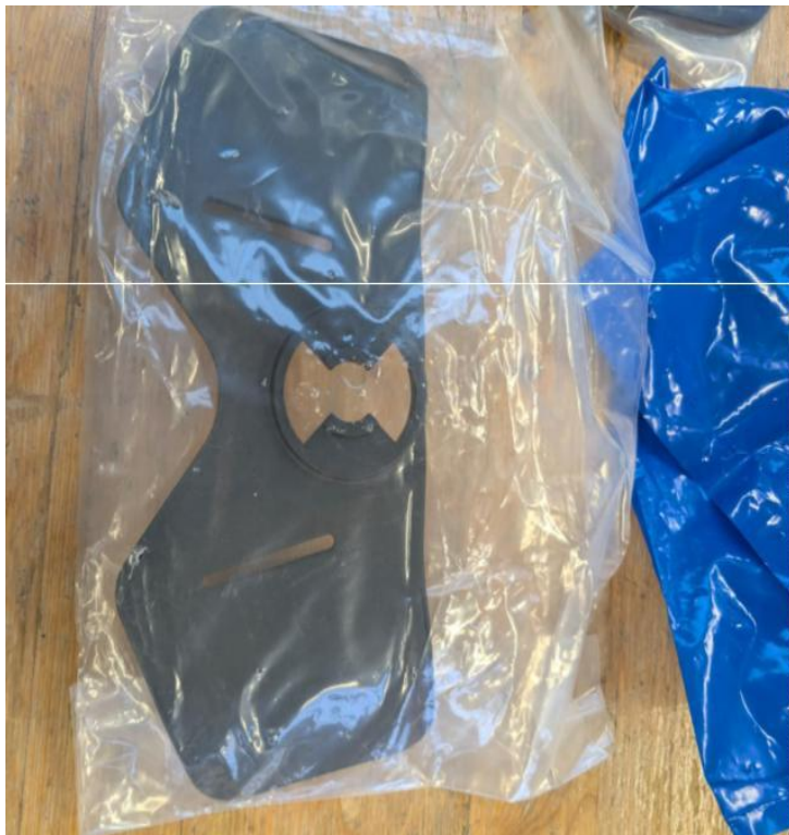
Drehplatte / Beckenplatte Rückenplatte PSS 100 Dräger Artikelnummer Dräger: 3338207