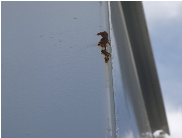
Bild 21: Eckbeplankung links Korrosion - instandsetzen und lackieren