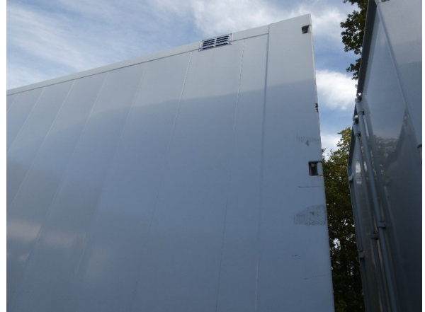
Bild 20: Eckbeplankung links Korrosion - instandsetzen und lackieren