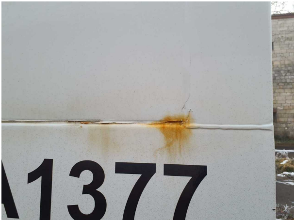
Beschädigung 1: Aufbau: Aufbau - Korrosion - instandsetzen und lackieren