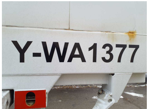
Abbildung 4: Kombiinstrument