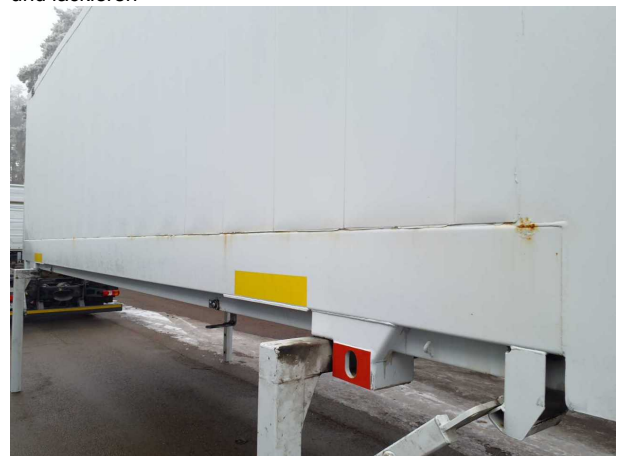
Beschädigung 1: Aufbau: Aufbau - Korrosion - instandsetzen und lackieren