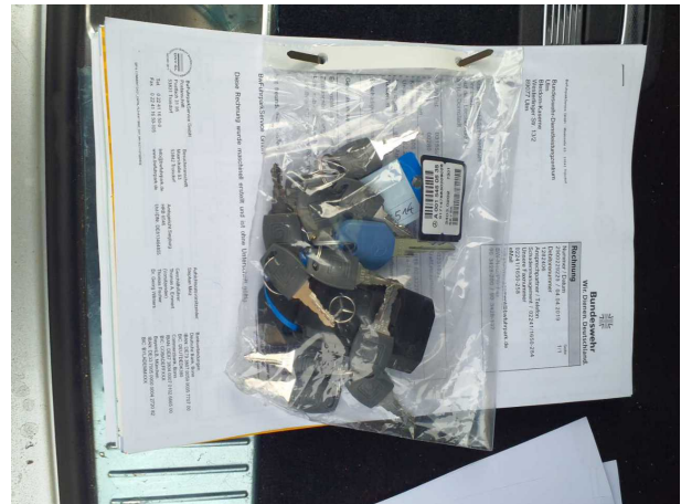
Abbildung 6: Dokumente