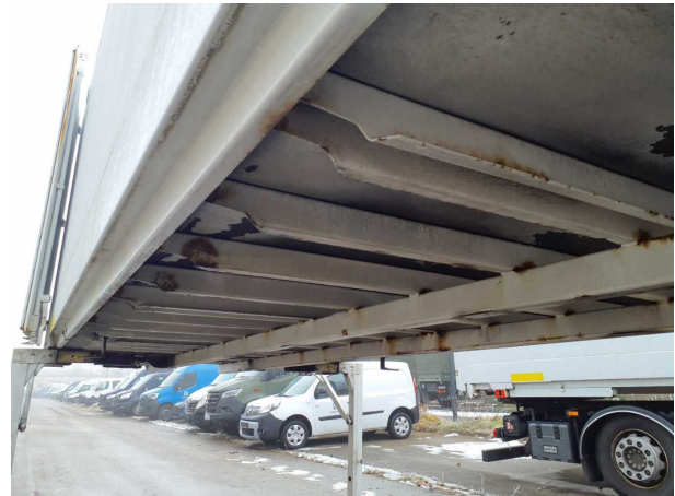
Beschädigung 1: Aufbau: Aufbau - Korrosion - instandsetzen und lackieren