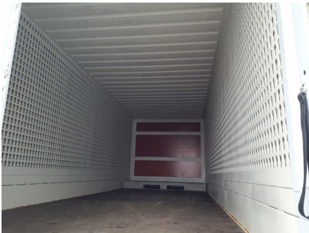
Abbildung 3: Innenraum