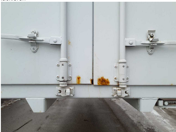
Beschädigung 1: Aufbau: Aufbau - Korrosion - instandsetzen und lackieren