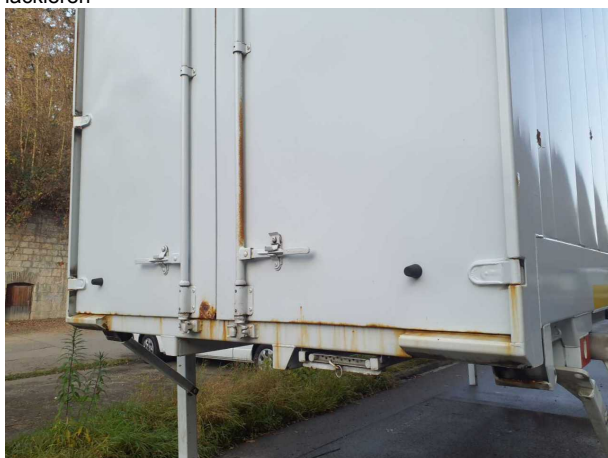
Beschädigung 1: Aufbau: Aufbau - Korrosion - instandsetzen und lackieren