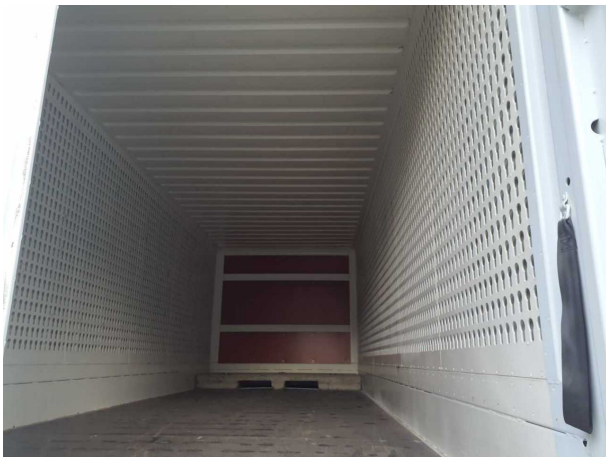
Abbildung 3: Innenraum