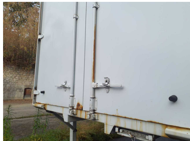
Beschädigung 1: Aufbau: Aufbau - Korrosion - instandsetzen und lackieren