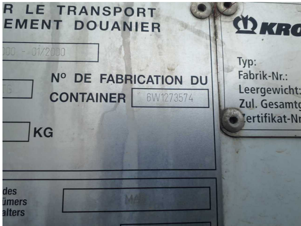
Abbildung 5: FIN