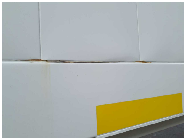
Beschädigung 1: Aufbau: Aufbau - Korrosion - instandsetzen und lackieren