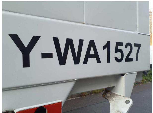
Abbildung 4: Kombiinstrument