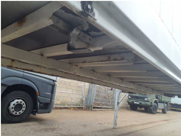
Beschädigung 1: Aufbau: Aufbau - Korrosion - instandsetzen und lackieren