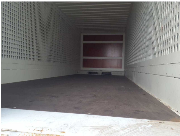
Abbildung 3: Innenraum