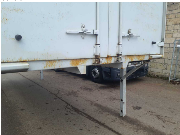
Beschädigung 1: Aufbau: Aufbau - Korrosion - instandsetzen und lackieren