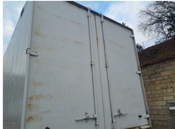
Beschädigung 1: Aufbau: Aufbau - Korrosion - instandsetzen und lackieren