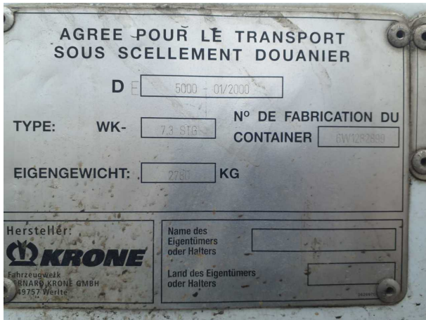
Abbildung 5: FIN