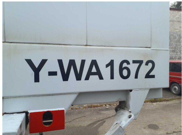
Abbildung 4: Kombiinstrument