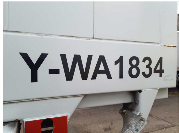
Abbildung 4: Kombiinstrument