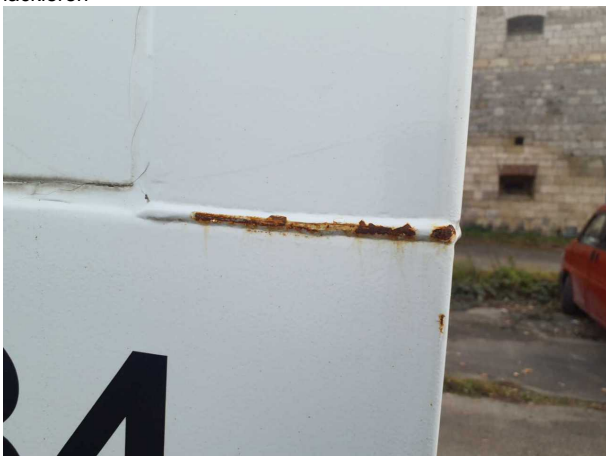
Beschädigung 1: Aufbau: Aufbau - Korrosion - instandsetzen und lackieren