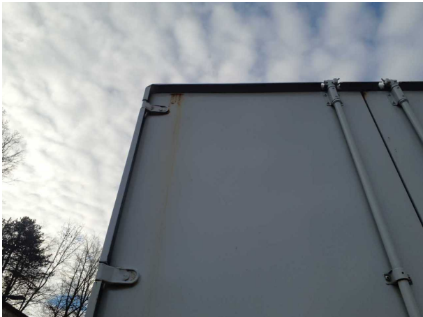
Beschädigung 1: Aufbau: Aufbau - Korrosion - instandsetzen und lackieren