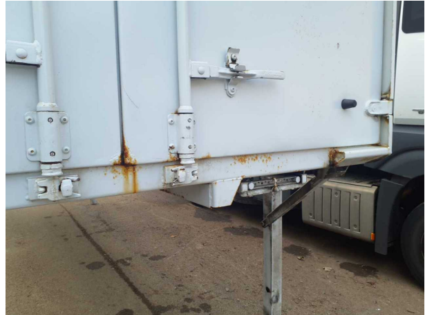
Beschädigung 1: Aufbau: Aufbau - Korrosion - instandsetzen und lackieren