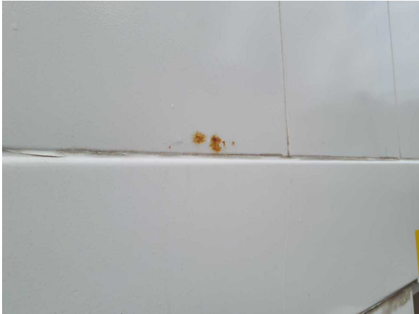
Beschädigung 1: Aufbau: Aufbau - Korrosion - instandsetzen und lackieren