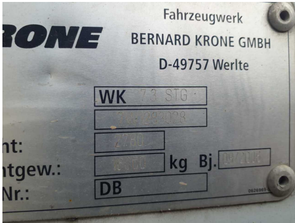
Abbildung 5: FIN