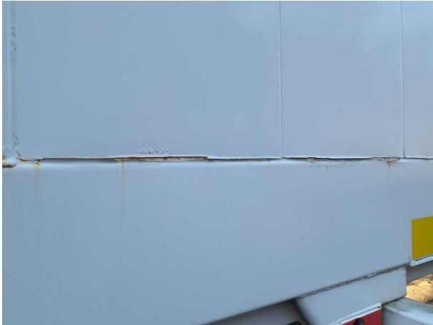
Beschädigung 1: Aufbau: Aufbau - Korrosion - instandsetzen und lackieren