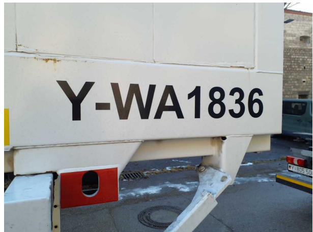
Abbildung 4: Kombiinstrument