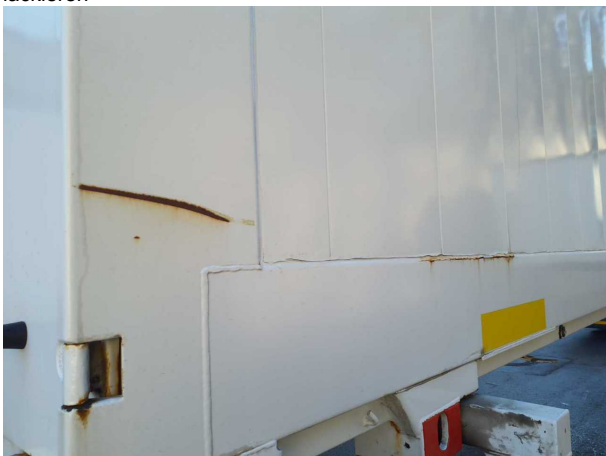
Beschädigung 1: Aufbau: Aufbau - Korrosion - instandsetzen und lackieren