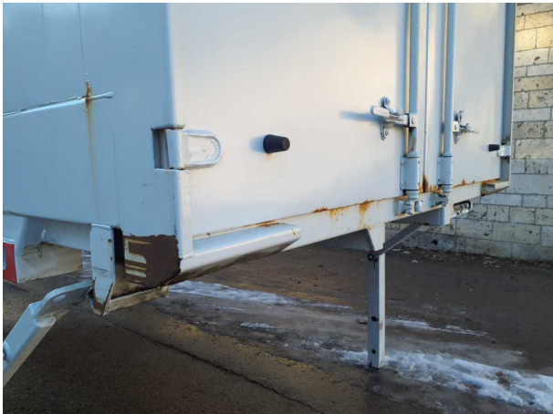
Beschädigung 1: Aufbau: Aufbau - Korrosion - instandsetzen und lackieren