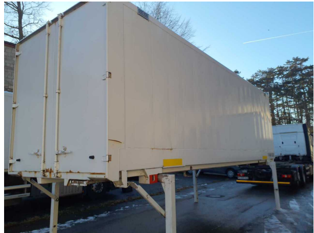
Abbildung 2: Schräg hinten