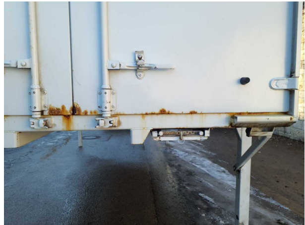
Beschädigung 1: Aufbau: Aufbau - Korrosion - instandsetzen und lackieren