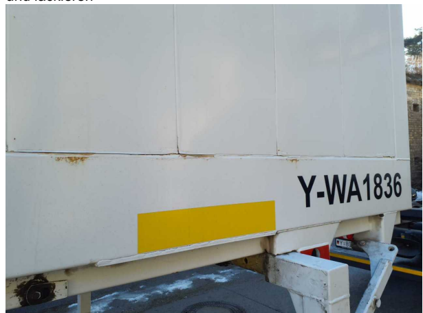
Beschädigung 1: Aufbau: Aufbau - Korrosion - instandsetzen und lackieren