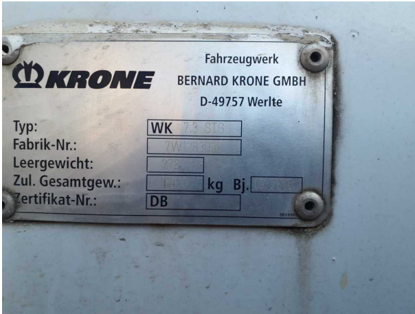
Abbildung 5: FIN