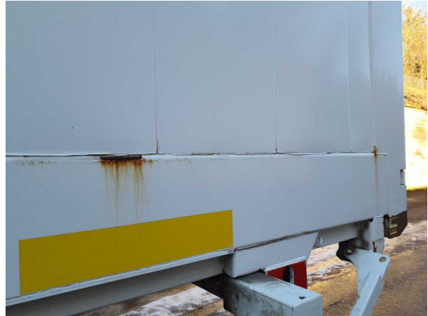
Beschädigung 1: Aufbau: Aufbau - Korrosion - instandsetzen und lackieren