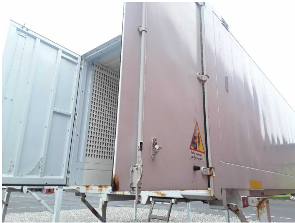
Beschädigung 4: Heckklappe/-tür: Hecktür rechts - Korrosion - instandsetzen und lackieren