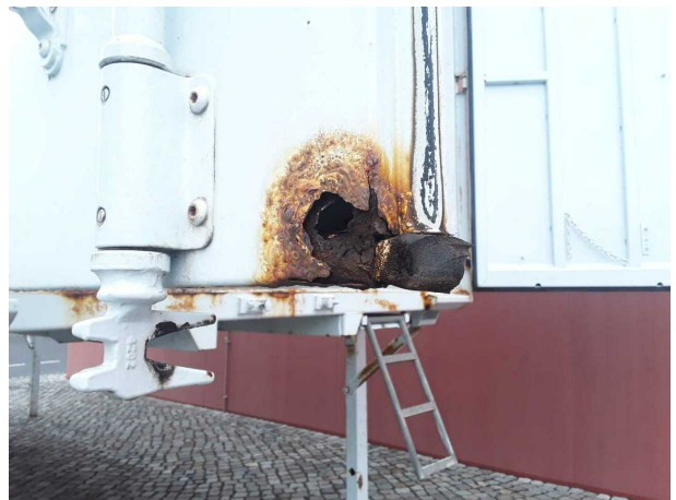
Beschädigung 3: Heckklappe/-tür: Hecktür links - Korrosion - instandsetzen und lackieren