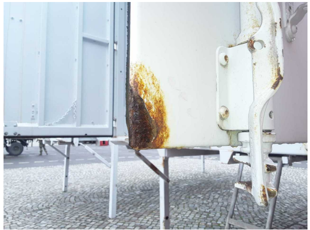
Beschädigung 4: Heckklappe/-tür: Hecktür rechts - Korrosio... instandsetzen und lackieren