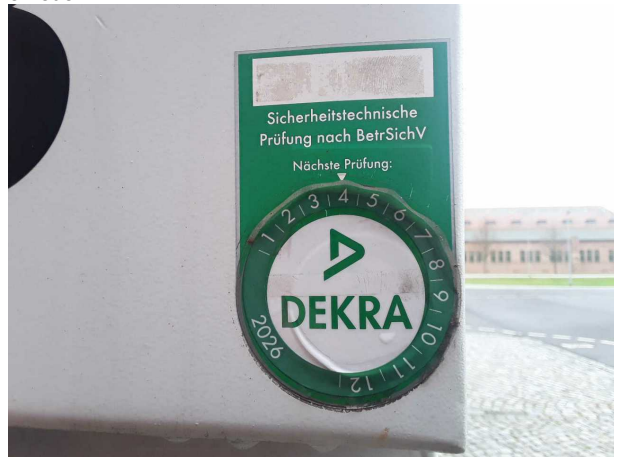
Beschädigung 2: Sonstiges: UVV Aufbau - fällig - erneuern