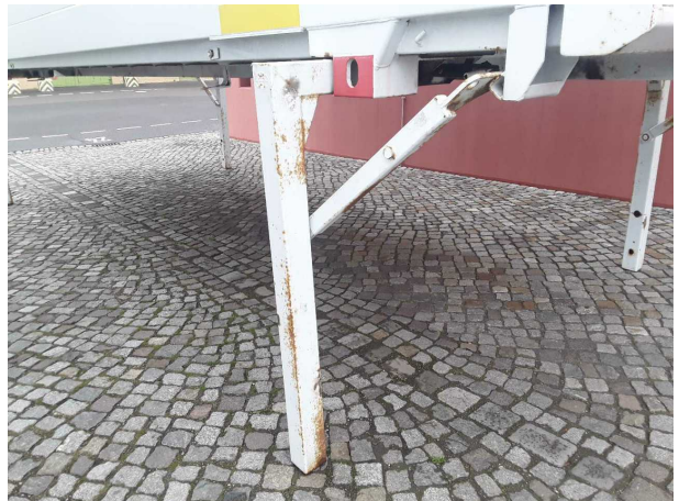
Gebrauchsspur 1: Sonstiges: Sonstiges - Korrosion