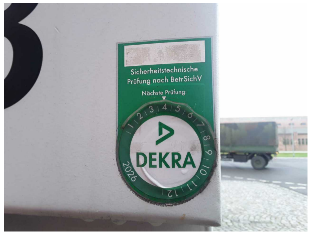
Abbildung 6: Dokumente