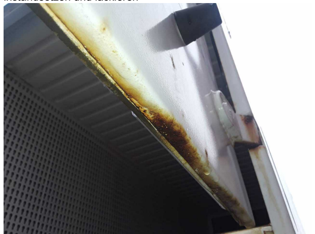
Beschädigung 4: Heckklappe/-tür: Hecktür rechts - Korrosio... instandsetzen und lackieren