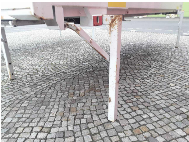
Gebrauchsspur 1: Sonstiges: Sonstiges - Korrosion