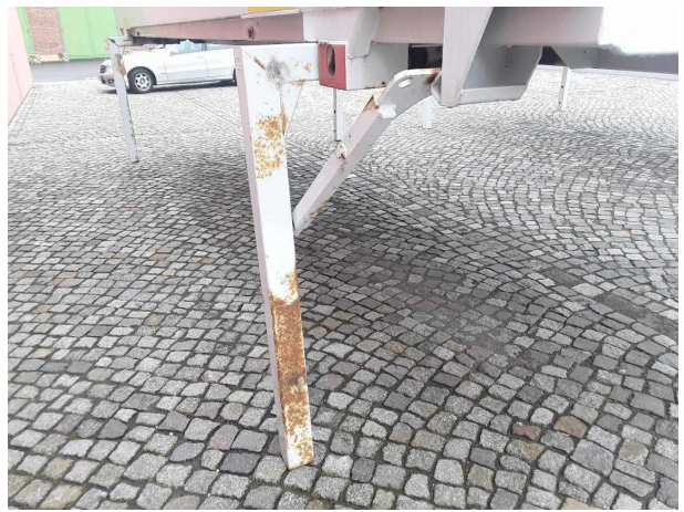
Gebrauchsspur 1: Sonstiges: Sonstiges - Korrosion