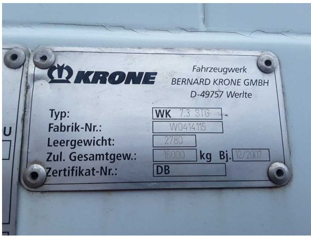
Abbildung 5: FIN