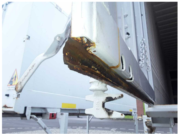
Beschädigung 3: Heckklappe/-tür: Hecktür links - Korrosion - instandsetzen und lackieren