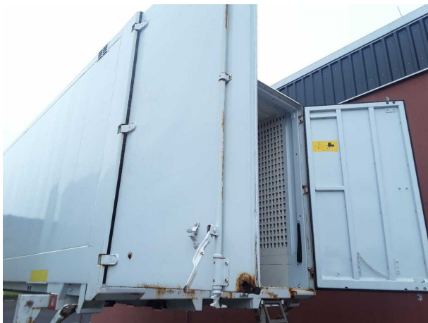
Beschädigung 3: Heckklappe/-tür: Hecktür links - Korrosion - instandsetzen und lackieren