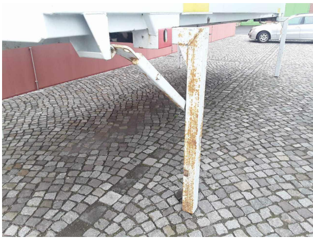
Gebrauchsspur 1: Sonstiges: Sonstiges - Korrosion