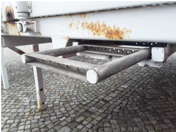
Beschädigung 1: Ausrüstung: Leiter (Sicherheit fehlt) - erneuern