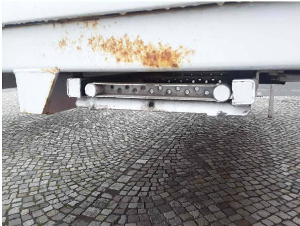
Beschädigung 1: Ausrüstung: Leiter (Sicherheit fehlt) - erneuern