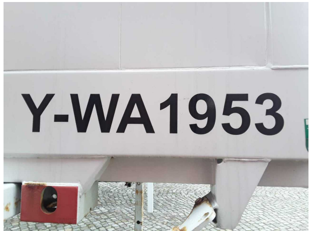
Abbildung 4: Kombiinstrument