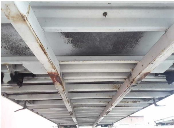
Gebrauchsspur 1: Sonstiges: Sonstiges - Korrosion