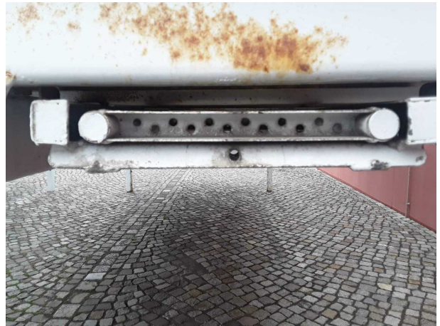
Beschädigung 1: Ausrüstung: Leiter (Sicherheit fehlt) - erneuern