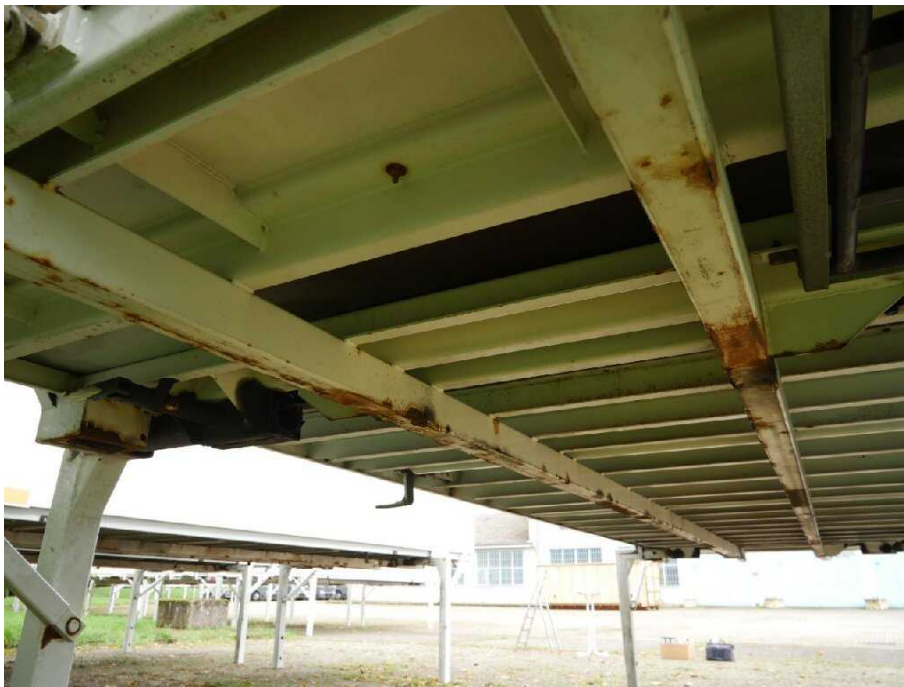
Bild 13 Fahrzeugfront Längsträger links und rechts korrodiert