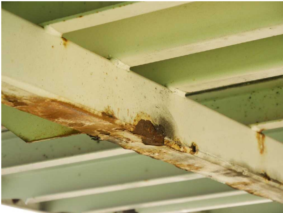
Bild 14 Fahrzeugfront Längsträger links und rechts korrodiert