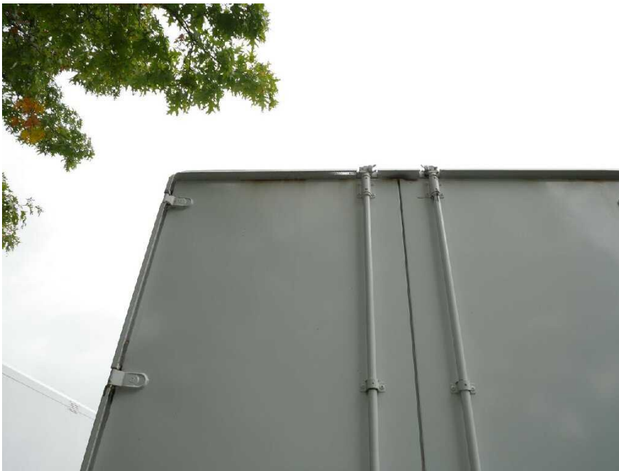
Bild 11 linke Seite Tür hinten links korrodiert