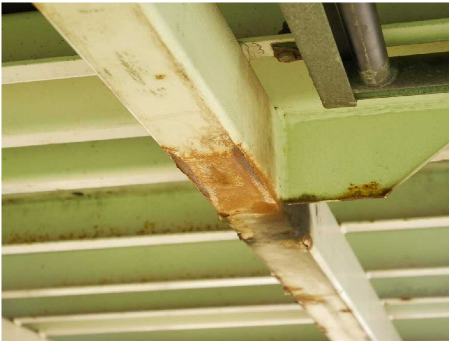
Bild 15 Fahrzeugfront Längsträger links und rechts korrodiert