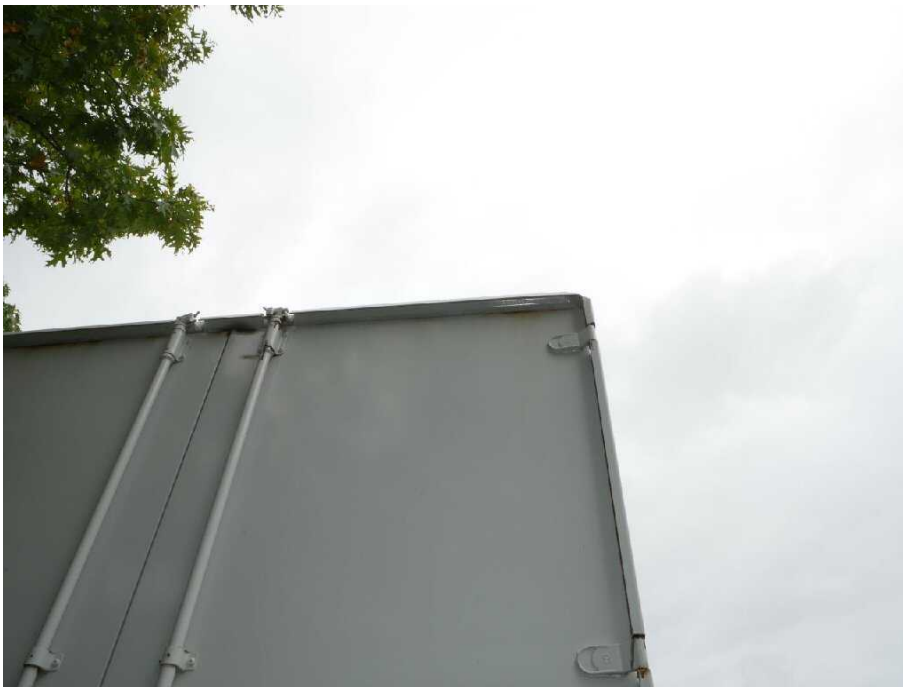
Bild 9 rechte Seite Tür hinten rechts korrodiert