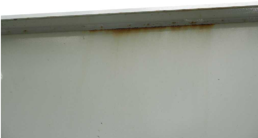
Bild 12 linke Seite Tür hinten links korrodiert