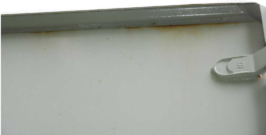
Bild 10 rechte Seite Tür hinten rechts korrodiert