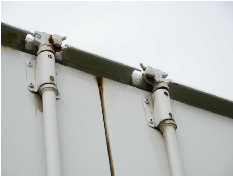
Bild 14 Fahrzeugheck Tür hinten rechts korrodiert