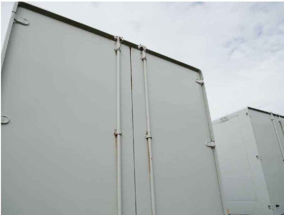
Bild 13 Fahrzeugheck Tür hinten rechts korrodiert