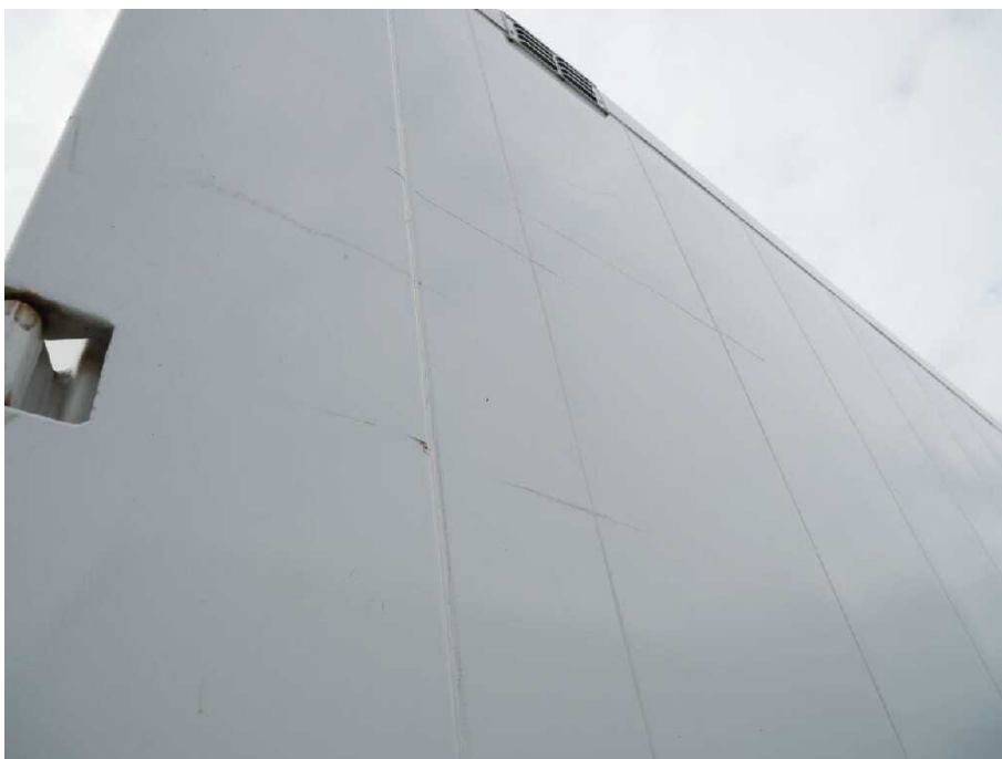
Bild 12 rechte Seite Seitenwand rechts verkratzt