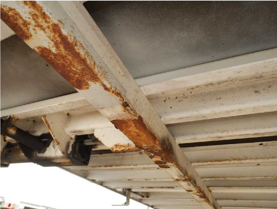
Bild 16 Fahrzeugfront Längsträger links und rechts korrodiert