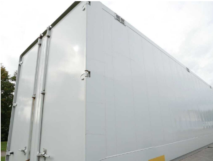
Bild 9 rechte Seite Seitenwand rechts verkratzt