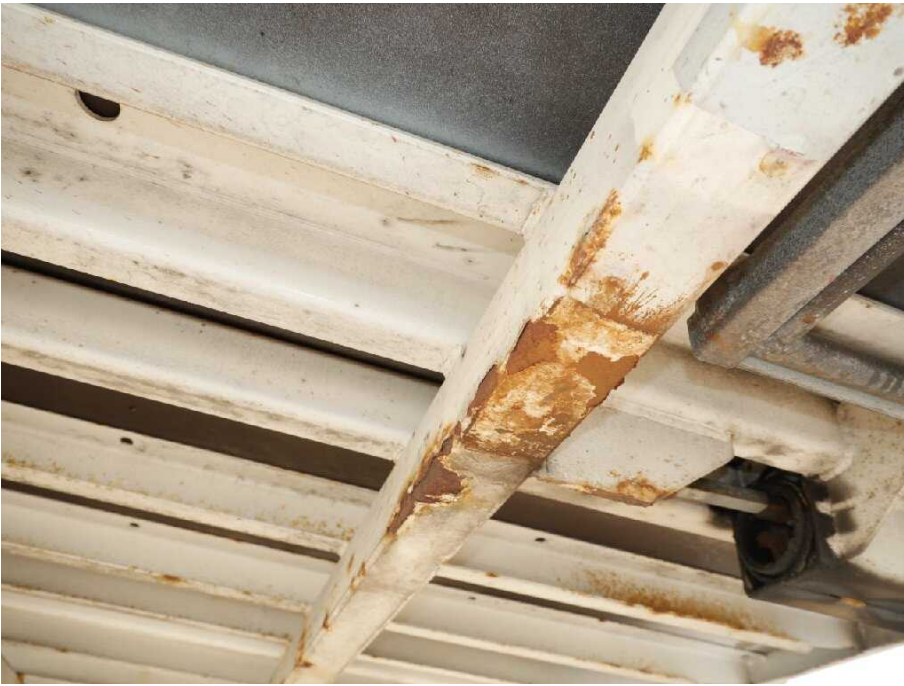
Bild 15 Fahrzeugfront Längsträger links und rechts korrodiert