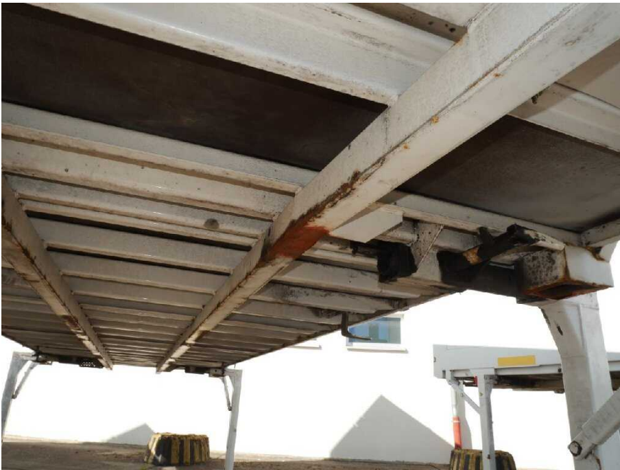
Bild 9 Fahrzeugfront Längsträger links und rechts korrodiert