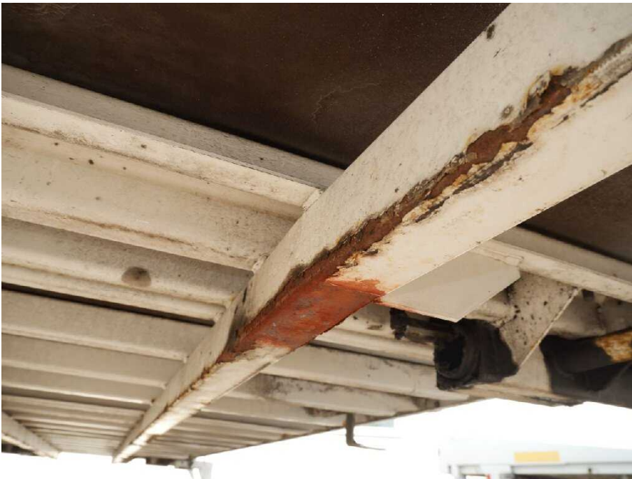
Bild 10 Fahrzeugfront Längsträger links und rechts korrodiert