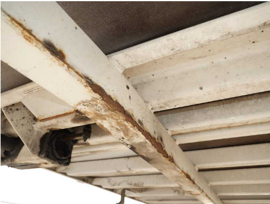
Bild 12 Fahrzeugfront Längsträger links und rechts korrodiert