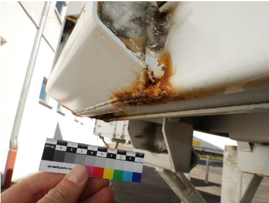
Bild 14 Aufbau Ladekante korrodiert