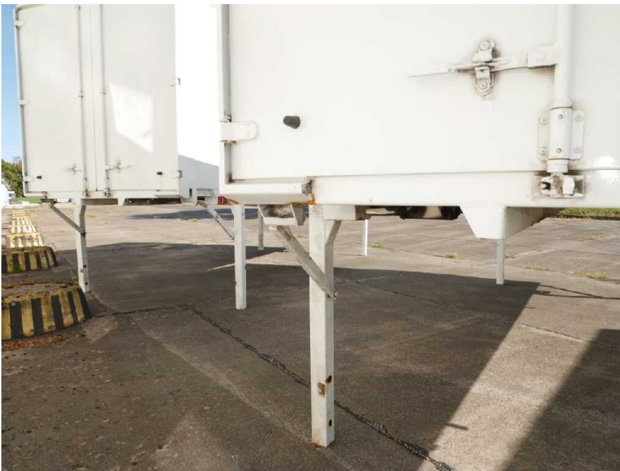
Bild 13 Aufbau Ladekante korrodiert