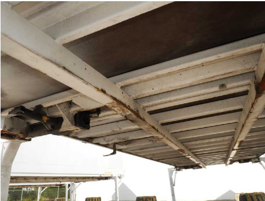
Bild 11 Fahrzeugfront Längsträger links und rechts korrodiert